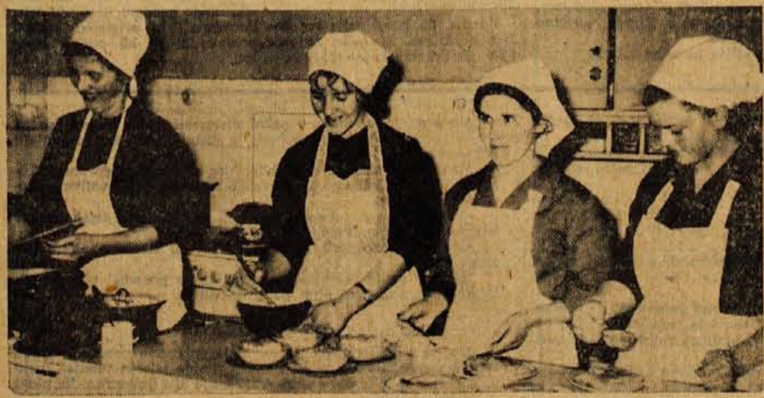
V minulih dneh so gojenke gospodinjne šole na Jesenicah polagale praktične izpite iz kuhinje