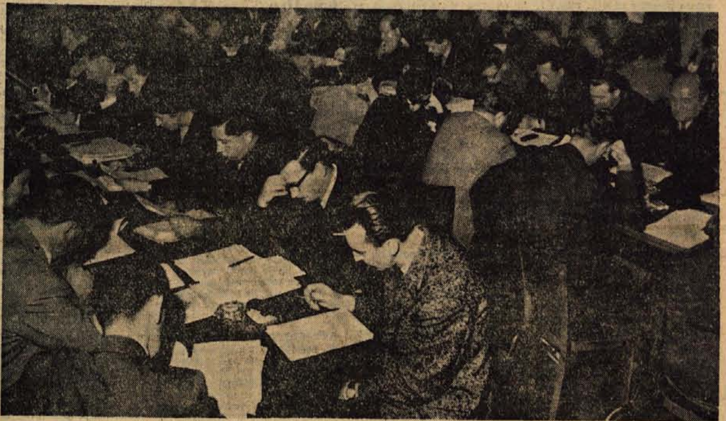
Seja občinske skupščine Radovljica