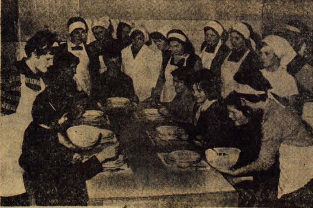
Učence gospodinjstvene šole v Poličah

je bilo na šoli 38 učenk. Obiskovale so prvi letnik v dveh oddelkih, to je v jesenskem in pomladnem. Vsako šolsko leto so učenci v šoli 5 mesecev in imajo razen teoretičnega tudi praktični pouk. Od skupnih 41 ur imajo teoretičnega pouka 29 ur. V tekočem šolskem letu je na šoli že 80 učenk, ker obstajata že prvi in drugi letnik. Razen petih mesecev na šoli se učenci med šolskim letom šest mesecev praktično izobražujejo v obratih družbene prehrane, v zdravstvenih ustanovah in gostinjskih obratih. Na praktično izobraževanje dodelujemo učenske le tistim obratom, ki so tehnično in funkcionalno primerno opremljeni in jih vodijo dobri strokovnjaki. Razen petih učnih moči z višjo šolsko izobrazbo predavajo na šoli honorarni profesorji. Večina učenk se vozi iz bližnje okolice, nekaj pa jih stanuje v internatu železarskega izobraževalnega centra. Učence jeseniške poklicne gospodinjstvene šole so izvedle že