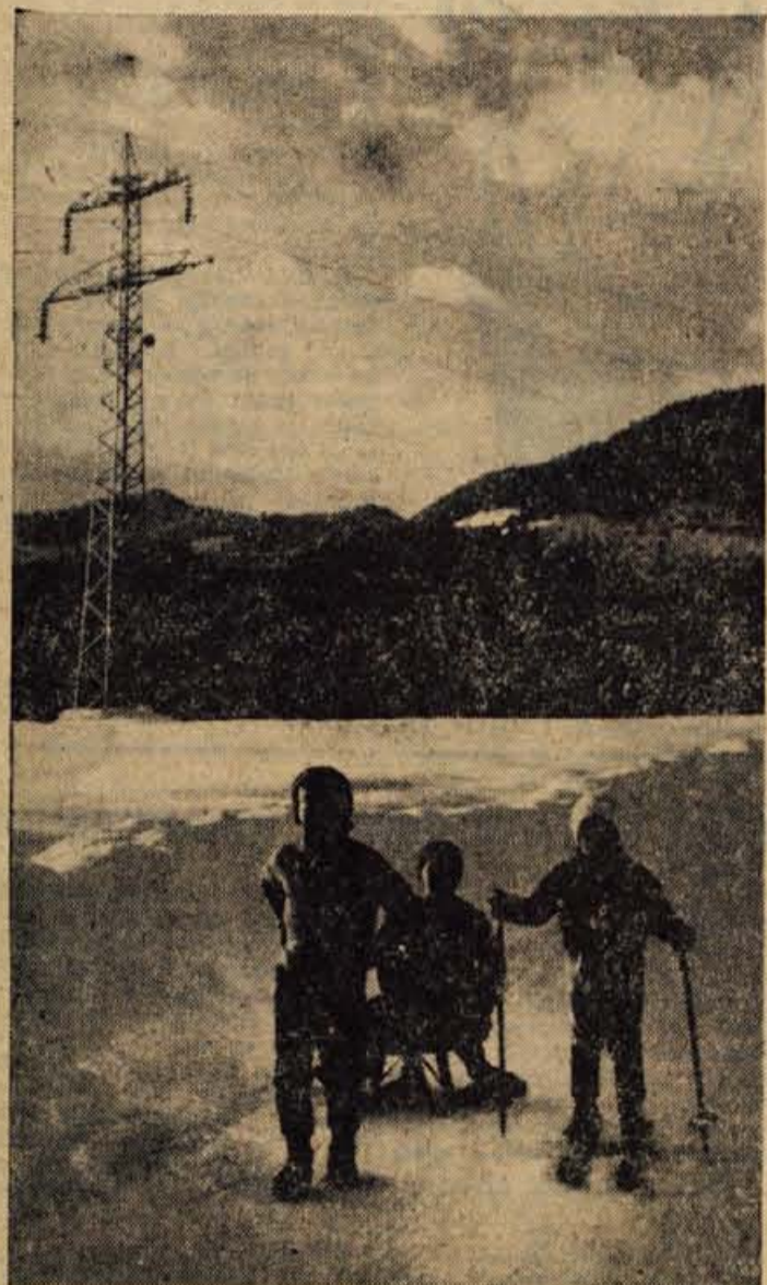
Konec dopoldanske smuke. Kljub mrazu jih prav nič ne zebe, to- da prazni želodčki so močnejši od zimskega veselja

GLASILO SOCIALISTIČNE ZVEZE DELOVNEGA LJUDSTVA ZA GORENJSKO