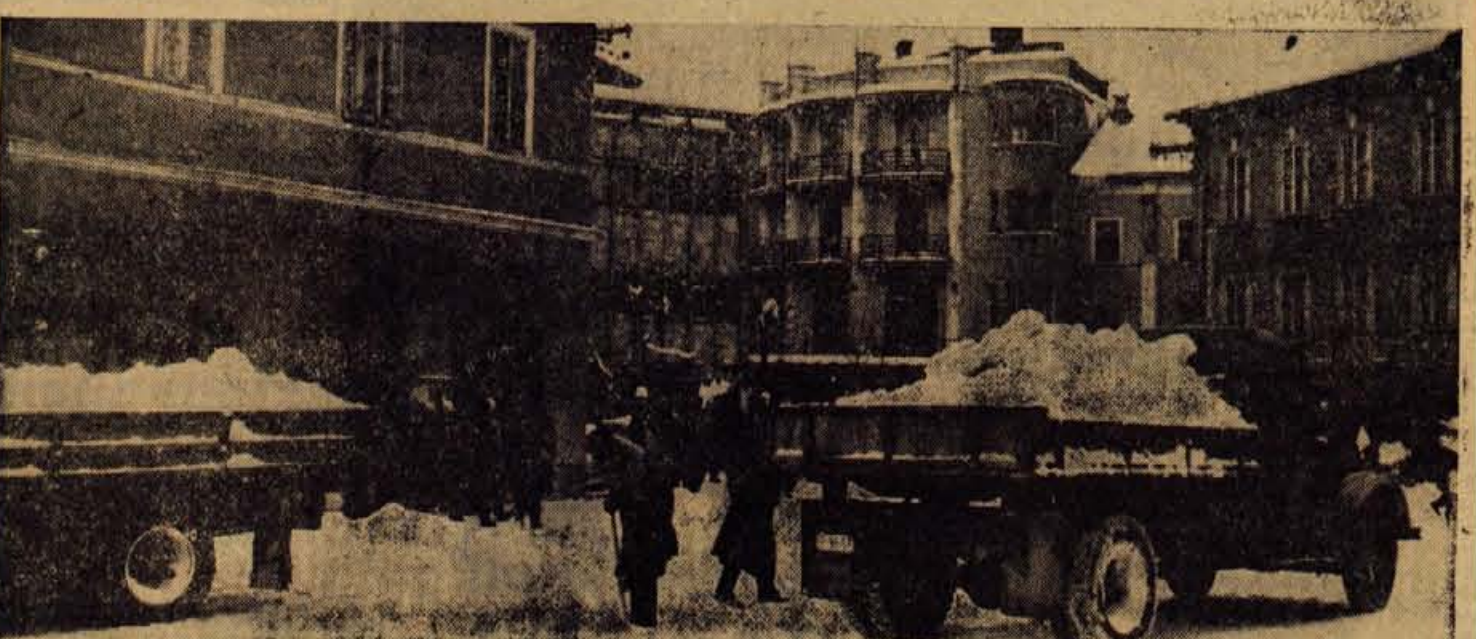
Končno so po dolgi vrsti dni, odkar je zapadlo največ snega, vendar začeli tudi v Kranju s čiščenjem ulic in pločnikov. S sedanjim načinom dela pa gre zadržati vsa prepričanja od rok. Unajmo, da bo vsaj to dobra izkušnja za prihodnjo zimo, z letošnjimi napakami bo mogoče izboljšati v naslednjem zimskem obdobju.

Kljub temu da društvo ni imelo prostorov za vadbo in tekmovalj (šole v zadnjem času je dobilo dovoljenje za gradnjo malega športnega parka z igriščem za odbojko in rokomet, z nekaterimi napravami in balinišcem), so člani udeležili kar 44 različnih tekmovalj in prireditelj. To potrjuje, da je bila društvena dejavnost kljub slabim pogojem zadovoljiva. — V društvu najbolj pogrešajo vaditeljev in funkcionarjev. — J. Rogelj