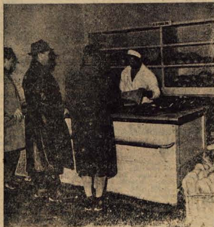
V prodajalni kruha