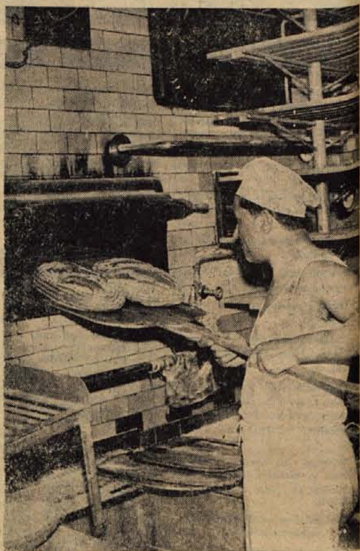
Je kruh dobro pečen? (To je zdaj vprašanje)

DRUGI PRIMER: Cela peč kruha se je zažgala. Peku, ki je nadzoroval peč, je potekel delovni čas, pa se je špo oblekel in odšel domov. Tisti, ki naj bi prišel na njegovo delovno mesto, je