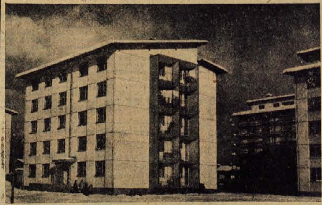
V letošnji hudi zimi je še posebno srečen tisti, ki ima udoben in topel kotiček. Nove stanovanjske hiše že skorajda povezujejo Zlato polje in naselje Vodovodni stolp

je, ki bi jih morali uresničevati samoupravni organi, in njihovo delo nasploh uspešneje, kot je bilo doslej. — B. F.