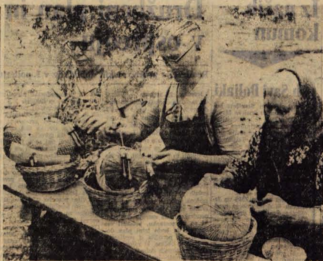
Turistično društvo Železniki bo priredilo jutri zanimivo prireditev — I. čipkarski dan, ki bo, kot napovedujejo, postal tradicionalna prireditev. Med pestrim programom bo vsekakor najzanimivejše tekmovanje čipkarjev

● O STATUTIH KS — Clani KO SZDL v Godešiču so ondan razpravljali o predlogu osnutka statuta krajevnih skupnosti in število let. O tej razpravi in njihovem mnenju bomo poročali v eni izmed naslednjih števil našega lista.