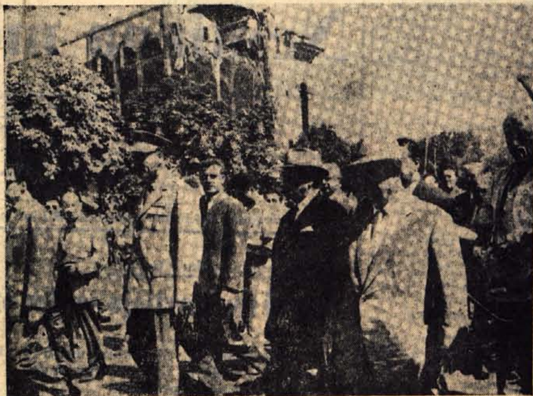
Premier Hruščov si je v spremstvu predsednika Tita v četrtek dopoldne ogledal dela v porušenem Skopju