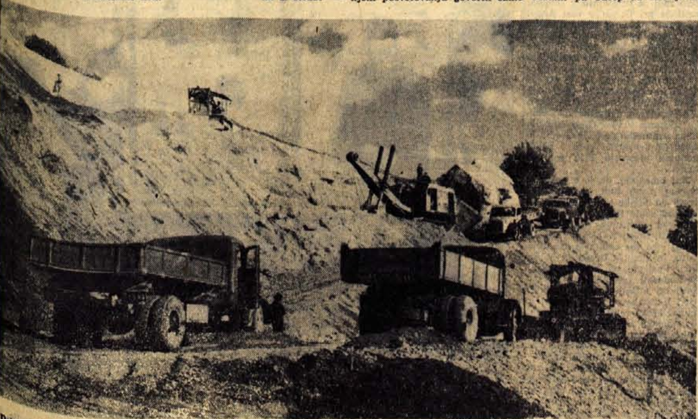
Dela na avto cesti so marsikje praktično že v teku, zlasti tam, kjer ozka prometna grla ne dopuščajo odlašanj. — Na sliki: obsežna dela v Bistrici pri Naklem

Organizatorji, mladina predvojaške vzgoje, člani kulturne skupine jeseniško-bohinjskega odreda pa tudi ostali prebivalci Jesenic se pripravljajo na velik pohod in zgodovinsko praznovanje v Cerknem, katerega praznovanje so pričeli na Jesenicah že v soboto, z otvoritvijo dokumentarne razstave »Leta 1943« in ki bo dopolnjeno tudi z raznimi propagandnimi, kulturnimi in drugimi akcijami na večer pred proslavo. — P. U.