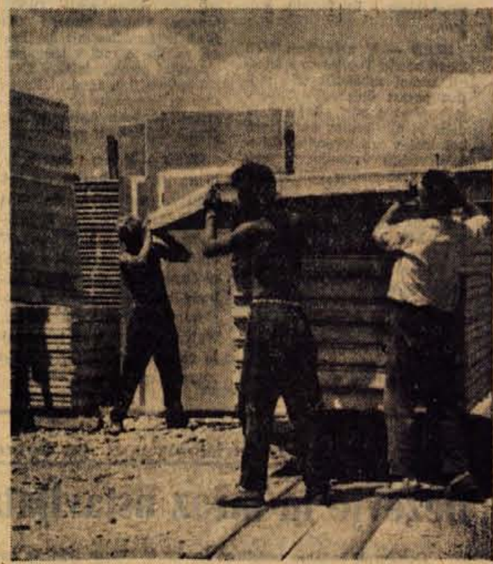
Delavci težaki imajo v teh dneh precej dela pri nakladianju materialnih hiš za »satelitsko« naselje v Skopju

● Z razvojem ostale industrije, predvsem kovinske in elektrotehnične ter z istočasnim izobraževanjem kadrov za ti industrijski panogi, ni več problem strugarjev, rezkarjev ipd., temveč je problem dobiti dovolj močnega, fizično sposobnega delavca. To pa narekuje, da se morajo njihovi osebni dohodki bistveno popraviti, ne le zaradi pomanjkanja te delovne sile, pač pa predvsem zaradi dejanske večjega vlaganja živga dela v proces proizvodnje. Oba elementa pravilnika o delitvi OD ne pomenita neko urejanje posameznih primerov, pač pa pomenita stvar in pravičen odnos do ljudi, ki delajo v proizvodnji. — St. Skrbar