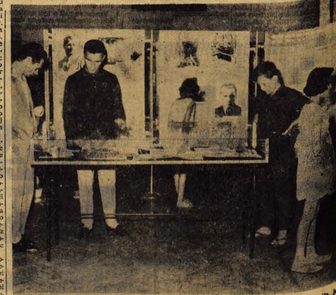
Dokumentarna razstava »Leto 1943«, ki so jo iz Kranja prenesli v prostore jeseniške gimnazije, je tudi v železarskem mestu vzbudila veliko zanimanje

PLANICA — delno oblačno, 19 stopinj; LESCE-BLED — delno oblačno, 21 stopinj; zračni pritisk 1014 milibarov, pritisk je ustaljen; JEZERSKO — zmerno oblačno, 18 stopinj in TRIGLAV-KREDARICA — delno oblačno, 8 stopinj Celzija, piha severnik s hitrostjo 25 km na uro.