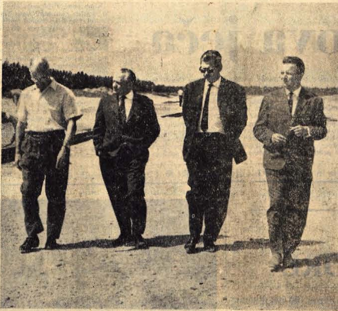
Jutri bodo na letališču v Brnikih pričeli betonirati drugi pas betonske vzletne steze. Tudi ta bo široka sedem metrov in pol, zraven njiho pa bodo kasneje zgradili še dve. — V sredo si je gradbišče v Brnikih ogledal predsednik Izvršnega sveta SRS VIKTOR AVBELJ in se s predstavniki investitorja in podjetij, ki izvajajo dela, pogovoril o sedanjem in prihodnjem delu pri izgradnji tega nadvse pomembnega objekta

Prvi osnutek občinskega statuta so v tržiški občini že izdelali in nanjo so dobili sorazmerno precej pripomb in priporočil za dopolnitev. Precej predlogov za dopolnitev ali spremembo so dale zlasti družbene organizacije. Zaradi sprejema nove ustave pa bo seveda treba prvotni osnutek občinskega statuta prilagoditi tudi številnim novim ustavnim določilom. Tako bo nedvomno morala komisija za izdelavo statuta, ki jo bodo predvidoma imenovali na prvi prihodnji seji, opraviti še kopico dela. Zlasti bo treba v novem statutu temeljito proučiti vsa vprašanja, ki se nanašajo na krajevne skupnosti. — P.