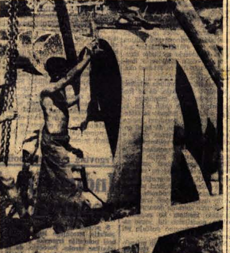
Delavci komunalnega podjetja Remont v skofji Loki so na Suhl prišli graditi novo mestno kanalizacijo. Stroški za gradnjo od Suhe pri Sori, kjer bodo čistilne naprave, pa do sotočja obeh Sor v mestu, bodo znašali 75 milijonov dinarjev