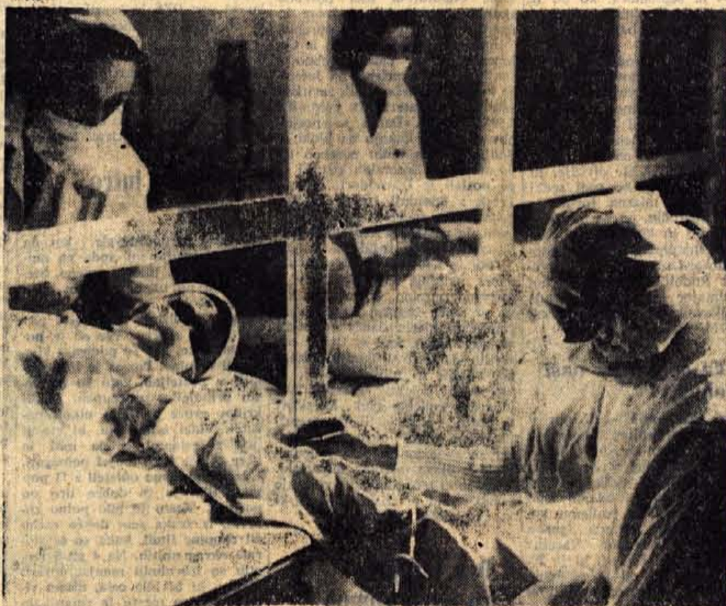
Pri oddajanju krvi za ponesrečence v Skopju v transfuzijski postaji na Golniku. Prebivavci Gorenjske so pokazali izredno pripravljenost pomagati žrtvam potresa

čija pri reševanju in organizaciji pomoči pa je čedalje bolj načrtna.