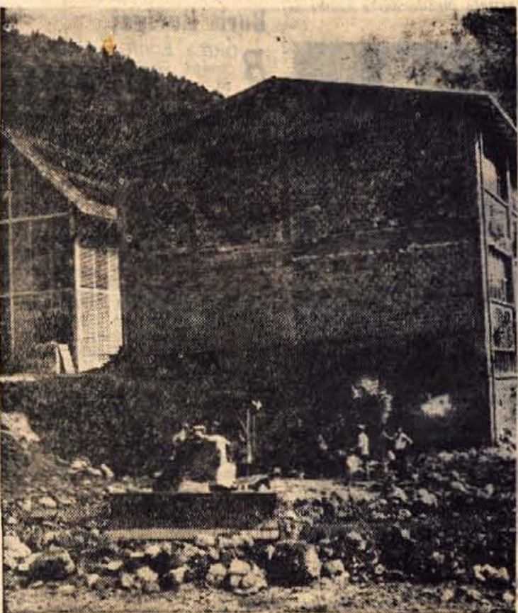
Rekonstrukcija tovarne lepenke Tržič — zemeljska dela za gradnjo novega obrata

Kako vsaj delno zadostiti obstoječim potrebam po beli lepenki? Nedvomno je edini izhod v večji proizvodnji! Toda stroji oziroma sploh vsa osnovna sredstva so v trziški tovarni lepenke že tako izrabljena, da ne dajejo nobene možnosti za večjo proizvodnjo.