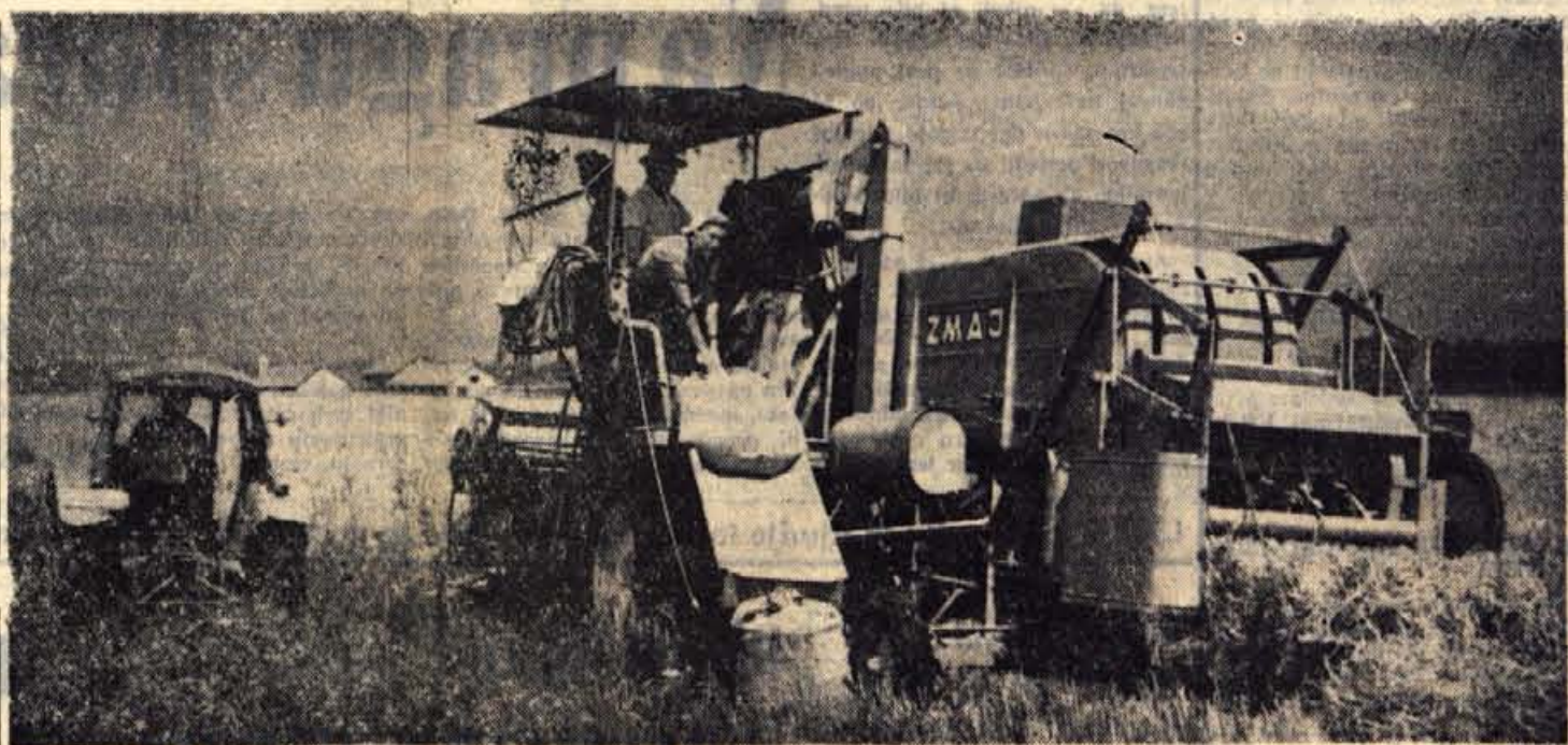
Sodobna »zetev« (brez srpov, kozolcev in mlatilnic) na obsežnih njivah Kmetijskega gospodarstva Kranj na obratu v Lahovčah. Za velikim kombajnom ostajajo le snopi slame in napolnjene vreče čistega zrna.

Tudi v radovljiški občini so potekale prireditve tako, kakor so predvideli. Jeseniški gledališčniki pa so v počastitev praznika vstaje gostovali v nedeljo zvečer z Držičevo komedijo Tripče de Utočce v Kranjski gori, na sam praznik zvečer pa v Podvinu. — P.