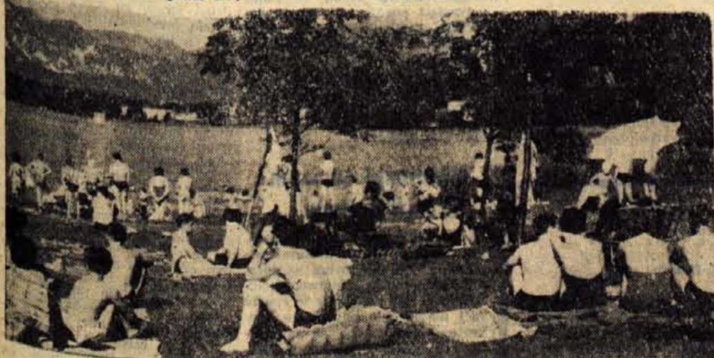
Ob zalivu Blejskega jezera v Zaki je vedno več kopavcev. Ta zaliv je kopavcem všeč, ker je ob lezeru veliko zelenega