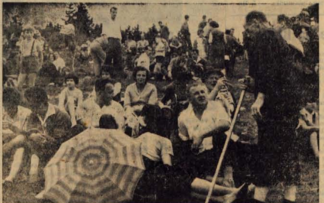
Po končanem govoru so se udeleženci četrtkove proslave na Vodiški planini posedli po travi in poslušali vesele zvoke »plansarjev«. Nekdanji borci in prijatelji iz narodnoosvobodilne vojne so obujali vesele in žalostne spomine in sklepali nova poznanstva