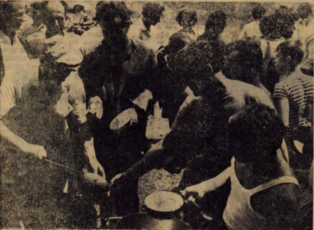
Za udeležence proslave dneva borca so gostinska podjetja pripravila tudi dosti hrane in pijače. Največja gneča je bila pri kotlu, kjer so delili enolončnico, veliko povpraševanje pa je bilo tudi po čevapčičih