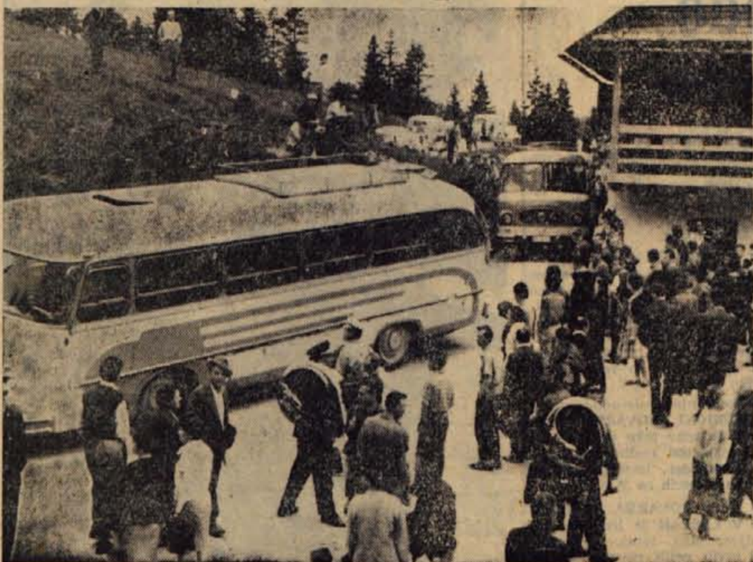
Zgodaj zjutraj so k PARTIZANSKEMU DOMU na Vodiški planini pripeljali prvi avtobus. Razpoloženje je raslo, višek pa je doseglo pred 10. uro, ko je bilo na proslavnem prostoru okrog 8 tisoč ljudi