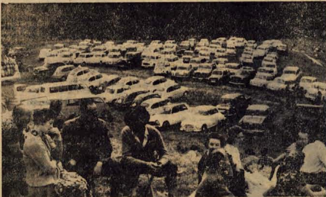
Razen v številnih avtobusih so se udeleženci pripeljali na Vodiško planino z več kot sto osebnimi avtomobili in ni dosti manjkalo, da bi zanje zmanjkalo parkirnega prostora