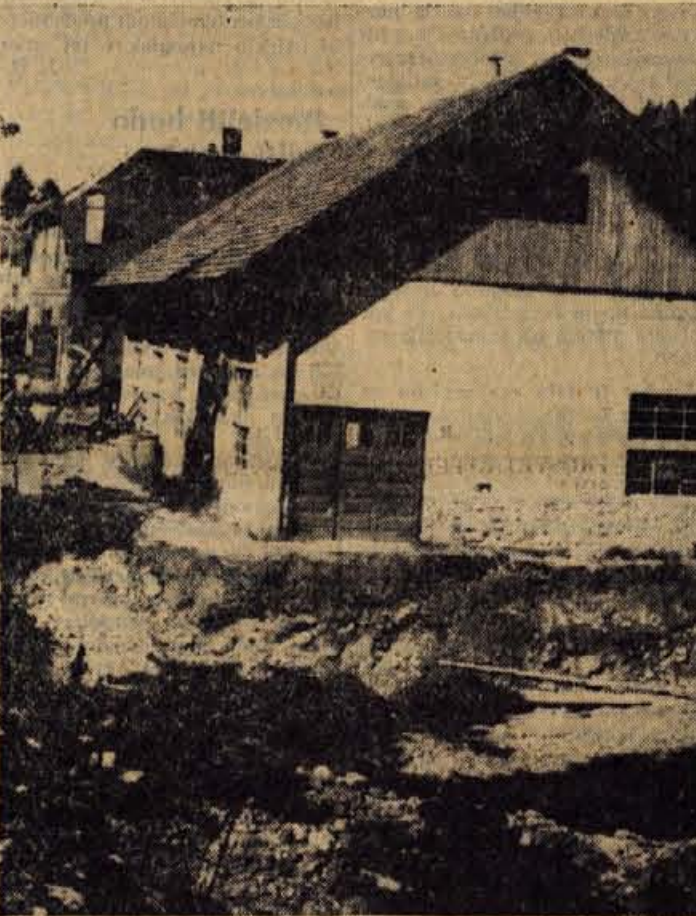
V teh dneh tovarna kos in srpov Tržič premešča stroje iz starega obrata II v nov objekt. Takoj za tem bodo staro stavbo porušili, saj bo na njenem mestu stala nova stolpnica

Naslednjo nedeljo bo spominska proslava v Cegelah, kjer bodo ob 21. obletnici ustrelitve talcev preuredili tudi tamkajšnji spomenik in priredili žalno slovesnost. — Z.