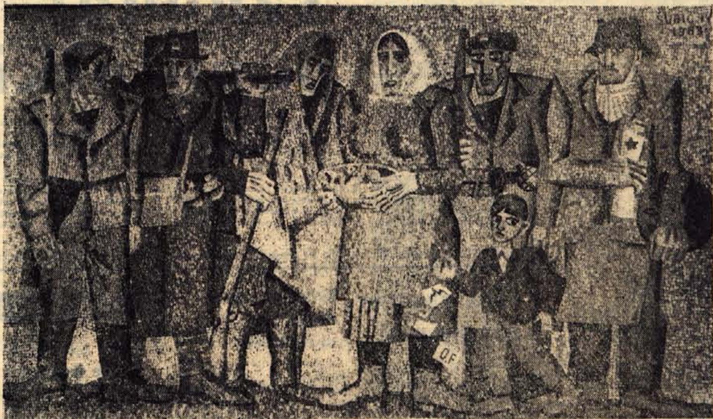
Mozak (Ive Subic, 1963) na steni PARTIZANSKEGA DOMA na Vodiški planini

Med NOB življenje ni bilo za nikogar normalno, najtežje pa je bilo za borce, naporji so bili nečloveški. Nešteto starejših ljudi je že takrat zaradi tega umiralo, nešteto mladih, za katere je bil napor prevelik, je zbolelo ali pa so zboleli pozneje. Preživeli borci tudi po vojni niso prenehali z delom, temveč so vsi ne glede na zdravje zopet doprinesli pomembne deleže pri izgradnji naše JLA, naše oblasti, pri obnovi domovine; povsod