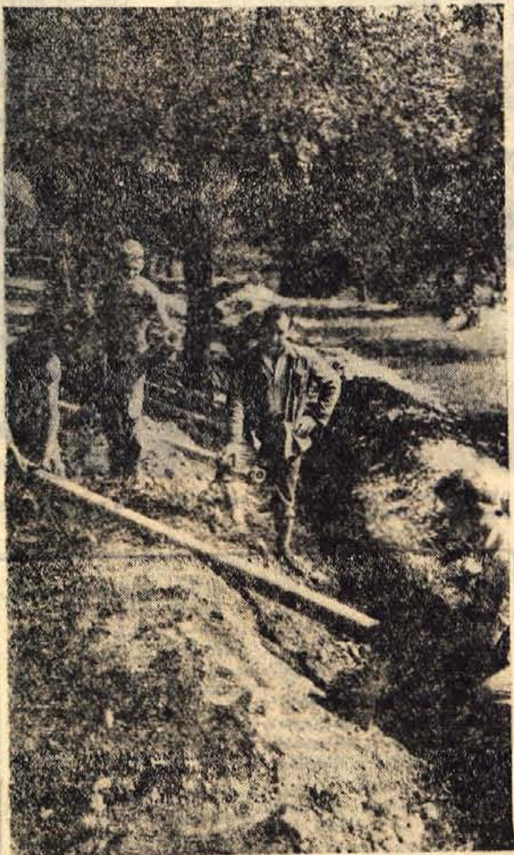
Dela pri gradnji vodovoda v Podnartu hitro napredujejo. Pri vodovodnem podjetju v Kamni gori, ki izvaja ta dela, pravijo, da bo voda po ceveh stekla še pred zimo.