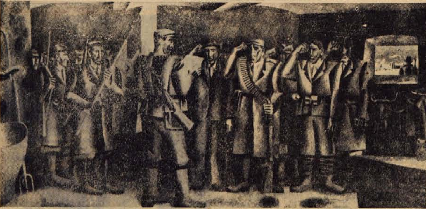
PARTIZANSKA ZAPRISEGA (Ive Subic, 1963), slika v PARTIZANSKEM DOMU na Vodiški planini, kjer bo v četrtek osrednja proslava ob DNEVU BORCA