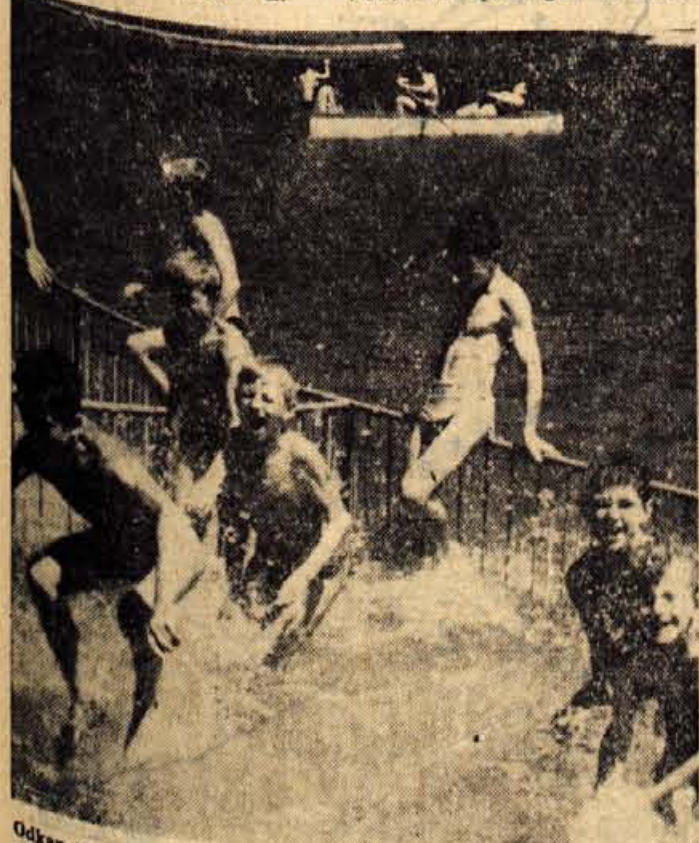
Odkar topli dnevi niso več redkost, je na Sobčevem bajerju živahno in veselo

na troboju priborili Jugoslaviji prvo mesto. Na današnji regati so Splitčani veslali s prednostjo, ker jim včeraj ni bilo treba nastopati in so bili spočiti. Borba zaradi tega ni bila nič manj zanimiva. Razen dveh jugoslovanskih osmercev so se v tej disciplini (Nadaljevanje na 4. str.)