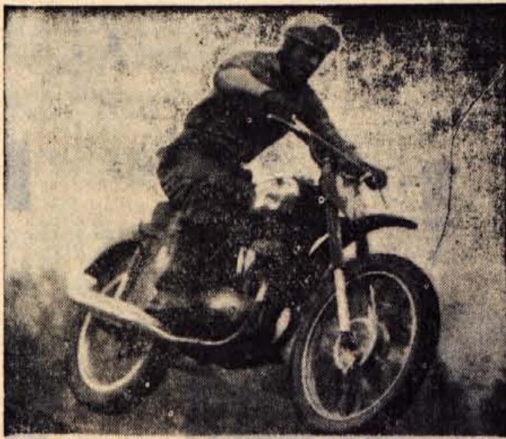
Jutri bo na prenovljeni progi pod Ljubeljem prva dirka za državno prvenstvo v moto krosu, ki se je bodo udeležili naši najboljši predstavniki tega športa. Po triziskem tekmovalju bo v vsaki republiki do jeseni še ena prvenstvena dirka, in sicer se bodo ekipe in posamezniki srečali v Prištini, Ohridu, Mostarju, Kutlini in Budvi. — Na sliki prizor z lanskega tekmovalja pod Ljubeljem