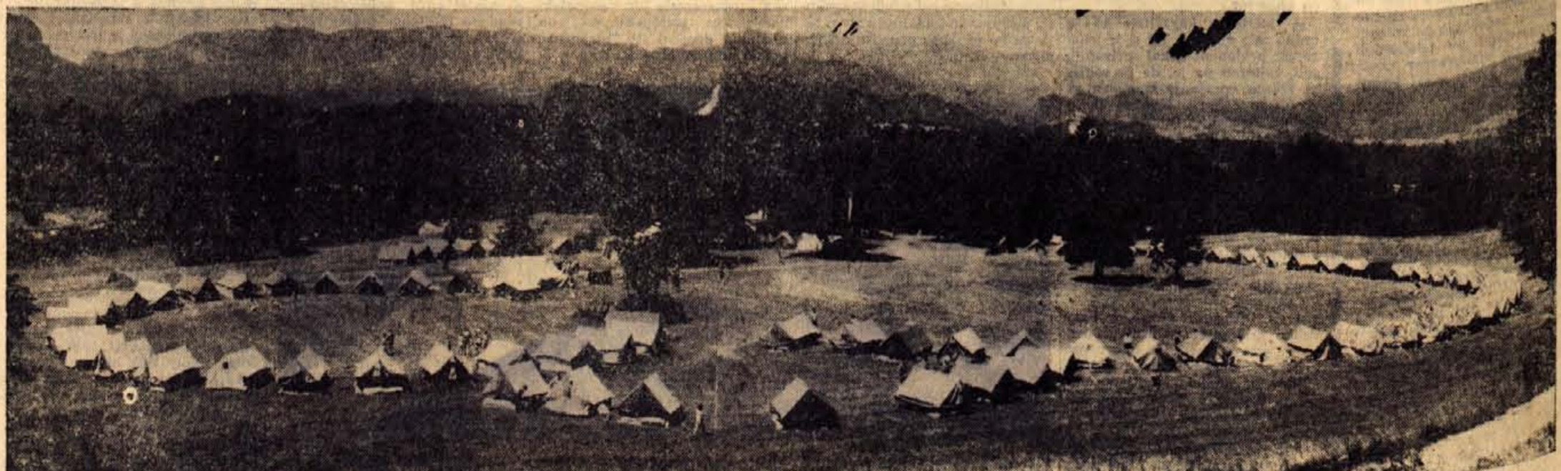
Za republiški zlet »medvedkov« in »čebelic« so nad Šobčevim bajerjem postavili lepo urejeno platneno vas, ki jo sestavlja več kot 100 šotorov