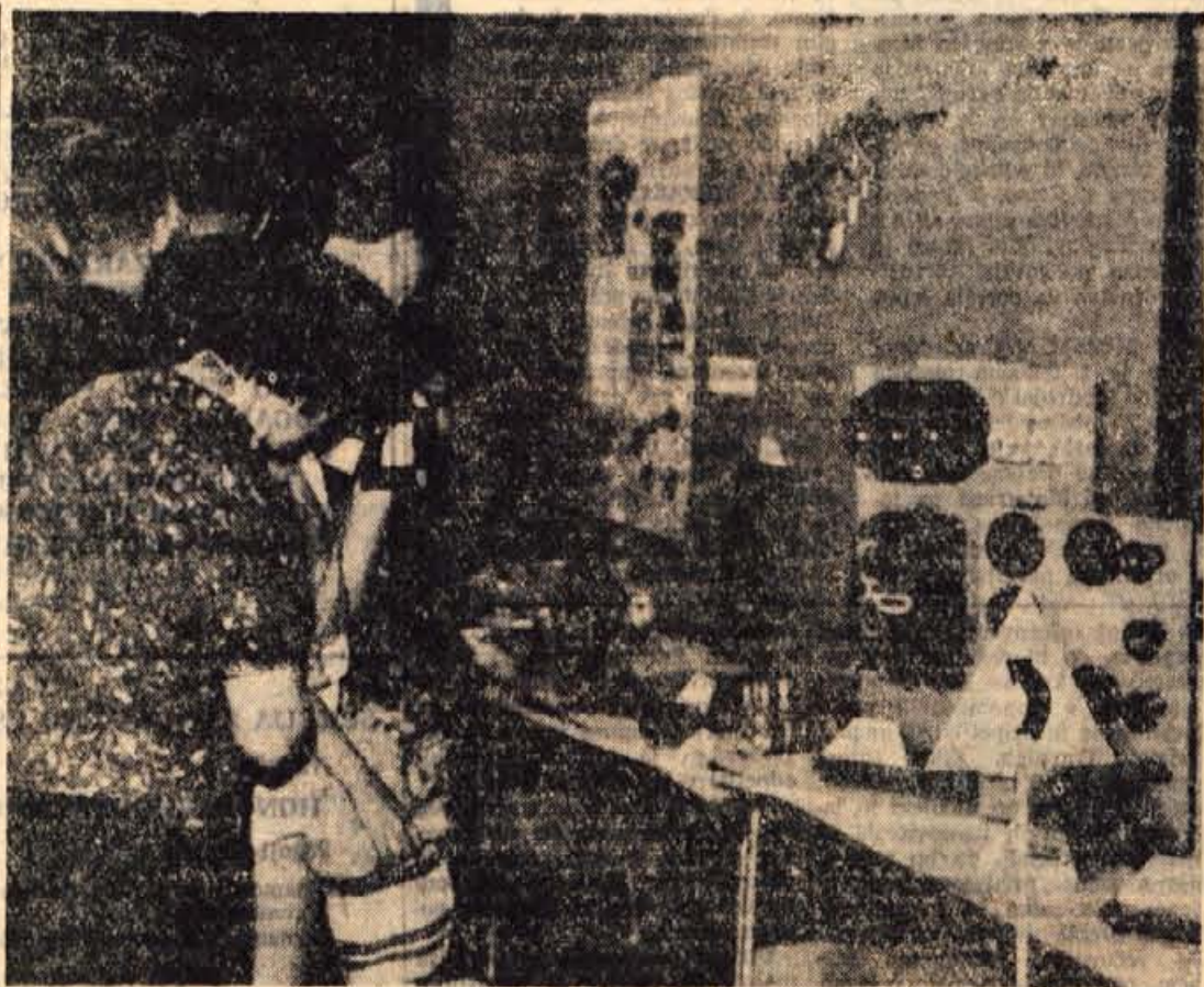
Za obsežno in kvalitetno šolsko razstavo v šoli »Lucijan Seljak« v Stražišču je precej zanimanja. Na sliki: v razstavnem prostoru, ki ga je uredil šolski center tovarne »Iskra«

Ker se obrt v naši občini ni razvijala skladno z industrijo, bodo ukrepi, ki se uvajajo, dali tej panogi gospodarstva nedvomno nove smernice in oblike dela.