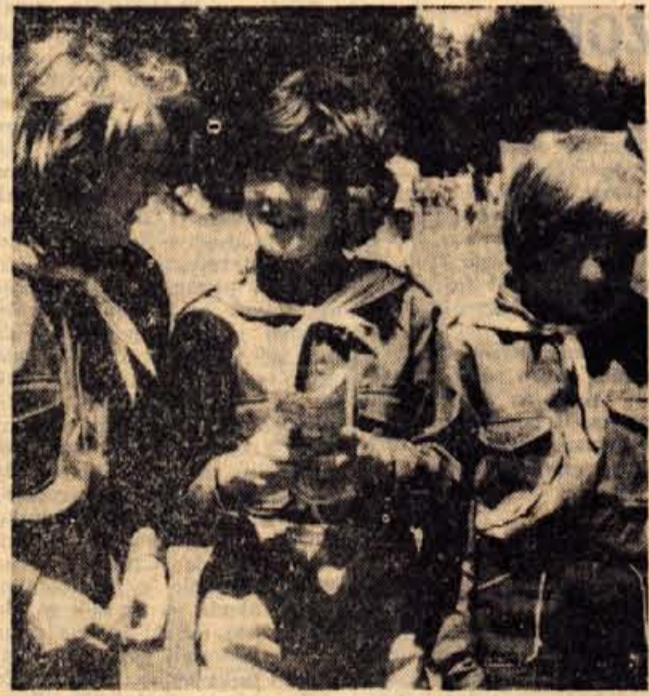
Te tri »čebelic« so pa iz Škofje Loke