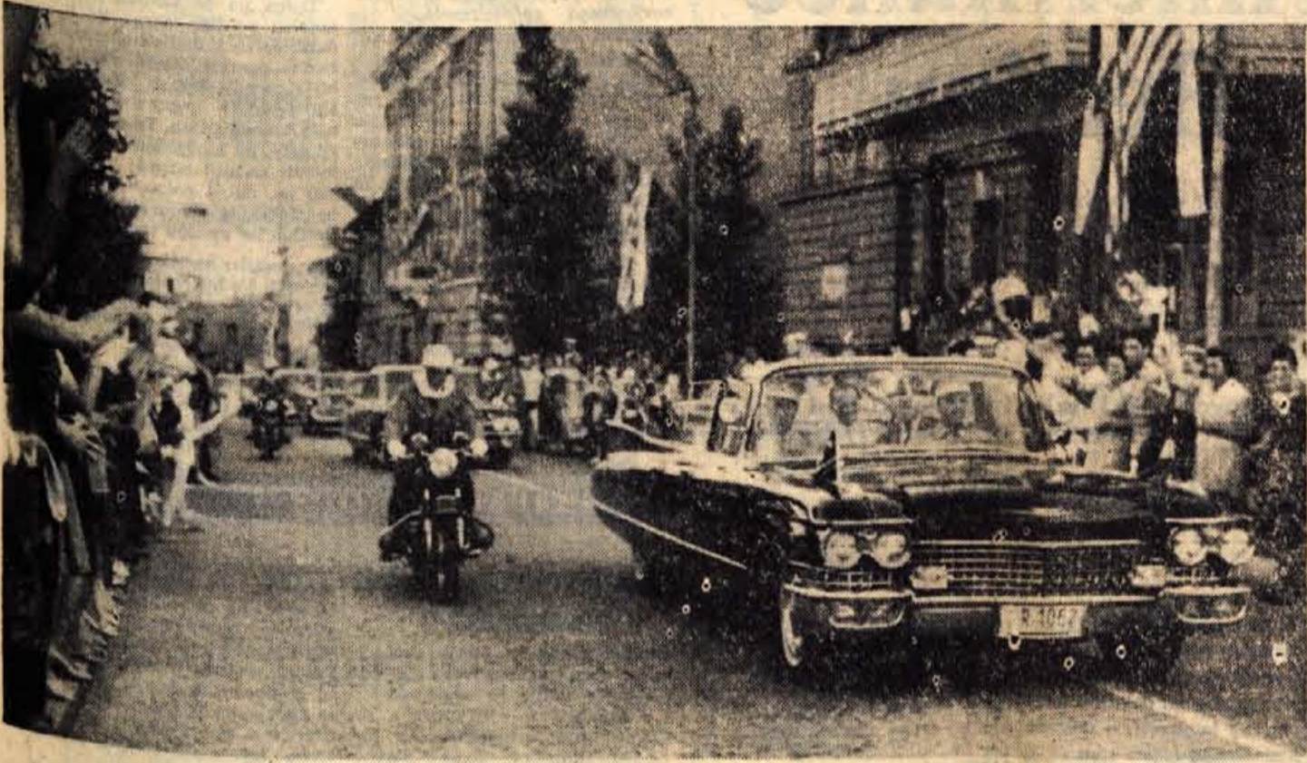
KRANJ, 25. junija — V četrtek, nekaj pred 19. uro, so številni Kranjčani pozdravljali predsednika Liberije Tubmana in našega predsednika Tita, ki sta z Brionov potovala na Brdo. Predsednika sta se z Gorenjske vračala včeraj zjutraj