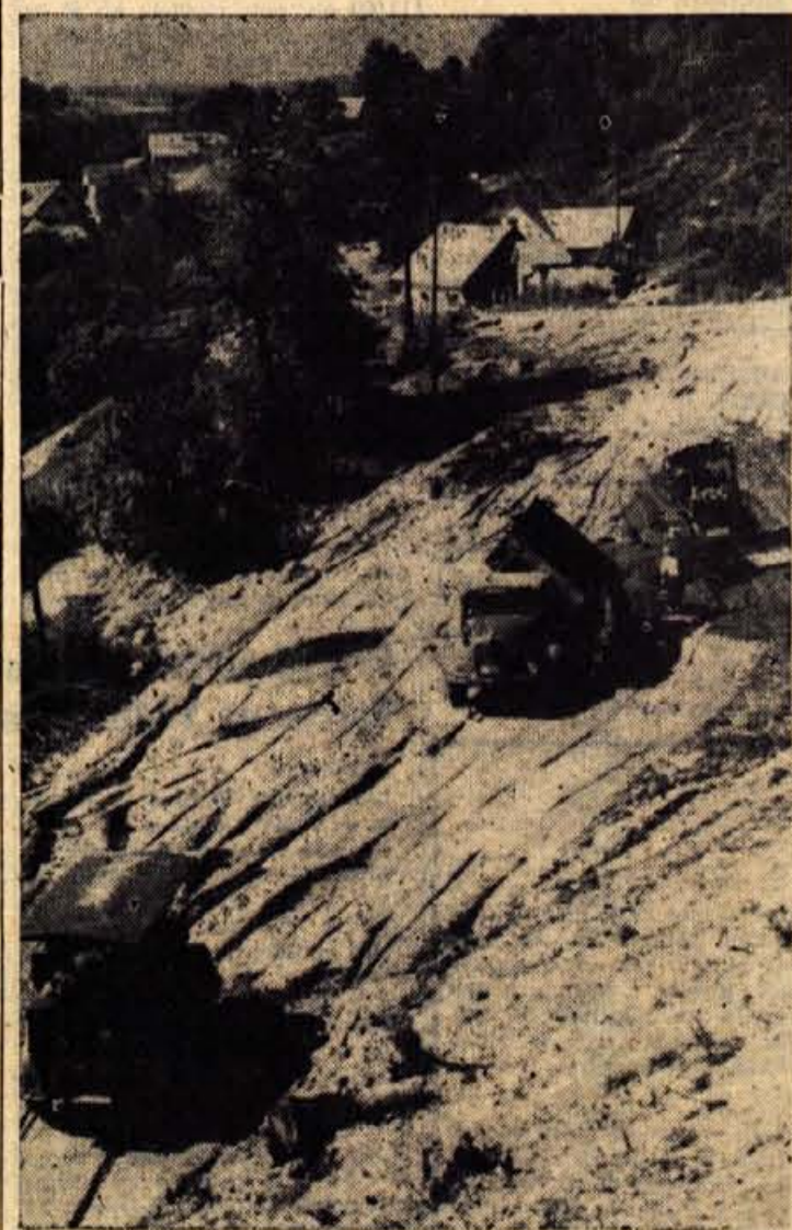
V zvezi z gradnjo nove ljubljanske ceste so tudi veliki del Blistrce sprejeli v gradbišče

Odbornike je posebno zanimalo, prvotnih 265 milijonov dinarjev kako je mogoče, da je investicij narasla kar na 600 milijonov. Obiska vsota za kranjsko bolnico od razložitve je, na kratko povedano,