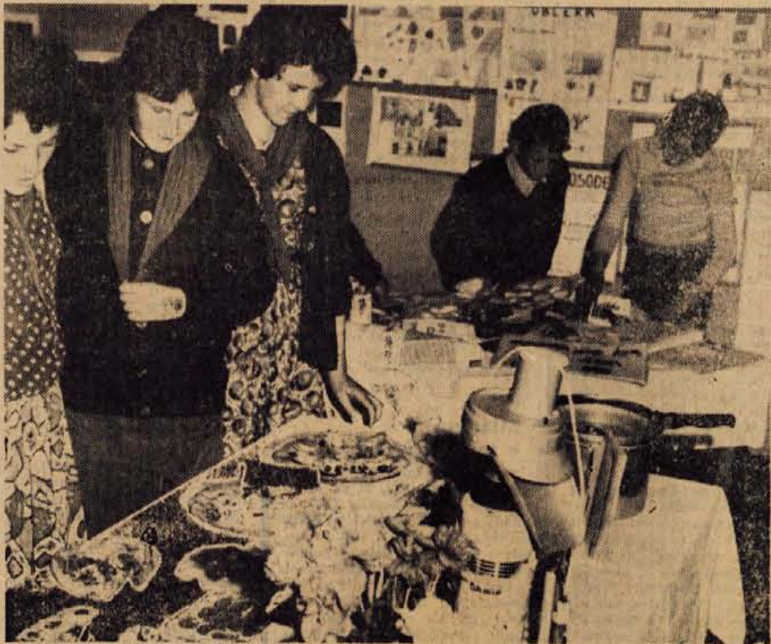
Skoraj na vseh šolah so ob koncu leta pripravili razstave izdelkov tehničnega pouka, gospodinjstva in drugih predmetov ter izvenšolskih dejavnosti. — Na sliki: z razstave v šoli »Franceta Prešerna« v Kranju

Tovarna gumijevih izdelkov »SAVA« Kranj, Gregorčičeva 8