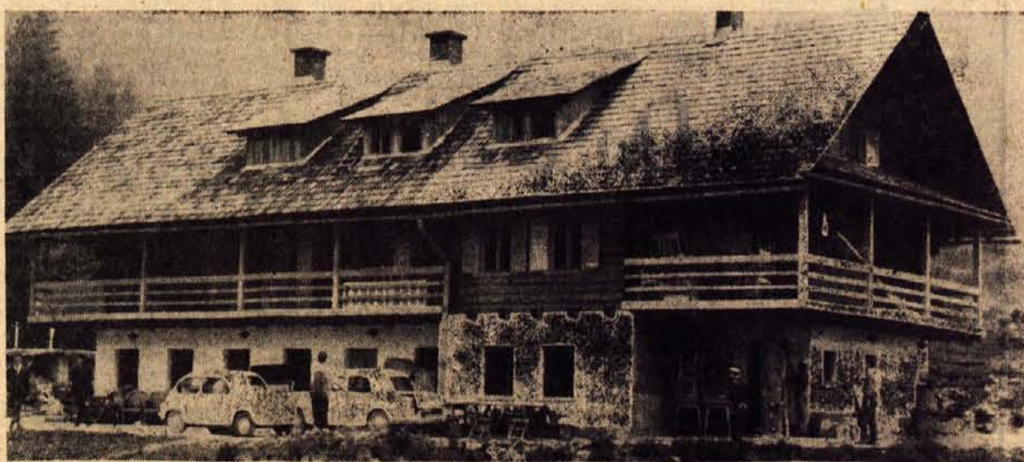
Partizanski dom na Vodiški planini na Jelovcih bo te dni gotov. Vse organizacije ZB z Gorenjskega in tudi iz Ljubljane in Dolenjskega se pripravljajo na udeležbo ob otvoritvi tega objekta, ki bo hkrati osrednja slovesnost v našem kraju ob letošnjem 4. juliju — dnevu borca

● GASIVSKI SKLAD — Z reorganizacijo krajskega okraja se je reorganiziral tudi okrajni gasivski sklad. Le-to pa je narekovalo potrebo za ustanovitev občinskega gasivskega sklada občine Skofja Loka. Vanj se bodo stekala sredstva od vplačil pri krajski zavarovalnici z območja skofjeloške komunne. Predvidoma bo v letošnjem letu teh sredstev okoli 2 milijona. V sklad pa se bodo stekala tudi dotacija občinske skupščine in drugi dohodki. Tako bo zagotovljena smotnejša uporaba in upravljanje sredstev, ki jih mora zagotoviti občina po temeljnem zakonu o varstvu pred požarom, po drugi strani pa bo novi UO razpolagal z večjimi finančnimi sredstvi in jih bodo uporabili za nadaljnji razvoj gasivske službe.