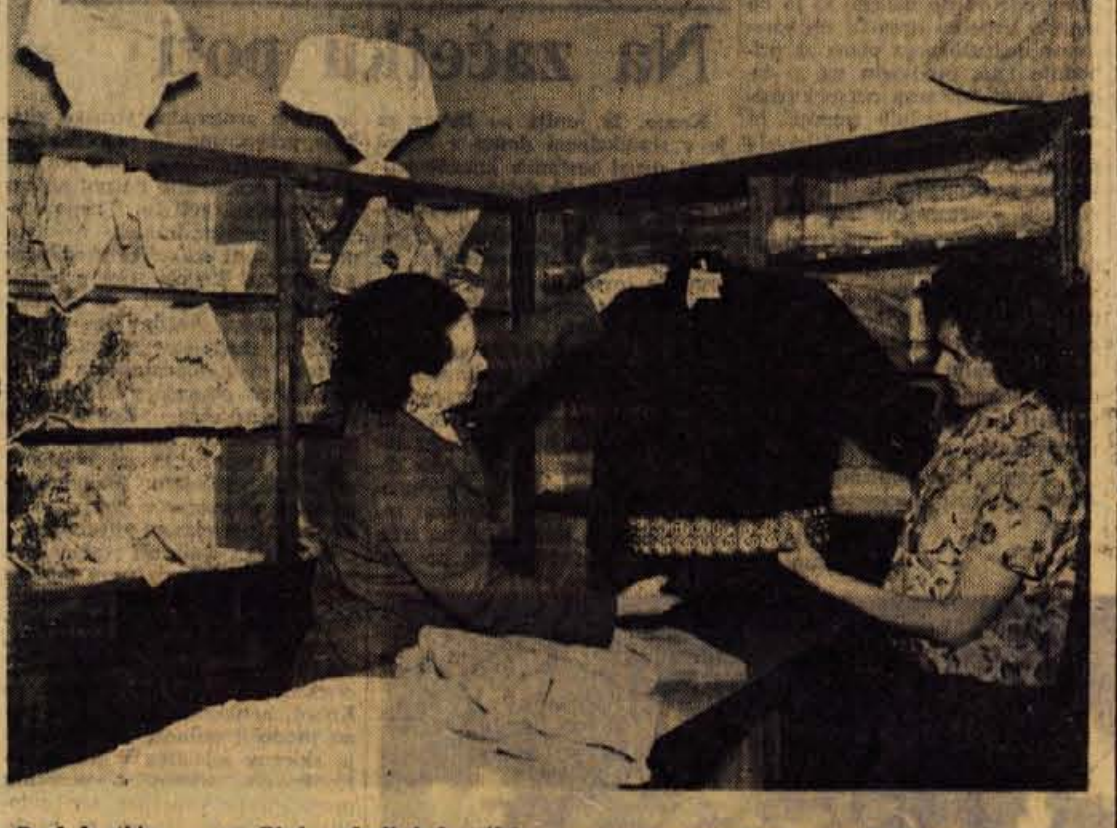
Pred kratkim so na Bledu odprli Industrijsko prodajalno tovarne »Vezeline« Bled

Občinska skuščina Kranj Komisija za štipendije