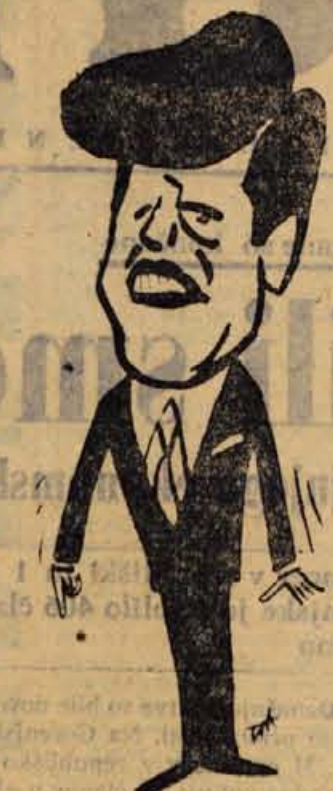
JOHN F. KENNEDY

nabrali okoli treh v ženevskem atomskem klubu? Ali je sklicanje trojnega razgovora v Moskvi samo diplomatski namig, kakršnih je bilo v preteklosti že mnogo, ali kaj več? Po počitku v Ženevi je jedrska alternativa še vedno dovolj grozna, čeprav v zadnjem času nobena atomska sila ni obnavljala poskusov v zraku. Zaloge jedrskega orožja niso nikogar prepričale, da bo z njimi mogoče