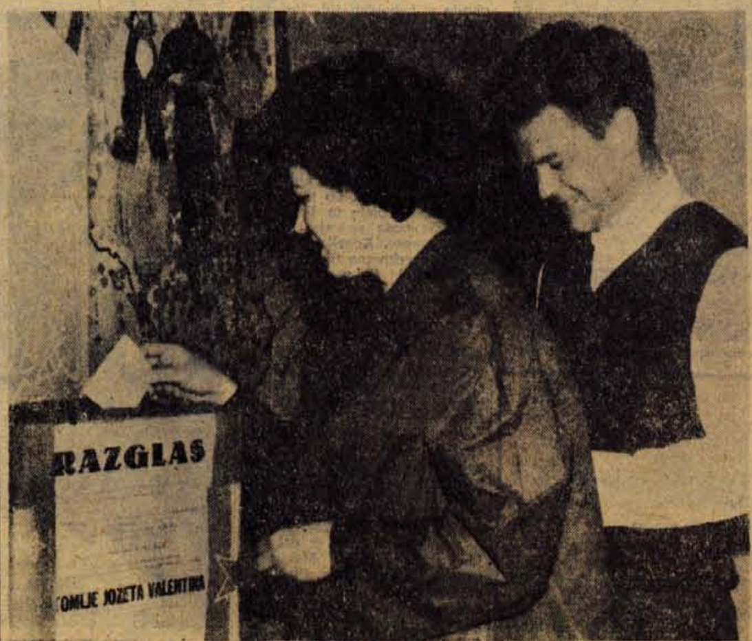
Na volišču na Blejski Dobravi so bili v dopoldanskih urah med prvimi v Jeseniški občini

Posamezne težave so pri poklicnem usmerjanju ženske mladine, saj ga spremljajo predsodki samih učenc, staršev in gospodarskih organizacij. Dejavnost poklicnega usmerjanja se vse bolj posveča tudi duševno manj razviti mladini (na Gorenjskem okoli 600) in delovnim in drugim invalidom. — M. S.