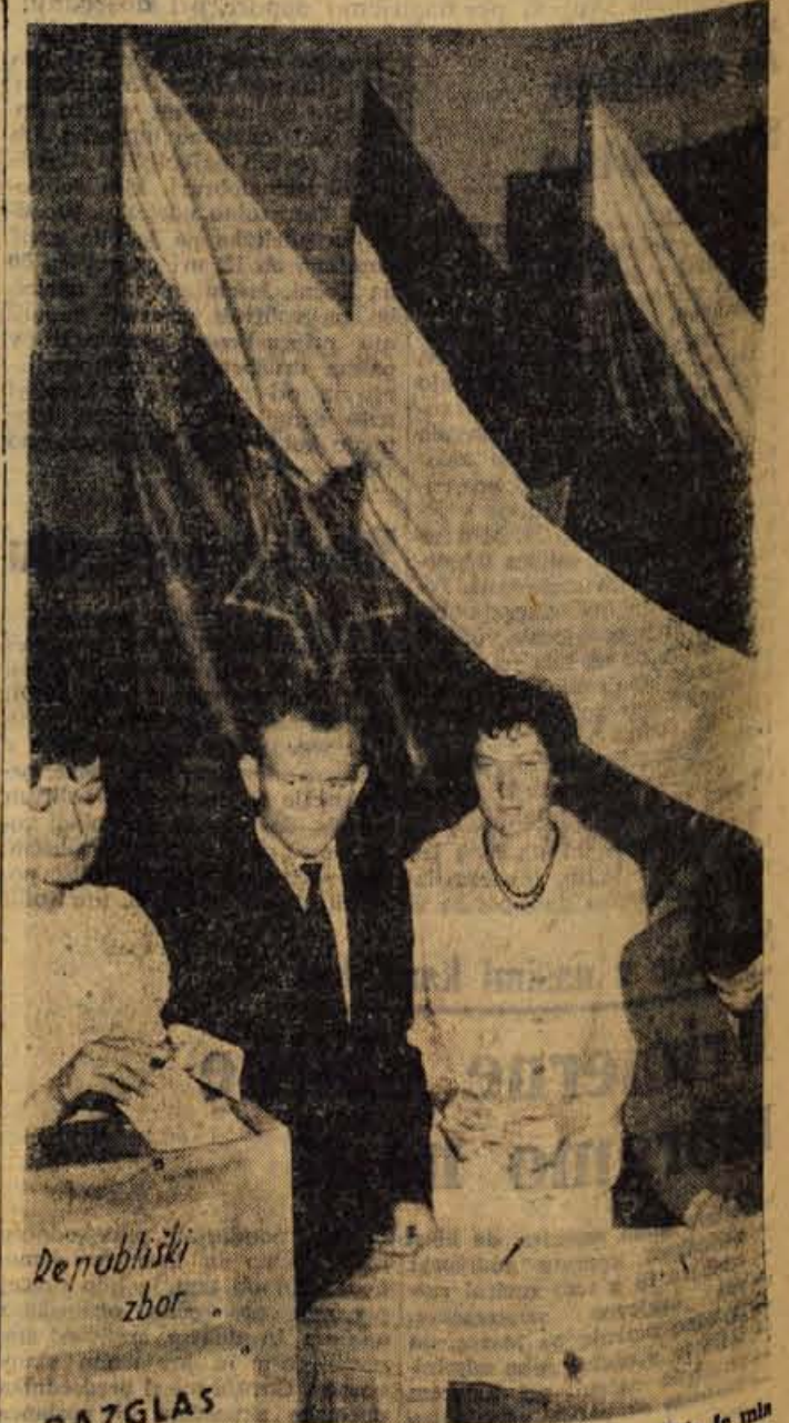
Voljšča so bila povsod lepo okrašana in urejena. Marsikje je bila dala s pomočjo ostalega prebivavstva postavila tudi majhne okrasne poslopja (voljšče v Godešiču pri Škofji Loki)