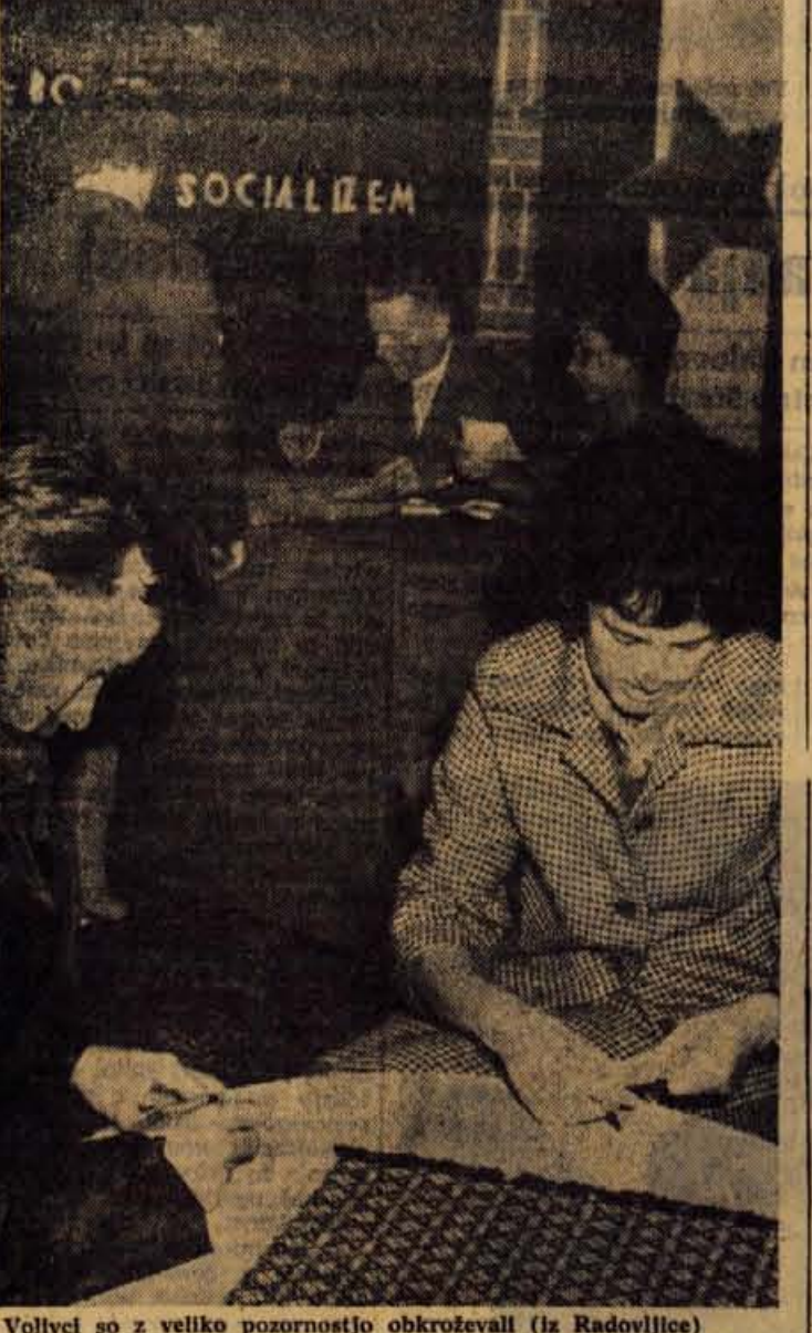
Volilci so z veliko pozornostjo obkroževali (iz Radovljice)