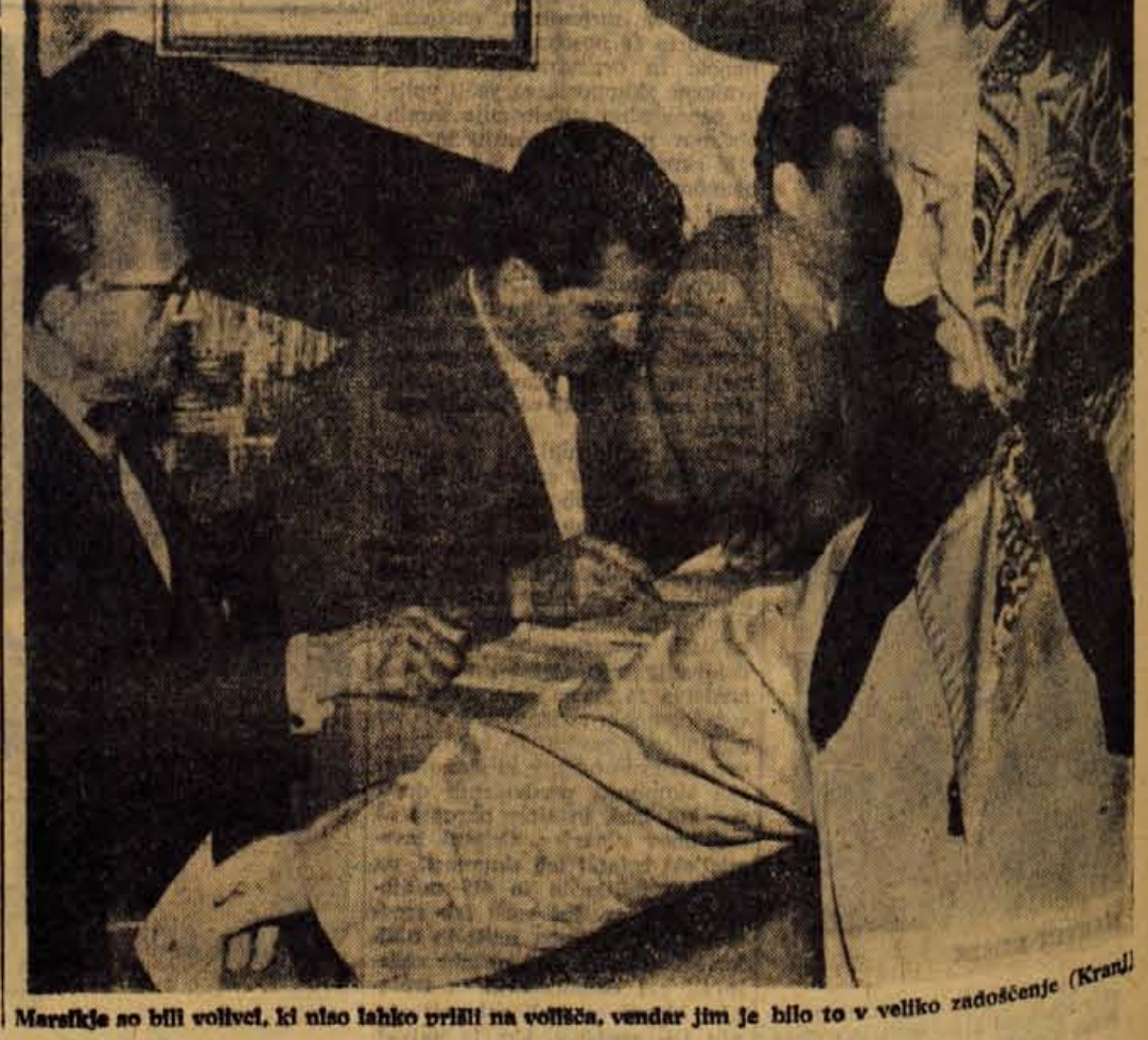
Marsikje so bili volilci, ki niso lahko prišli na voljšča, vendar jim je bilo to v veliko zadoščenje (Kranj)

VREMENSKA SLIKA Iz osrednje Francije prihaja v naše kraje val hladnega zraka, ki je povzročil znatno ohladitev in padavine. NAPOVED VREMENA ZA DANES IN JUTRI V prvi polovici tedna sicer ni pričakovati padavin, medtem ko pa bo ohladitev trajala še naprej. Pretežno oblačno in hladno vreme se utegne podaljšati do konca tedna. STANJE VREMENA V NEDELJO V Sloveniji je na kvadratni meter padlo povprečno 40 litrov dežja. Najvišje dnevne temperature so bile med 18 in 22 stopinjami Celzija, najnižje nočne pa okrog 5 stopinj.