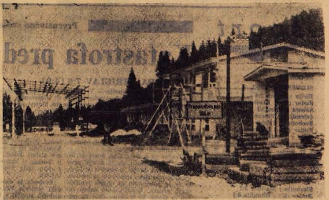
Na Korenskem sedlu gradijo večjo stavbo za obmejne organe. Novi prostori so jim glede na nagel porast prehodov motoriziranih turistov prek tega prelaza zares potrebni

Strelci Gorenjske in Furlanije pa bodo ob tej priložnosti izvedli še dvoboj z desetimi članskimi ekipami z navadnimi malokalibrskimi puškami. Prvo srečanje med strelci Furlanije in Gorenjske je bilo izvedeno pred dvema letoma in sicer na strelšču v Ljubljani, povratno pa v Cedadu v Furlaniji. Lani pa se je porodila misel, da bi ta dvoboj razširili na troboj — to je še na Koroško in tako je že lani prišlo do troboja prav tako na strelšču v Ljubljani.