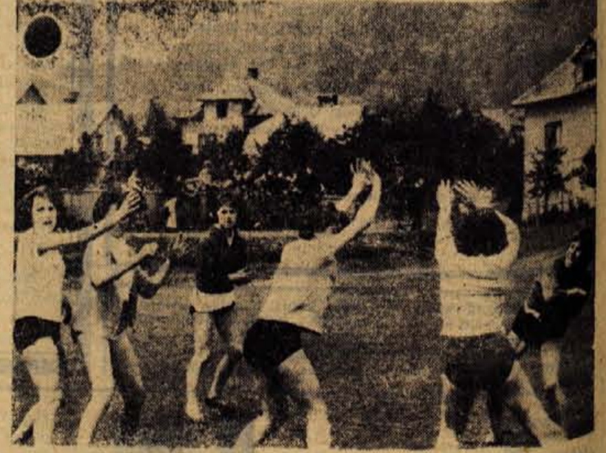
R. Minull teden so bile na Gorenjskem osnovnošolske športne igre

Rezultati: 100 m: Kaštivnik (Naklo) in Stane Galjot (T) 11,8, 400 m: Krek (T) 58,2, Zupan (T) 59,2, 1500 m: Grasič (Naklo) 4:19,2, Štros (Naklo) 4:23,6, vitišina: Sušteršič (T) 170, Lasič (T) 165, daljina: Pavlin (Naklo) 589, Kutralt (T) 557, krogla (7): Hafner (T) 12,57, Kaštivnik (Naklo) 11,28, krogla (5): Kaštivnik (Naklo) 13,45, Triler (T) 12,07, ženske — krogla (4): Mežek (T) 9,07.