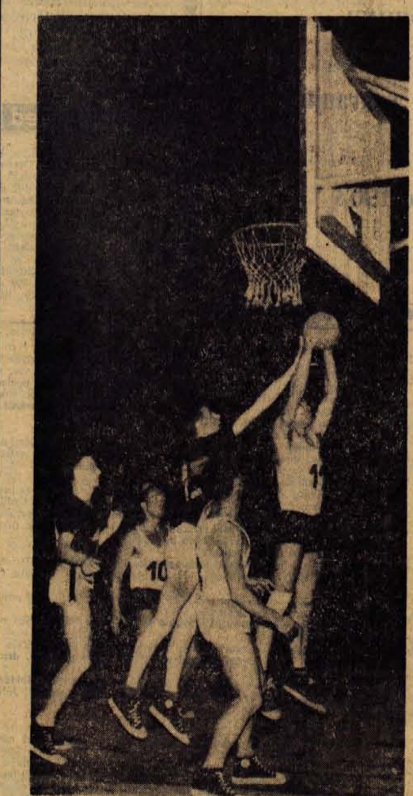
Po odličnem startu v letošnji prvi republiški ligi so košarkarji Triglava v zadnjih tekmah močno popustili in izgubili kar šest točk. Na sliki je prizor s tekmoma v Kranju, kjer je Triglav odzela točki Elektra iz Šoštanj.