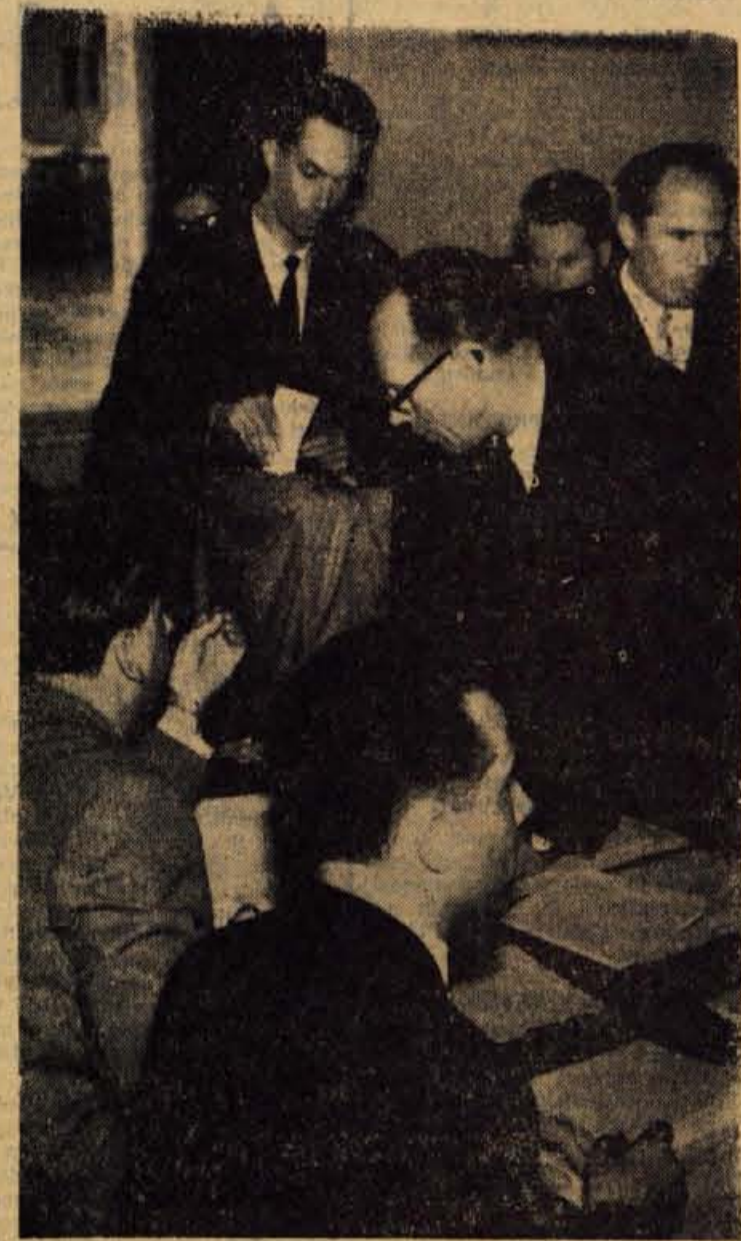
Med oddajanjem glasovnic (Jesenice)

V tem smislu je tekla tudi razprava ob imenovanju raznih organov občinske skupščine. Govorniki so poudarjali potrebo, da