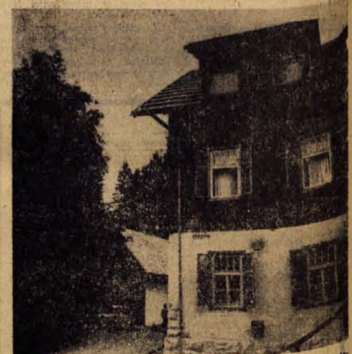
Hotel »Pod Voglom« v Bohinju že dlje pogreša dovolj velik restavracijski prostor. Toda v petih letih tamkajšnji delovni kolektiv še ni dobil 18 milijonov dinarjev kredita, s čemer bi si lahko uredil restavracijo s 100 sedeži

Takšna naj bi bila vsaj približna slika pred pričetkom letošnje poletne sezone na Bledu in v bohinjskem kotu. Premalo je novosti, če hočemo, da bo naš turizem res v najkrajšem času dal tiste gospodarsko pomembne rezultate, ki jih tako težko pričakujemo. Bled in Bohinj se glede zmogljivosti in raznih drugih udobnosti, ki jih turisti želijo in večkrat pogrešajo, od lani nista skoraj nič spremenila. Uspeh nam torej v glavnem lahko zagotovijo le gostinci s še solidnejšo potrežbo in kvalitetnejšo izbiro, kot so jo imeli lani ali v prejšnjih letih.