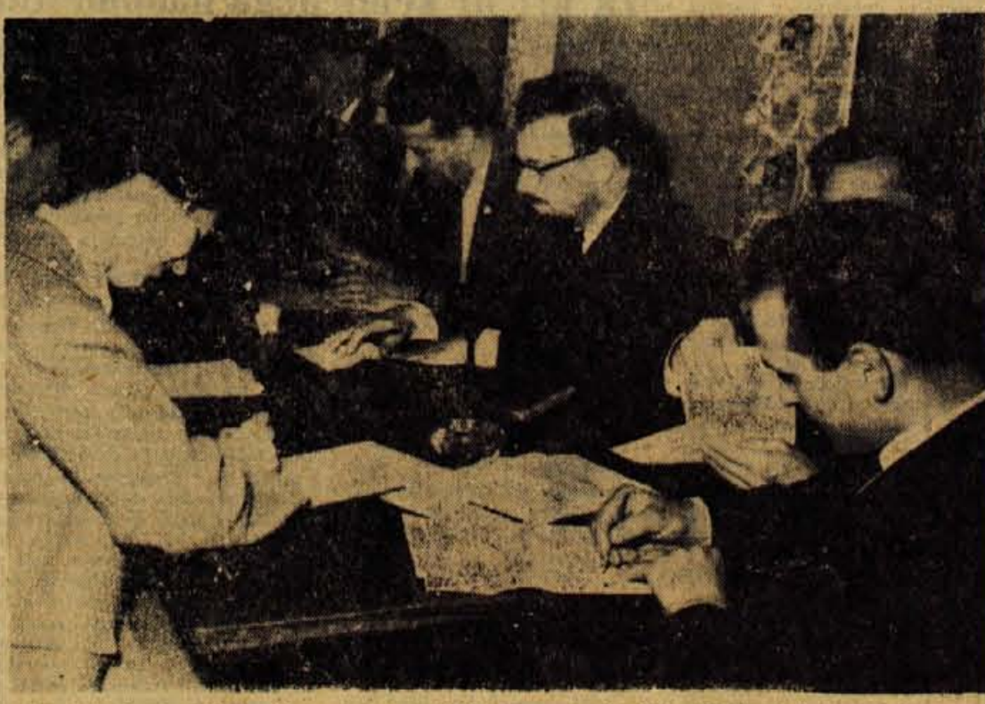
Člani občinske skupščine volijo poslance republiške in zvezne skupščine (Radovljica)

in poslanski kandidat za zvezni zbor EDVARD KARDELJ. Po vseh krajih ljubljanskega okraja se že pripravljajo na to veliko manifestacijo, ki bo združena s kulturnimi in športnimi prireditvami. Dolžnost nas vseh je, da ob tej priložnosti pokažemo svojo privrženost ciljem naši skupnosti in da ne samo z delom, marveč tudi z drugimi manifestacijami pokažemo našo enotnost.