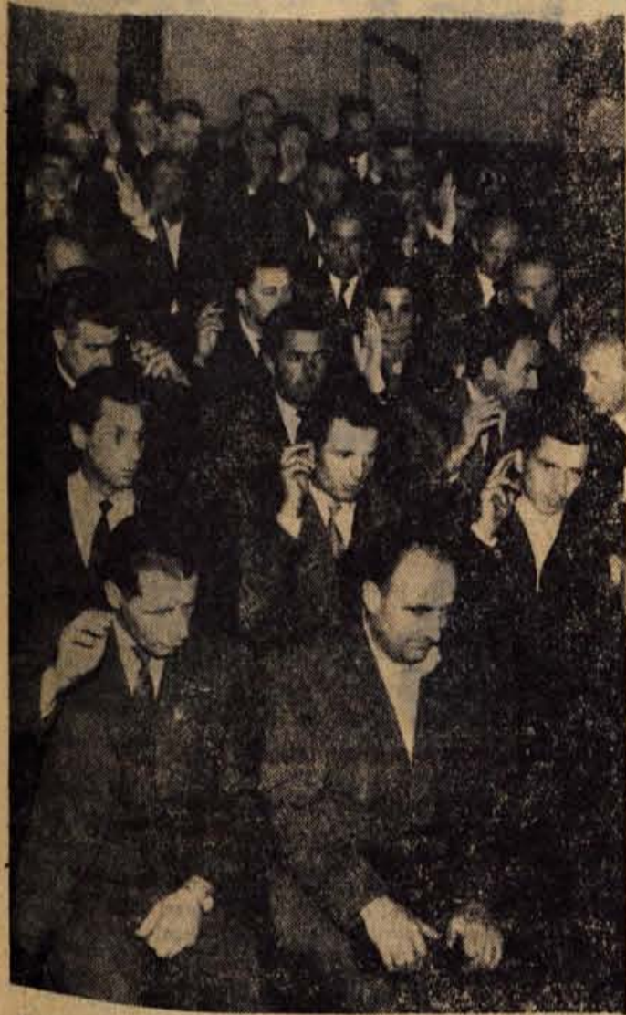
Odborniki glasujejo (Škofja Loka)