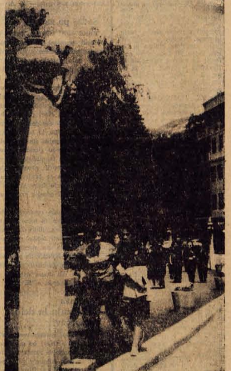
Blejska razglednica — poletna turistična sezona na pohodu

nejšim, in to na priporočilo zdravstvene in socialne službe. Počitniške kapacitete za mladino so se v letu 1962 že nekoliko povečale. DPM Bohinjska Bistrica je za potrebe mladinskega turizma opremilo mladinski dom ob jezeru z zmogljivostjo 50 ležišč. V prihodnje pa bodo opremili za letovanje in zimovanje tudi opuščene prostore osn. šole na Gorjušah. Iskati pa bi bilo treba možnosti za letovanje v počitniških domovih gospodarskih organizacij. Na skupščini so menili, da bi bila takšna oblika letovanja uspešna le tedaj, če bi v domu ustropili prostore za celotno izmenno otrok, seveda le pod strokovnim vodstvom. — J. B.