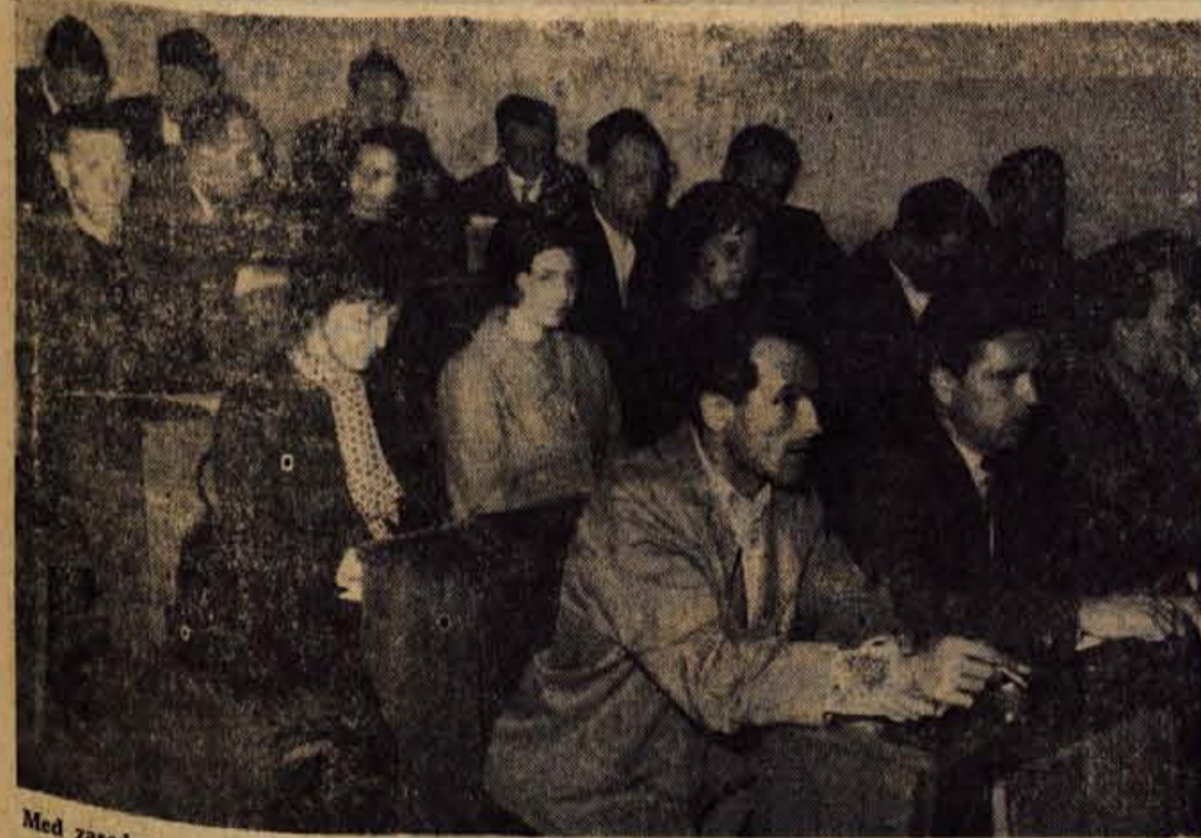
Med zasedanjem občinske skupščine (Tržič)