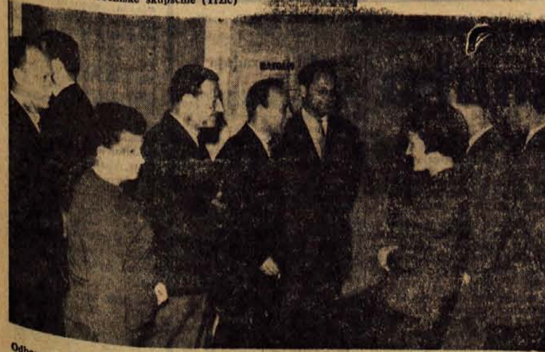
Odborniki med odmorom (Kranj)