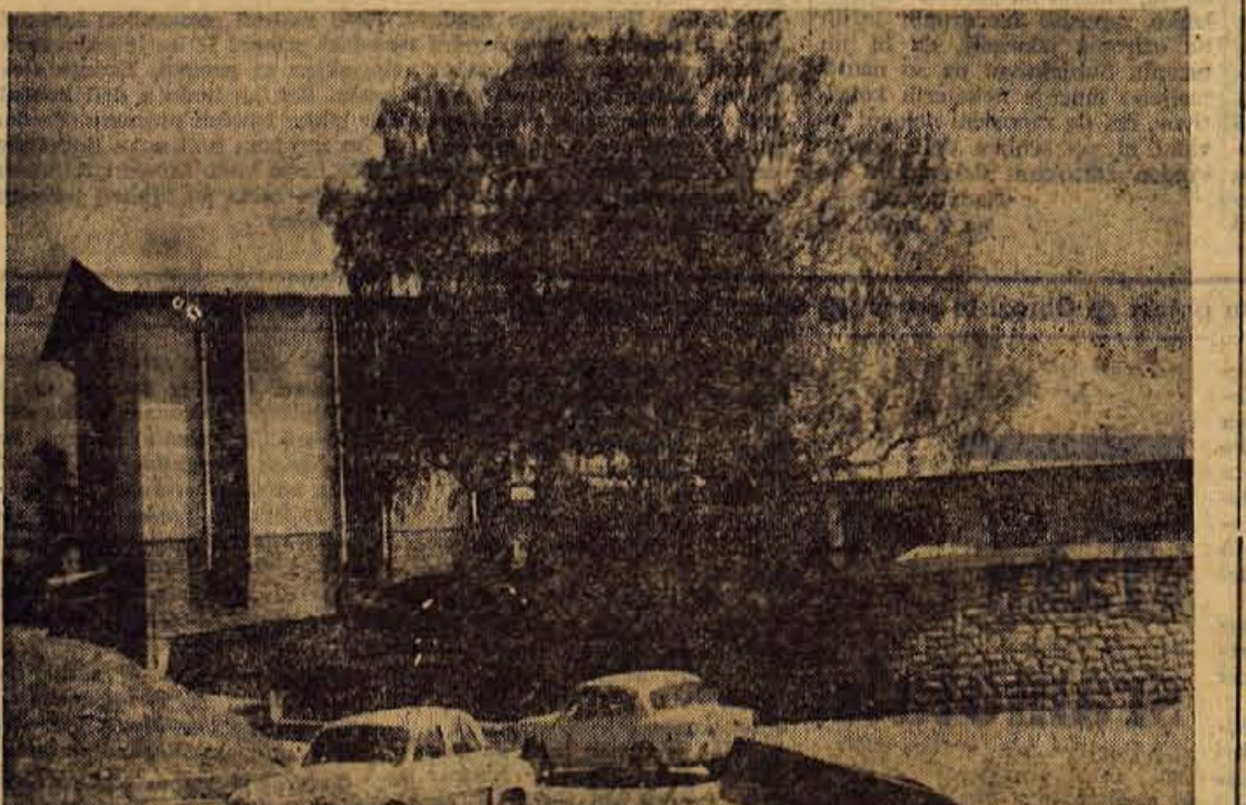
Hotel na Smarjetni gori je v glavnem dograjen. Velika škoda bo, ker bo, kot kaže, ta težko pričakovani objekt na priljubljeni izletniški točki nad Kranjem letos spet neizkoriščen. Manjka mu le še nekaj notranjih uredovalnih del, pa bi bil pripravljen za sprejem gostov.

Cilji nadaljnje skrbi za oddih in rekreacijo v prihodnje vse bolj vodijo k sodelovanju na določnem območju in ustanavljanju počitniških skupnosti, k organizaciji okolja, kjer živi naš delavec, k uveljavljanju vsakdanjih izletov itd. Toda neposredno bomo vse bolj prehajala na posameznika, samostojnega in svobodnega potrošnika dobrin. — K. M.