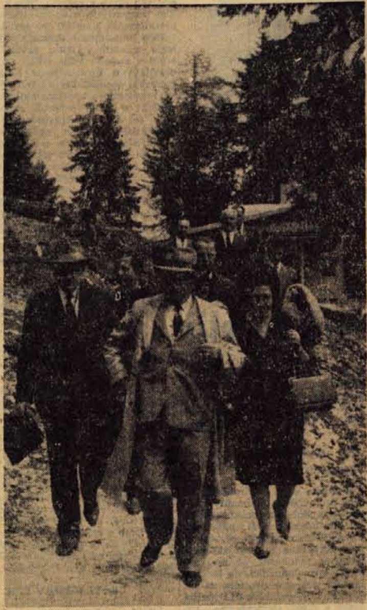
Predsednik Tito s soprogo Jovanko in drugimi spremljevalci minuli petek na Vitrancu.