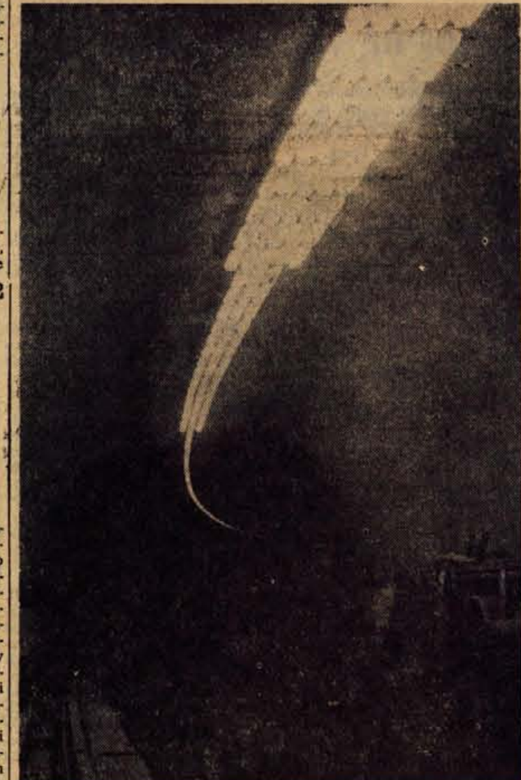
Notranost ljubelskega predora. Novi nadvse pomemben komunikacijski objekt za mednarodni tranzitni promet je na jugoslovanski strani v glavnem dograjen in pripravljen za promet. Zadnja električno instalacijska dela so pri kraju. Brž ko bodo z deli končali tudi naši severni sosedje, bo predor lahko izročen prometu. Predor pa bo dobil pravo veljavo šele, ko bo zgrajena tudi nova ljubeljska cesta. Pripravljalna dela za gradnjo te ceste bodo kmalu zaključena in po dosedanjih predvidenjih bo nova cesta na Ljubelj oziroma do ljubeljskega predora dograjena še letos