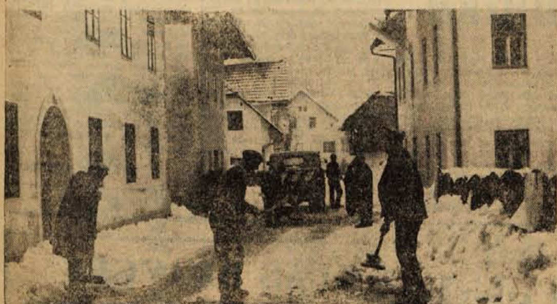
V Kranjski gori redno čišijo sneg s ceste I. reda

GLASILO SOCIALISTIČNE ZVEZE DELOVNEGA LJUDSTVA ZA GORENJSKO