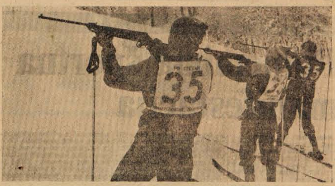
Prizor s sobotnega gorenjskega prvenstva pionirjev v Lancovem

Rezervni oficirji in podoficirji so imeli v Gorenjski predlinici v torko prvo predavanje iz serije predavanj, ki se bodo vrstila do junija letos. Udeležba na predavanju je bila zelo dobra in kaže, da je novo vodstvo ZROP na Trati dobro zastavilo svoje delo. — V. R.