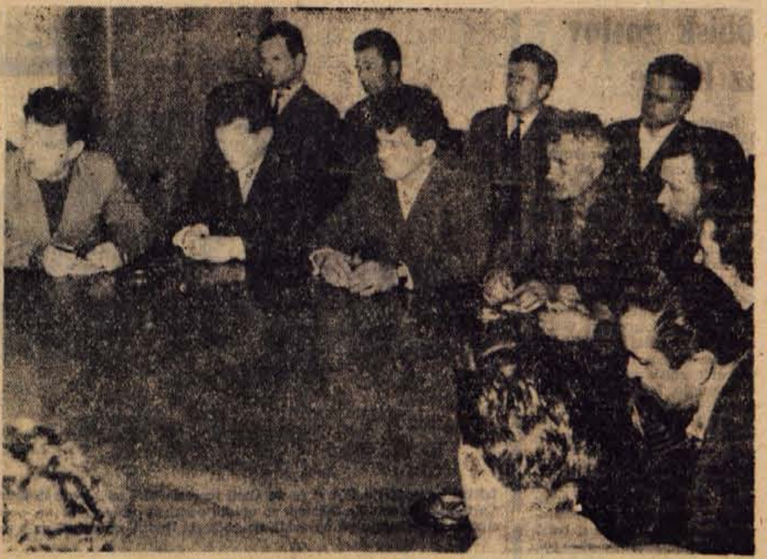
Del kandidatov za zbor delovnih skupnosti med pogovorom

Radovljica — V krajih radovljiške občine se pridno pripravljajo na praznovanje dneva mladosti in stoletnice Rdečega križa. Sote bodo priredile samostojne šolske proslave in javne nastope, športna tekmovanja in prireditve »Pokaži, kaj znaš«. Ponekod bodo praznovanje dneva mladosti povezali s počastitvijo 10-letnice RK. V ta namen prirejajo tudi tečaj prve pomoči za štane podmladka. Med absolvente osmih razredov Bleda slovesno sprejeli med štane RK. V dneh praznovanja mladosti se bodo pionirji in mladinci pomenili tudi na posebnih prireditvah pred javnostjo MLADINA PRED MIKROFONOM; pripravljajo pa se tudi mladi igralci, glasbeniki, recitatorji, pevski zbori, instrumentalne skupine in drugi. — J. B.