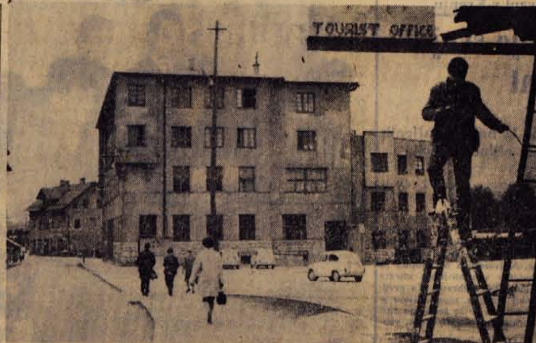
Izletniško podjetje ITA si je na Cesti maršala Tita na Jesenicah uredilo nov lokal, ki ga bodo otvorili v prihodnjih dneh. Za lokalom so uredili parkirni prostor, ki bo predvsem dobrodošel številnim voznikom, ki prihajajo po opravkih na občinski ljudski odbor ali na upravo carne