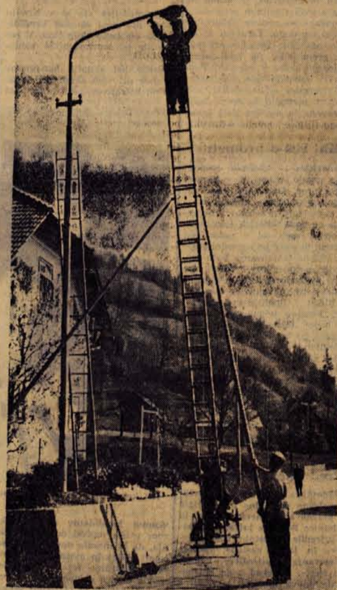
V Gorenji vasi so te dni urejali cestno razsvetljavo

Na razstavi, ki bo ves teden odprta od 9. do 19. ure, bodo obiskovalci lahko poslušali tudi strokovno razlago. — St. S.