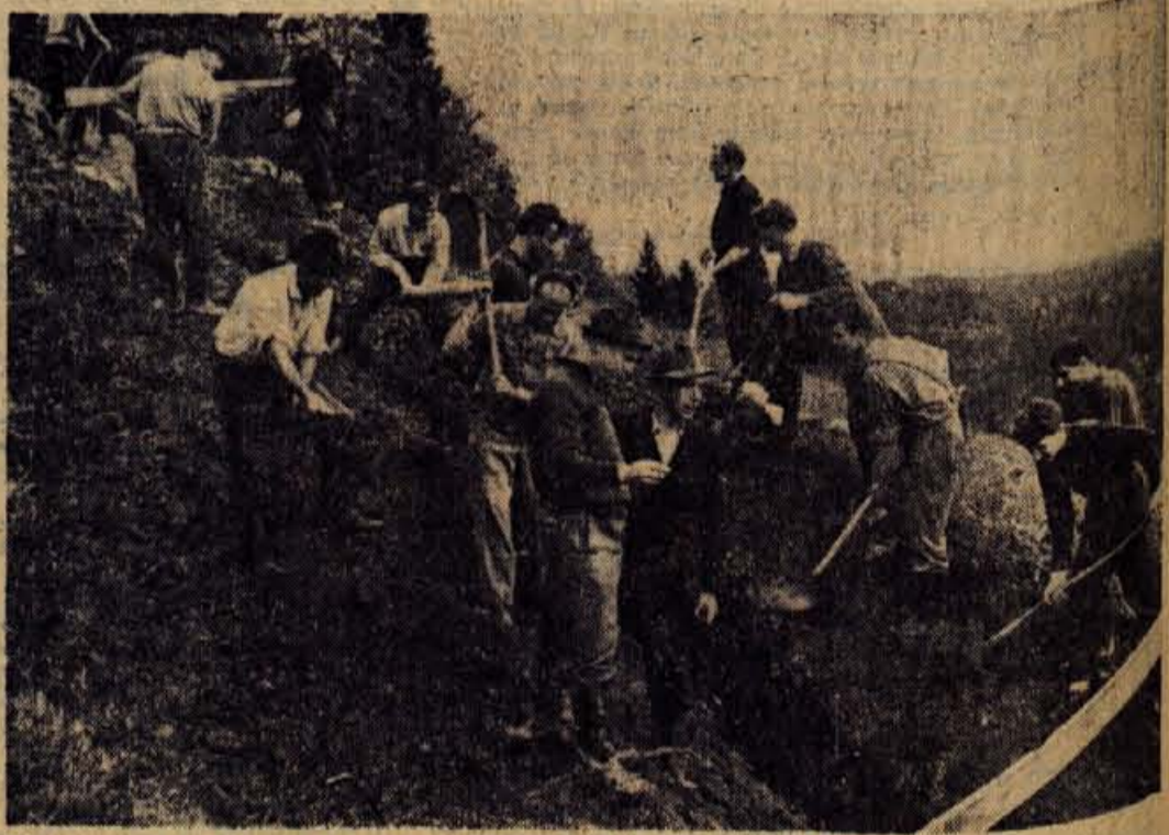
Na pobočju Jošta gradijo Besničani s prostovoljnim delom glavni vod