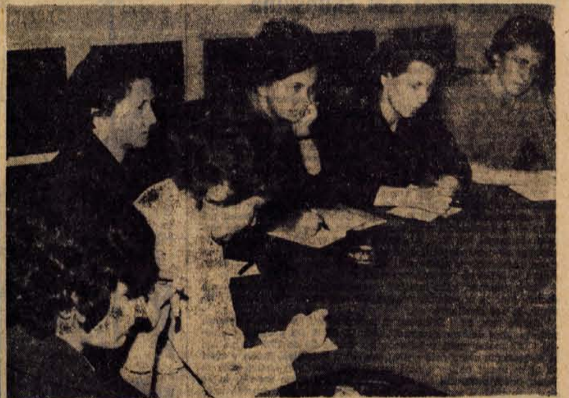
Del kandidatov za občinski zbor, kjer bodo, kot se obeta, tudi žene zastopane v večjem številu

Razgovor je bil izredno živahen in ploden. Največ se je razpravalo okrog organizacije in dela