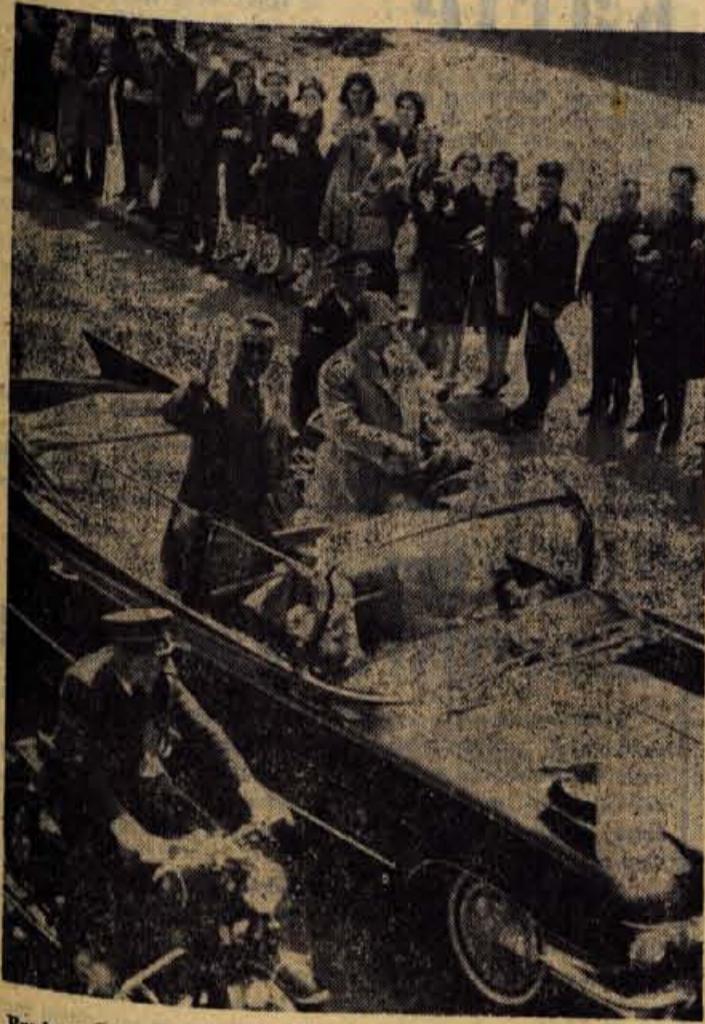
Predsednik Združene arabske republike GAMAL ABDEL NASER, ki je v nedeljo prišel na uradni obisk v SFR Jugoslavijo, je večer popoldne v spremstvu predsednika TITA prispel na Brdo. Vzdolž vse poti od Pulja, skozi Ljubljano in Kranj je visoka državnik pozdravilo na desetisoče ljudi. Predsednika sta jim odzdravljala iz odprtega avtomobila.

GLASILO SOCIALISTIČNE ZVEZE DELOVNEGA LJUDSTVA ZA GORENJSKO