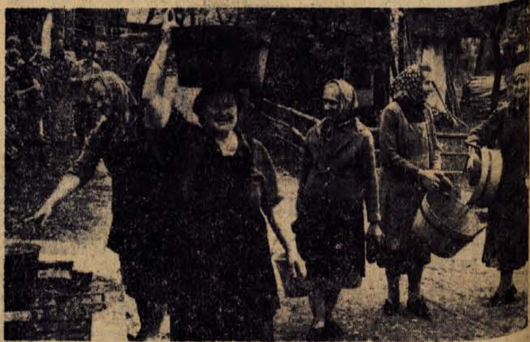
Gneča pred edinim vodnjakom na Lancovem. Upajmo, da bo v kratkem konec borbe za vodo