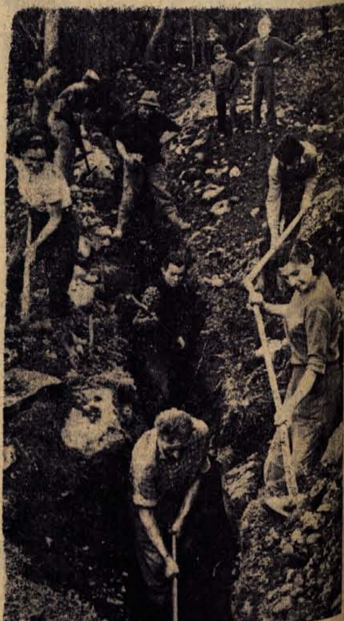
Izkop na Lancovem je naporen - samo kamenje in skale

Med našim pogovorom se je zbrala ob edinem vodnjaku na Lancovem kar lepa skupina gospodinj s škafi in svitki. «Čakale so v vrsti na vodo. Med