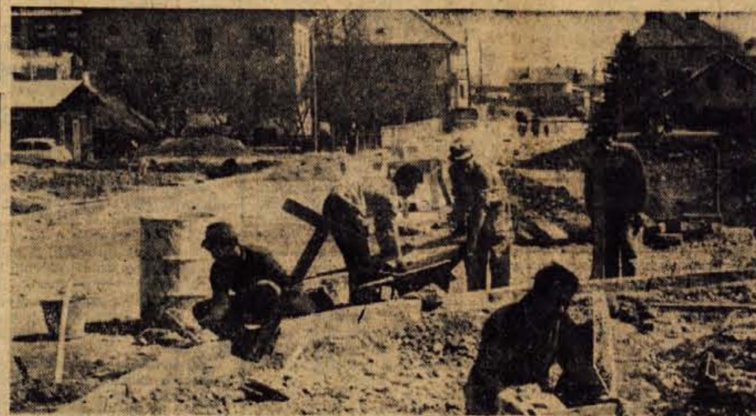
Predel Kranja v okolici vodovodnega stolpa bo v kratkem dobil novo podobo. Te dni že urejajo Kl-dričevo ulico

Za konec še nekaj karakterističnih podatkov, ki naj osvetlijo letošnje gibanje osebne potrošnje v primerjavi z družbenim proizvodom. Delež osebne potrošnje v družbenem proizvodu se letos v okraju povečuje od lanskih 49,5 odstotka na letošnjih 49,8 odstotka. Hkrati usretni podatki tudi kažejo, da bo letos porast sredstev na osebno potrošnjo močnejši od porasta družbenega proizvoda, čigar posledica je tudi ta, da se predvideva letos večji namenjen za osebno potrošnjo, delež družbenega proizvoda, ki je kakor pa je bil lani. — P.