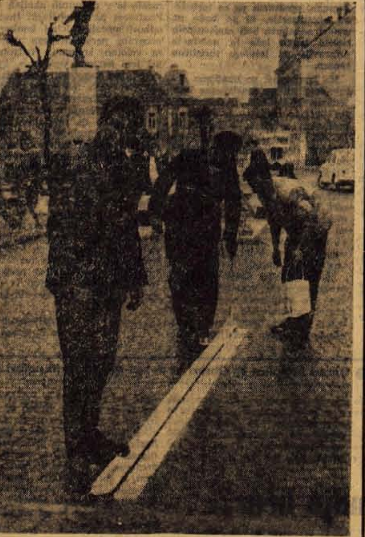
V Kranju so zaključili z označevanjem prehodov za pešce. Prehodi so sedaj dobro vidni in jih lahko opazijo tako vozniki kot tudi pešci.

V odgovoru GG na članek »Deset let Gozdnega gospodarstva Kranj«, ki je bil objavljen v sobotni številki našega lista, se je v prvem odstavku znašla napaka, ki jo danes popravljamo.