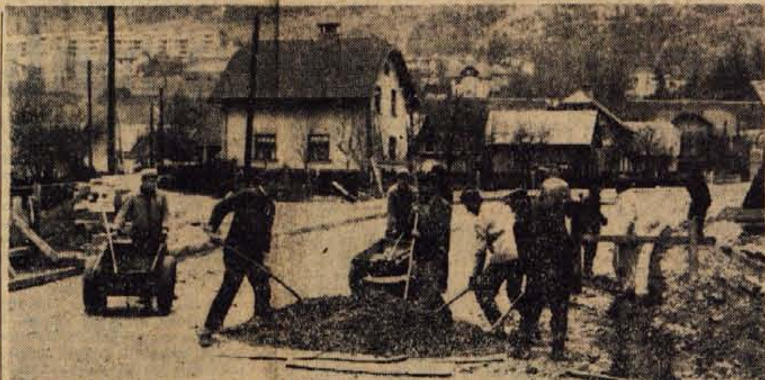
Do 1. maja, kot pravijo delavci, bodo končali cesto, ki bo prek novega mostu vezala Javornik in Blejsko Dobravo pri Jesenicah

Na popoldanski seji sta oba zbora s posameznim glasovanjem sprejela novo ustavo. S tem je naša država dobila novo ustavno ureditev, hkrati pa so bile razpisane nove volitve. Zvezna ljudska skupščina četrtega sklica je končala svoje delo.