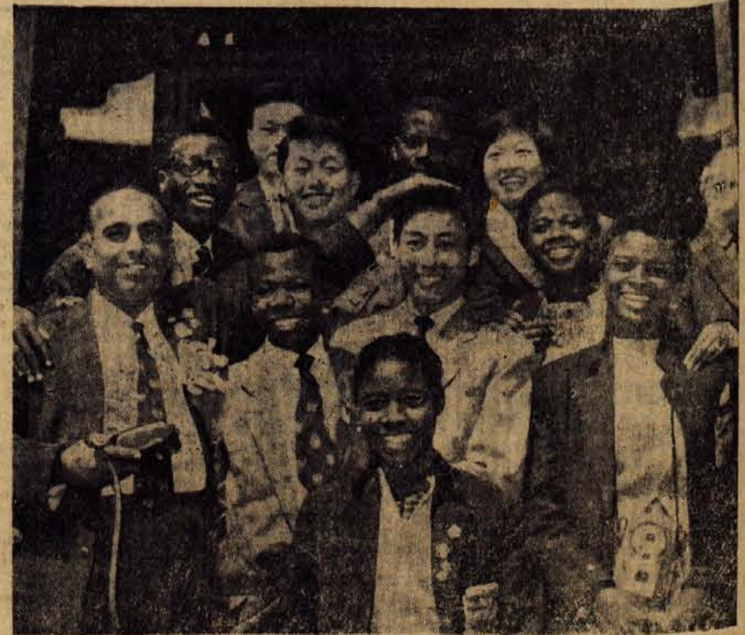
Svetovni namiznoteniški prvak CHUANG TSE-TUNG (v sredini) ima povzod dosti prijateljev