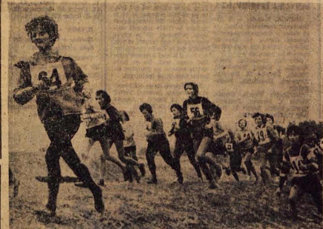
V konkurenci pionirk je na kranjskem krosu nastopilo kar 64 mladih tekmovalcev