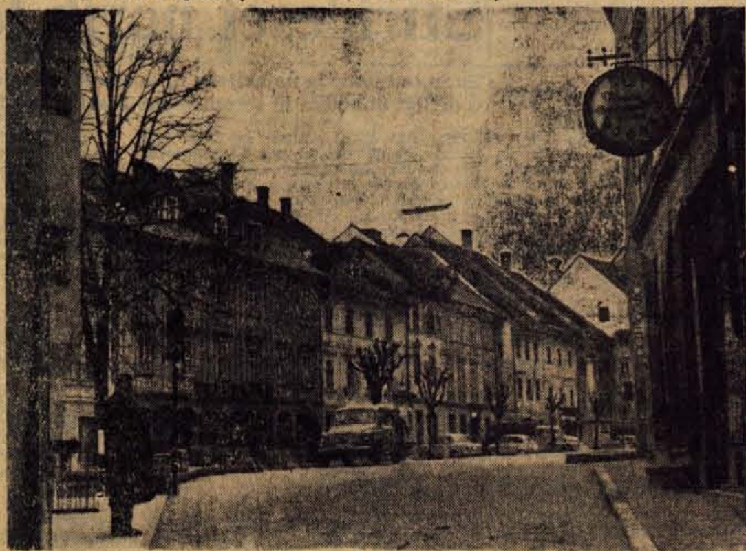
Po odloku ObO Skofja Loka o namembnosti lokalov je predvideno, da bodo na škofjeloškem Mestnem trgu poslej samo prodajalne raznih trgovskih podjetij. Na Mestnem trgu je namreč še vrsta lokalov, ki ne služijo temu namenu (npr. v nekdanji kavarni je skladišče(!)...) Seveda uresničitev tega ne bo možna tako, ker prizadete gospodarske organizacije ne bodo mogle takoj dobiti nadomestnih prostorov, vendar bi bilo prav, da bi jih čimprej. — St. S.

Številno predstavnikov bo ostalo neizpremenjeno: 28 jih bo v občinskem zboru, prav toliko pa tudi v zboru delovnih organizacij. V povprečju bo imelo 230 volivcev enega predstavnika v občinski skupščini. Izdelan je že tudi predlog, kako naj bi bil sestavljen zbor delovnih organizacij. Enainvajset članov tega zbora bo iz skupine proizvodnih organizacij, po dva iz skupine prosveta in kulture ter organov družbenih organizacij in društev, po eden pa iz kmetijstva ter zdravstvenega in socialnega varstva. B. F.