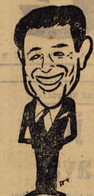
Brazilski predsednik Goulart

v Braziliji že stóriše, preprečiti, levica pa pospešiti. Vendar je v Argentini novo prilagoditev časa težje zapaziti kot v Braziliji. Razlogi za znošnost so različni. Vojska je s svojimi političnim vplivom močnejša kot v katerikoli drugi latinskoameriški državi. Včas po strmojavljenju Frondizija ima vlada z vojsko težave. Odkar je predsednik Guido po