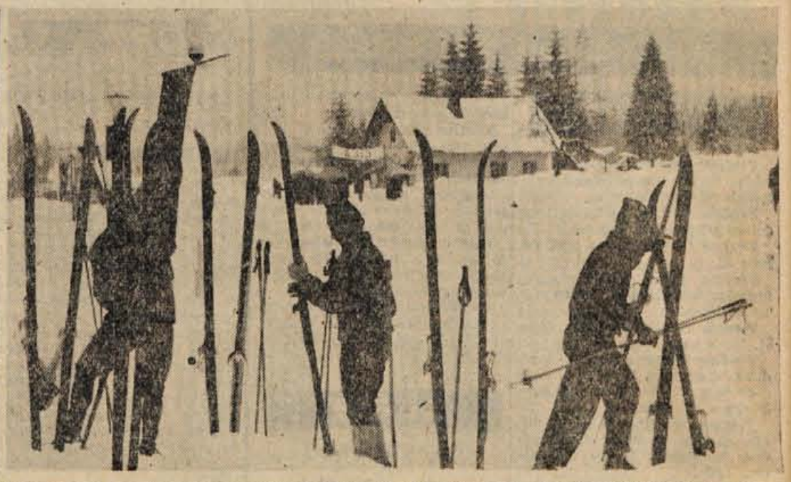
Vsakoletne mednarodne tekme smučarskih tekačev so v Bohinju brez gledavcev skorajda brez pomena