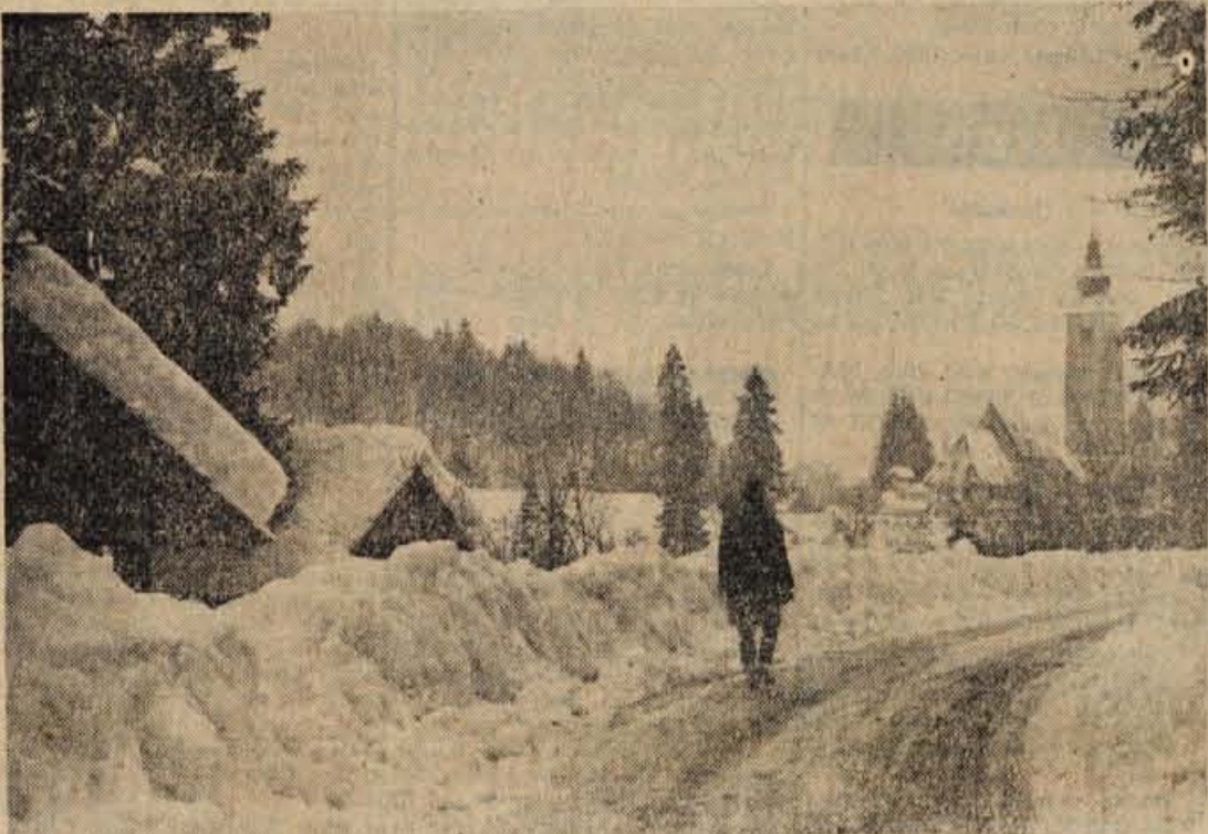
Za sedaj še esamljen spremljavec na poti ob Bohinjskem jezeru. Upajmo, da bo tu čez nekaj let pozimi mnogo bolj živahno, saj v vsi čutilno potrebo, da bi se Bohinj razvil v zimsko-sportno in turistično središče. »Očesa« fotografskih aparatov bodo zato verjetno morala idilne motive poiskati kje v okolici; menimo, da jih zlepa ne bo zmanjkalo

letos v Bohinju tudi niso imeli tistega, kot so pričakovali. Razen stalnih noveletnih gostov sta sicer tokrat »ob jezeru« pričakali novo leto tudi skupini Italijanov in Avstrijcev, v mladinskem domu pa 24 belgijskih mladincev, vendar pa se bohinjski turistični delavci ne morejo znebiti občutka, da so gostom nudili premalo, čeprav so bili ti na eplošno zadovoljni z vsem. Za Silvestrovo so jim pripravili šaljivo tekmovanje, ki pa je moralo zaradi dežja od-