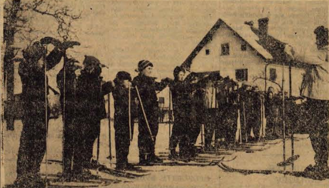
Solska ura telesne vzgoje. Takole so otroci v Radovljici dobili prvo znanje o smučanju

● O KRAJEVNIH SKUPNOSTIH — Na minulih zborih volivcev in letnih konferencah KO SZDL v Selški dolini so razpravljali tudi o krajevnih skupnostih. Zamišljeno je bilo, da bi bile v tej dolini le 2 KS, in to v Selecih in Zeleznikih. Občani zgornje Selške doline (Soricca, Davča, Zali log) so predlagali, da bi imeli svojo KS. V razpravah pa se je omenjalo, da bi bila ona sama KS za vsa dolino, kar pa bi bilo vsekakor preobsežno področje.