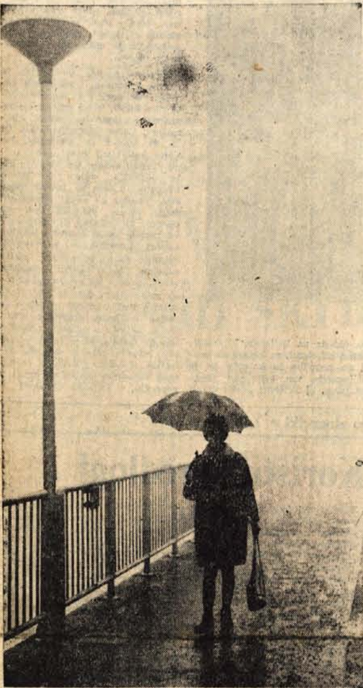
Medtem ko je ponekod na Gorenjskem sedaj prava zima, je drugod že »pobral« že ves sneg in je na primer v Kranju, Trzinu in Škofji Loki ter okolici »razpotoženje prav jesensko«

Kot zanimivost pa naj še povemo, da sta prijavi poslali tudi reprezentanci Hrvaške ter Bosne in Hercegovine in ekipa sarajevske vojne oblasti. — Z.