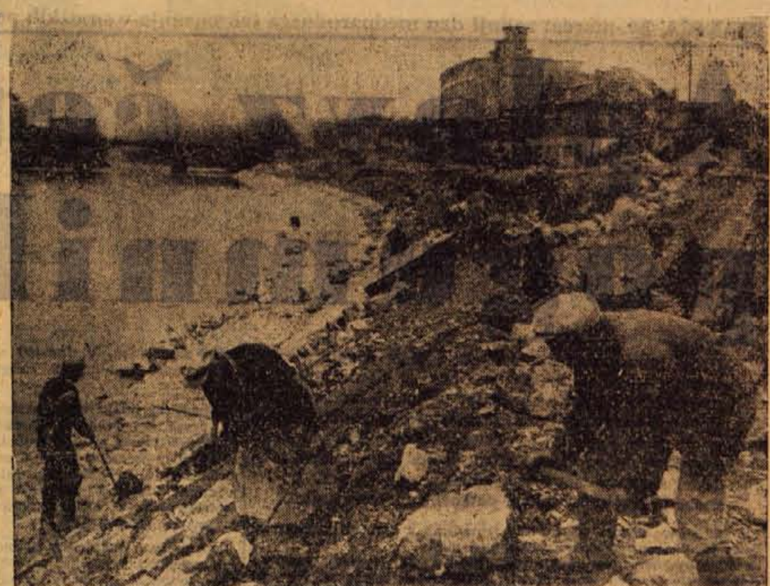
Ob desnem bregu Save, med Tekstilindusom - obrat I. in savskim mostom, delavci nadaljujejo s gradnjo podpornega zidu

Kranj - Člani kranjskega AMD so se vso zimo pripravljali na letošnje tekmovalno sezono. Njihovi treninji so bili omejeni predvsem na kondicijske priprave v telovadnicah. Ze prihodnji teden pa bodo te »suhe« treninge zamenjali s praktičnimi vožnjami na preurejenem dirkališču v Stražišču. Tehnično so se na novo sezono celo dobro pripravili, saj razpolagajo s petimi dirkalnimi stroji, dobro organizirano tehnično službo ter s sodobno tekmovalno stezo, na kateri so že lani izvedli razne izboljšave. - T. P.