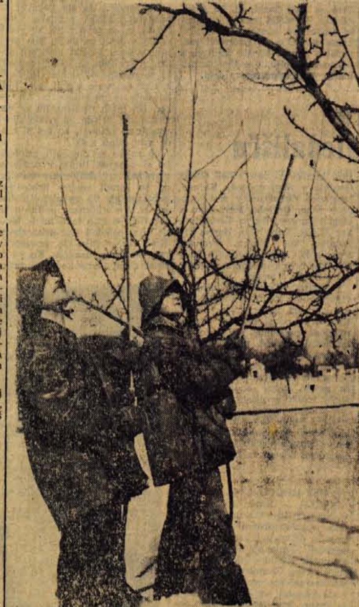
Ceprav sneg se ni povsem vzel slovo, so ponekod že pričeli z deli na polju (gnojenje) in z obrigavanjem sadnih dreves proti raznim škodljivcem. Glede zadnjega je prav gotovo med prvimi kmetijska zadruga »Sloga« iz Kranja, ki je z brizganjem proti sadnim škodljivcem prišla že ta teden v okolici Zabnice