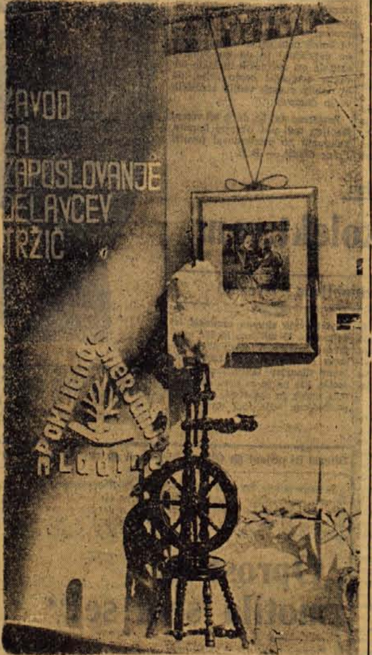
Marec je mesec poklicnega usmerjanja. V ta namen je tudi zavod za zaposlovanje delavcev v Trzicu poskrbel za smiselno urejeno izložbeno okno