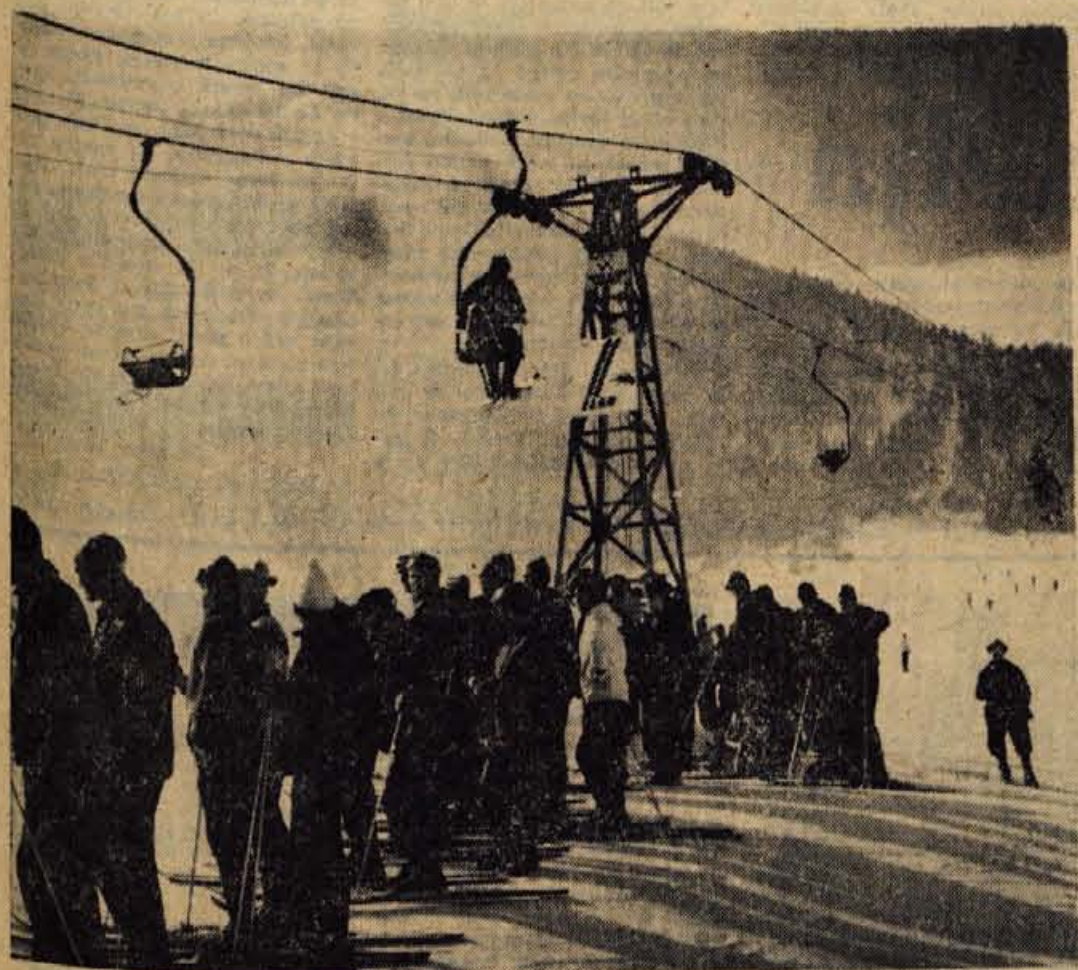
Zičnica v Kranjski gori si lasti velik del zaslug za to, da so smučiča pod Vitrancem tako priljubljena