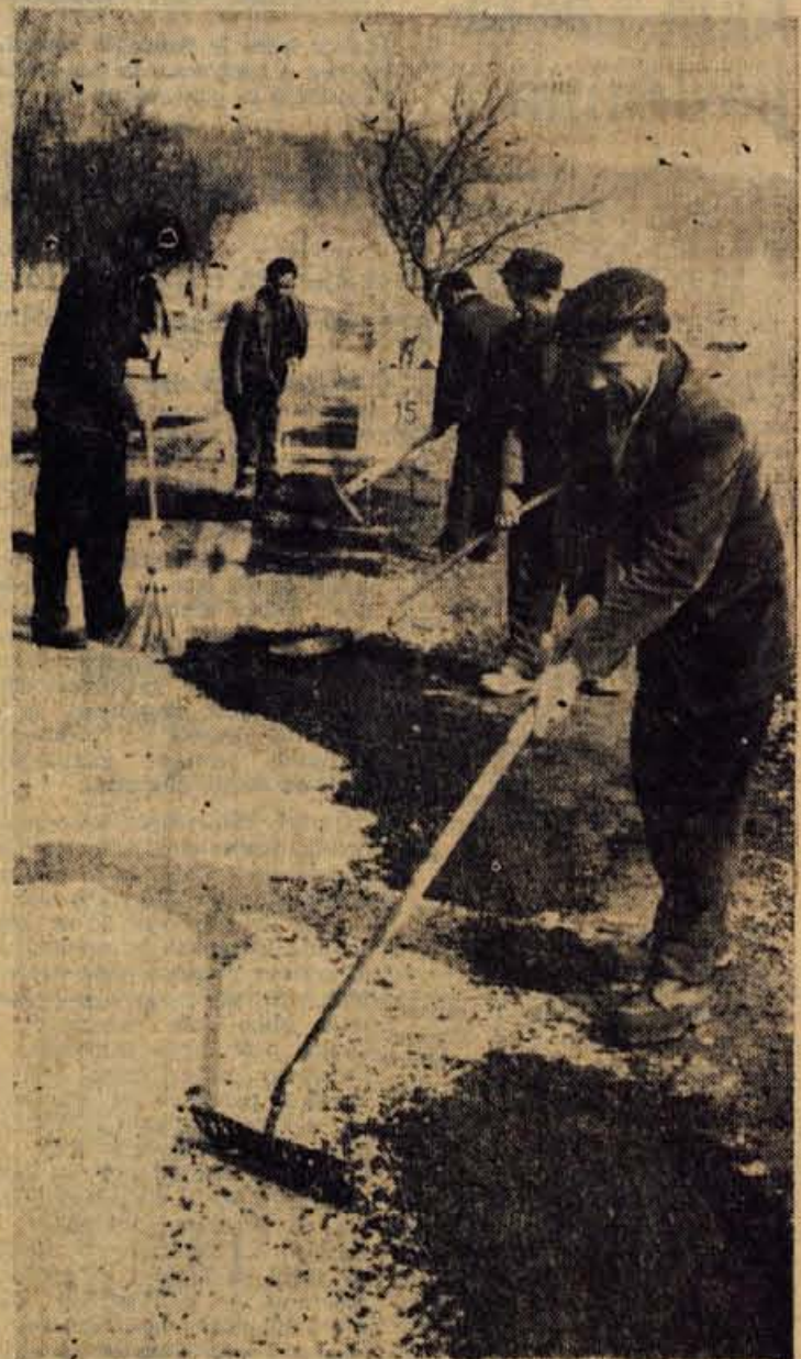
Pred kratkim so delavci cestnega podjetja Kranj začeli s prepotreb- nim popraviljem tržiške ceste