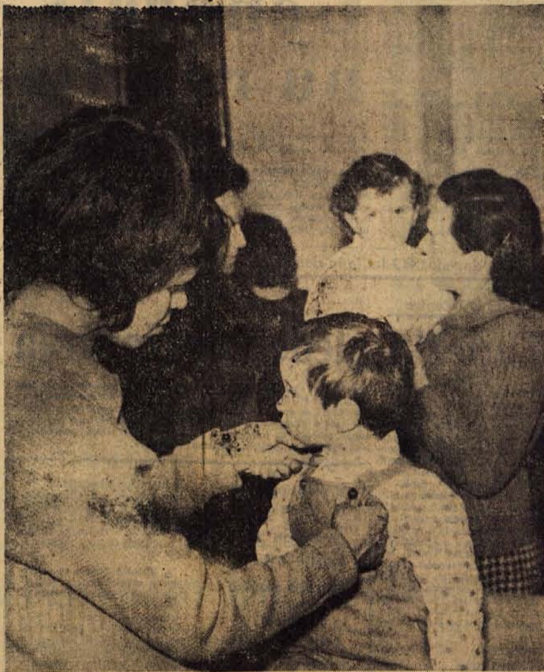
V zbir najrazličnejših vrst pomoči družini prav gotovo sodi tudi zdravstvena zaščita otrok. Mreža otroških ambulant je na Gorenjskem gosta in dokaj dobra, tako da matere rade prinašajo svoje malčke tudi na kontrolne zdravniške preglede, da se prepričajo, če so zdravi. Posnetek je iz čakalnice otroške ambulante v kranjskem zdravstvenem domu