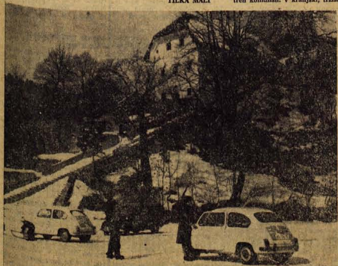
Posebna turistična atrakcija je te dni vožnja z avtomobilom po zaledenem Blejskem jezeru. Preteklo nedeljo se je jezero spremenilo v pravi ples avtomobilov na ledu. Brez pretiravanja lahko zapišemo, da je bilo na površini — brez prometnih znakov okoli 200 avtomobilov