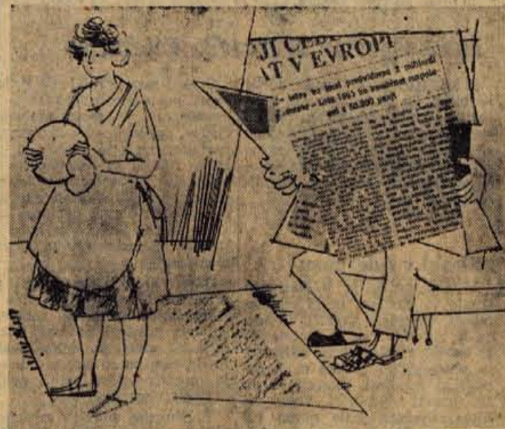
Vsakdanja »delitev dela« v domačem krogu

Razprava je postajala vse živahnjša in bolj zanimiva. Bil so