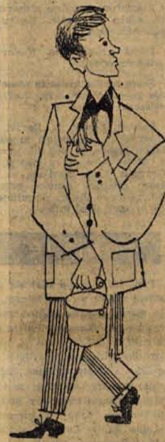
Prí »nečastnem« poslu

In vzroki? Znova od začetka: kvalifikacije, otroško-varstvene