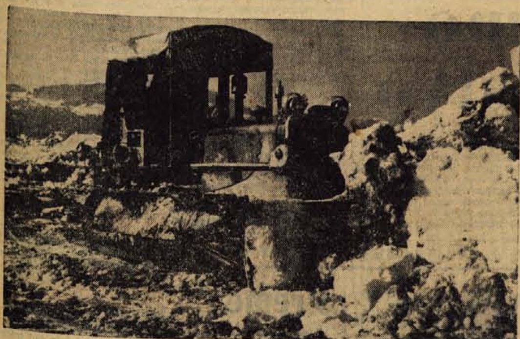
Na Sorškem polju, blizu železniške postaje Zabnica, je stroj vzmiral tiho zimsko okolje, zaoral v sneg in začel gradnjo prve velike farne na tem območju za 400 krav molznic