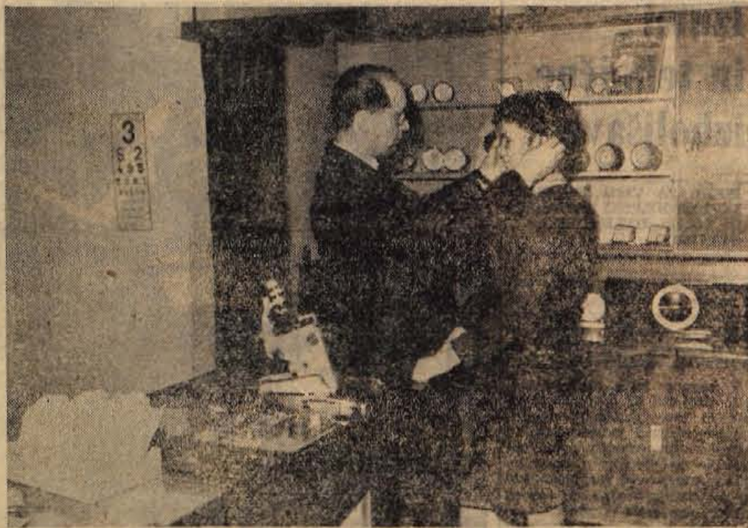
Jeseniška »Optika«, ki je imela še pred kratkim svoj lokal na Prešernovi cesti, je že prejšnji ponedeljek dobila nov sodobno urejen lokal na Cesti maršala Tita. Nova lokacija je predvsem dobrodošla za okolčane, ki imajo v neposredni bližini sedanje »Optike« železniško in avtobusno postajo

Kulturni večer je bil dobro pripravljen, udeležba pa zelo velika, saj so obiskovalci napolnili dvorano. Na Bohinjski Beli se sedaj pripravljajo na praznovanje dneva žens, uprizerili pa bodo tudi dve ali tri igre: Ingolicevo Tajno društvo PGC, odsko dramo Mirka Zupančiča Hiša na robu mesta in za zaključek morda še komedijo iz sodobnega življenja. — J. B.