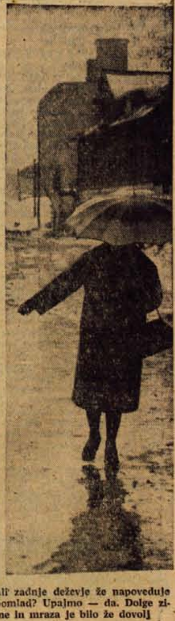
Ali zadnje deževje že napoveduje pomlad? Upalno — da. Dolge zime in mraza je bilo že dovolj