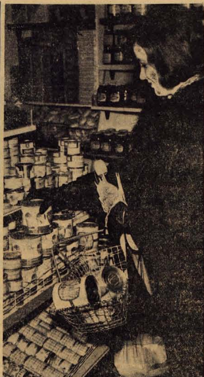
Čimvečja je izbira tem težje se je odločiti (posnetek iz samopostrežne trgovine Potrošnik v Kranju)

SENČUR - V ponedeljek, 18. februarja, je imela osnovna organizacija RK Senčur svoj redni letni občni zbor. Ker je Senčurjanom sneg porušil prosvetno dvorano oz. prostor, v katerem so se lahko sestajali, je bil občni zbor v klubskega prostora v zadržnem domu. Občni zbor je dal precej koristnih napotkov za nadaljnje delo. Senčurška organizacija RK je bila že do sedaj ena najbolj delavnih v kranjski občini, zlasti na področju krvodajavstva. - R.