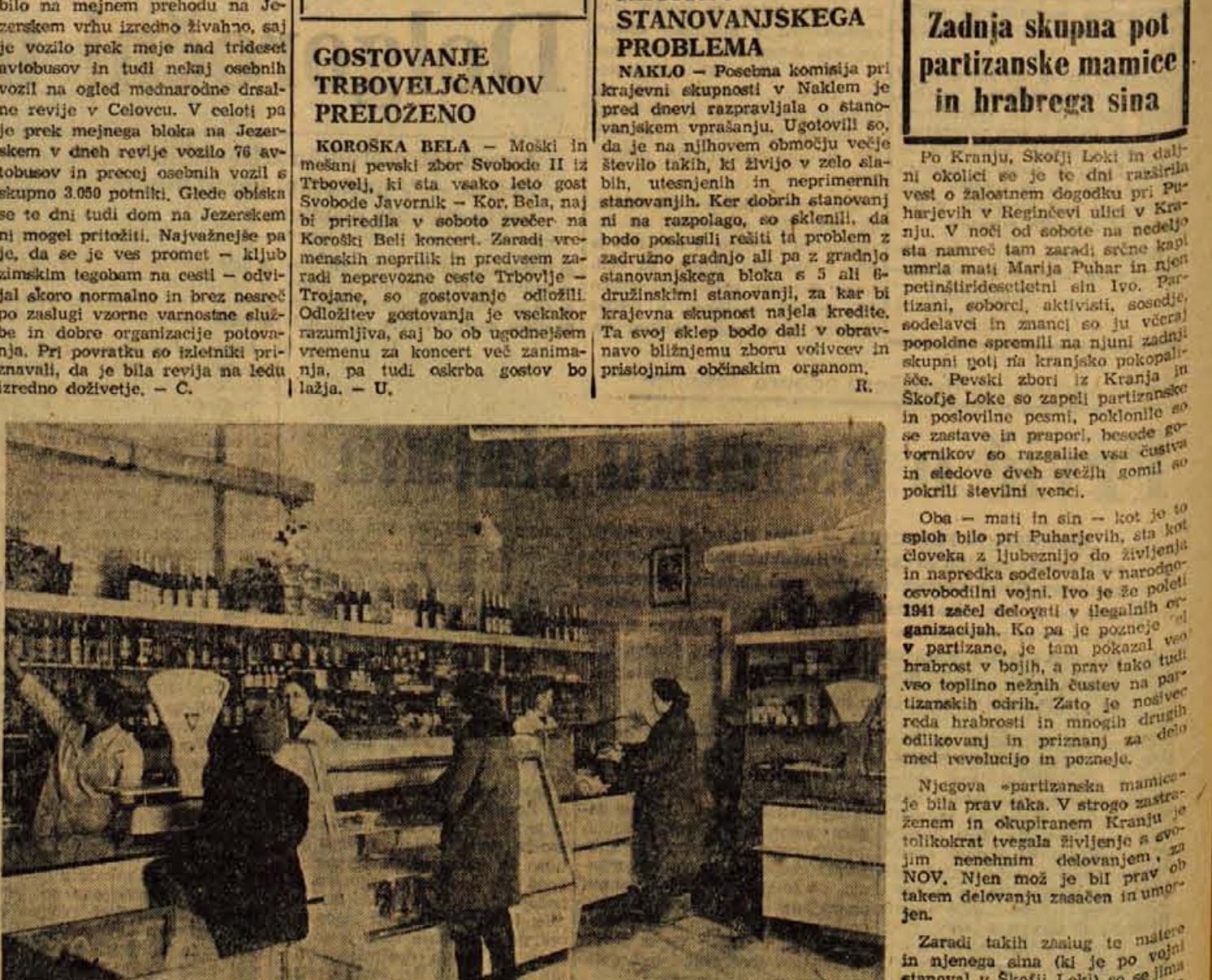
Stražiče je pridobilo nov sodoben lokal, podjetje »Zivila« Kranj je namreč preuredilo prodajalno »Blatna«

Zadnja skupna pot partizanske mamice in hrabrega sina Njegova »partizanska mamica« je bila prav tako. V strogo zadržanem in okupiranem Kranju je tolikokrat tvegala življenje s svojim nenehnim delovanjem, da NOV. Njen mož je bil prav ob takem delovanju zasačen in umorjen.