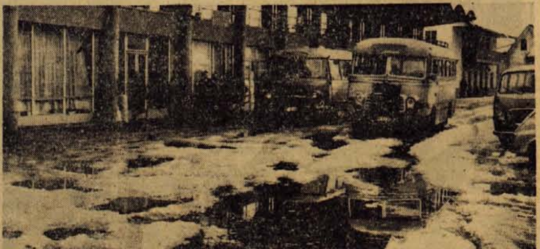
Potnik v avtobusu, ki pripelje ali odpelje z avtobusne postaje v Skoflji Loki, (pa tudi še marsikje drugod) ima občutek, kot da bi se vozil z barko po razburkanem morju: koleso se pogrezoje v kotanjah, potniki ali - cestna oziroma komunalna uprava, ki čaka, da bo odjuga opravila svoje? Na sliki: skofjeloška avtobusna postaja

Pri pravnem urejevanju bi bilo umestno, da bi zavod dobil določena pooblastila, s katerimi bi npr. overjal podpise, zastopanja itd.; nujno bi bilo treba tudi prepisati enotno poslovanje. Tudi glede prostorov je zavod še v začetni fazi, saj se delo tako množilo, da bo treba misliti na povečanje kadra in hkrati tudi prostorov. Porast dela pa je nedvomno častna zaupnica zavodu in njegovim službam.