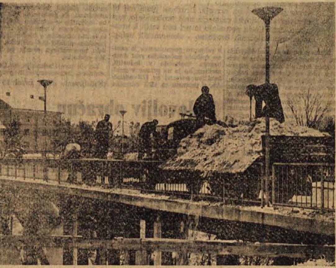
V nedeljo zjutraj nas je spet presenetila manjša snežna pošiljka. K sreči pa je bilo južno vreme in se ni bilo potrebno takoj lotiti očiščevanja, kot v prejšnjih primerih

Ljudje in dogodki • Ljudje in dogodki • Ljudje in dogodki • Ljudje in dogodki • Ljudje in dogodki • Ljudje in dogodki • Ljudje in dogodki