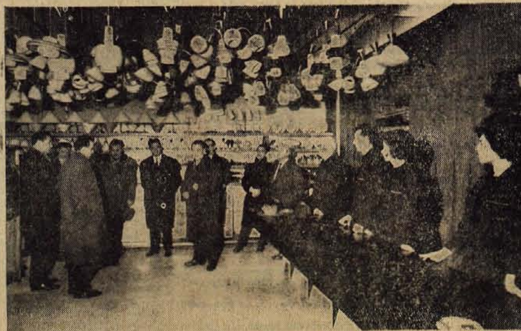
Zadnji petek v preteklem letu so Kranjčan dobili še eno preurejeno prodajalno. V središču mesta je odprla Elektrotehna iz Ljubljane svojo poslovalnico z veliko izbiro elektrotehničnih izdelkov za široko potrošnjo. - Na sliki: med otvoritvijo nove prodajalne

● KOVČKI S KNJIGAMI V OBEH DOLINAH - Ljudska knjižnica v Skofji Loki je naposled vsaj delno ustregla vpraševanju prebivalcev Selške in Poljanske doline po novih knjigah. V letošnji zimski sezoni bodo kovčki z največjimi knjigami prispeli v: Zeleznike, Selca, Dražgoše in Bukovšico v Selški ter v Javorje, Sovodnj in Gorenjo vas v Poljanski dolini. Nove kovčke pa težko pričakujejo tudi v Trebju, Poljanah, Bukovici in Retečah. Predvideno je, da bodo prišli kovčki v te kraje že v januarju oz. februarju, tako da bo željam bravnem leposlovnih knjig v glavnem zadosečeno.