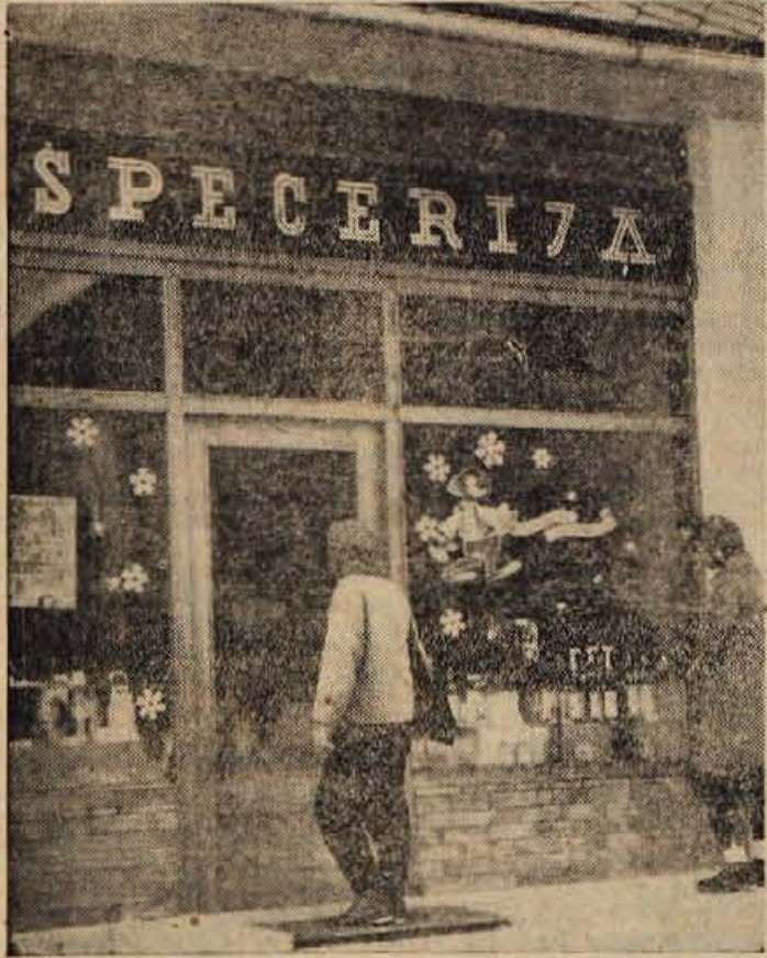
V Gorjah pri Bledu, so pred kratkim dobili skrbno urejeno novo prodajalno, poslovalnico trgovskega podjetja Specerija z Bleda