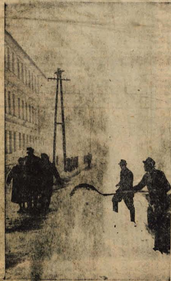
Tudi pešci so koristniki cest ali pločnikov po mestih. V zimskem času imajo največ težav na cestah kot pa motornih vozil, zato bi morali biti vsaj toliko skrbeti kot za najbolj prometne ceste z motornimi vozili. V Radovljici za pešce še kar skrbijo, vendar še mnogo premalo. Zadeva pa je glede tega v vseh ostalih večjih središčih Gorenjske še bolj kritična

GLASILO SOCIALISTIČNE ZVEZE DELOVNEGA LJUDSTVA ZA GORENJSKO