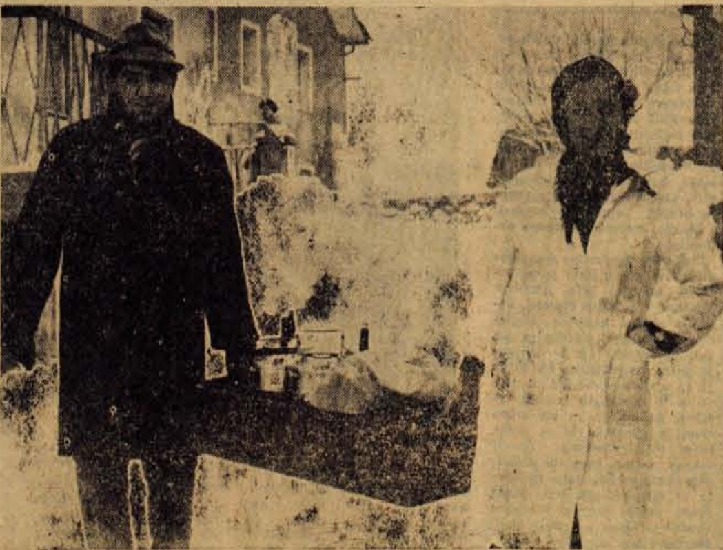
Zaradi malice imajo v podjetju ZLIT v Tržiču vsaj v slabem vremenu precejšnje neprijetnosti. Podjetje ima namreč dva ločena obrata, zato morajo v obrat, kjer proizvajajo pohištvo, vsak dan nositi malice. Razumljivo je, da je zaradi ločenih obratov še večji problem dobra organizacija proizvodnje. Morda pa bo zadeva urejena še letos, če bodo na voljo sredstva, saj je ZLIT že začel z gradnjo novih prostorov

... je BPT pri Jugobanki zaprosila za 68 milijonov dinarjev kredita. Omenjeni znesek potrebuje BPT Tržič za obratna sredstva za zunanjo trgovino.