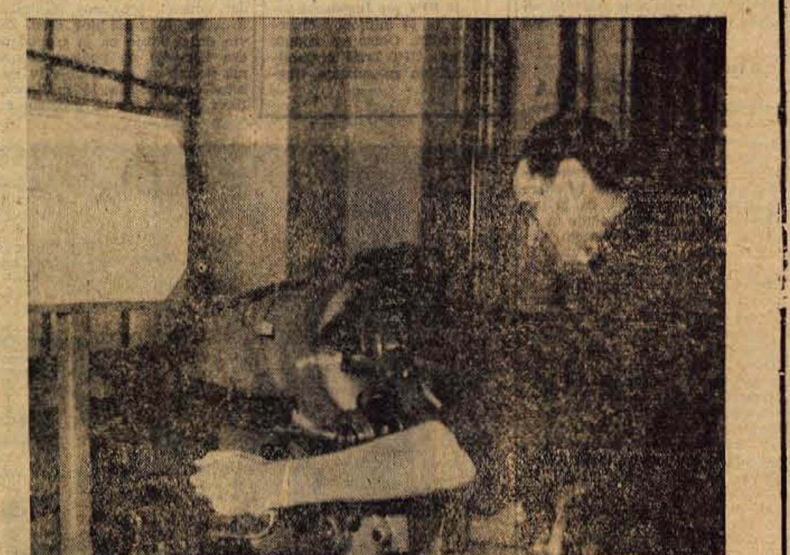
Delavec iz Iskre pri stroju — opremljenem s statističnim listom

Oddelek kontrole zaposluje sedaj 25 ljudi, po uvedbi statistične kontrole naj bi se število zaposlenih povečalo na 56,