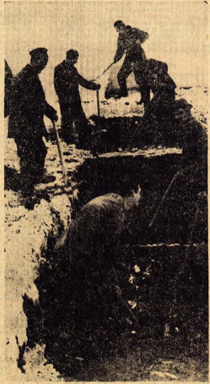
Ceprav je letošnja snežna odeja precej debela, kljub temu nadaljujejo tudi preko zime s preiskovalnimi deli na trasi, kjer naj bi bila nova cesta skozi Gorenjsko

Znano je, da občinski zdravstveni centri niso zaživel tako, kot bi po predvidevanjih morali, saj jim je primanjkovalo ustreznega kadra. Občinski ljudski odbori so ta predlog načelno odobrili. — S.