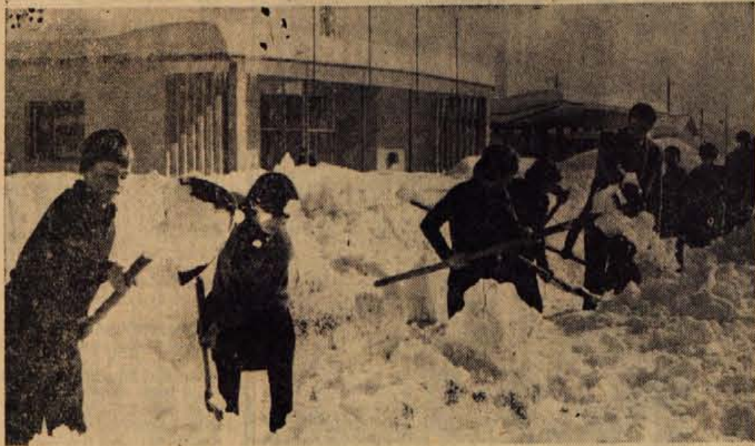
Prilagodljiva iznajdljivost. V mnogih večjih naseljih Gorenjske, predvsem pa v mestih, imamo letošnje zimo precej problemov, kako bi očistili ulice za pešce. Bržkone bi ne škodilo, če bi glede pomoči našli tsemnejše sodelovanje s šolami. V Radovljici prvi uspehi niso izostali. Na pobudo vodstva šole so tamkajšnji otroci sami v okolici svoje šole očistili pločnike (na sliki)