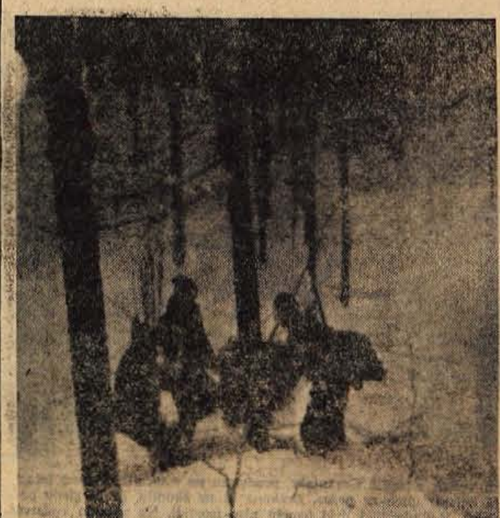
V nedeljo, 10. t. m., so škofjeljski taborniki skupno s člani Lovske družine Skofja Loka odšli v bližnje hribe z namenom, da pomagajo ogroženim smram v tej hudi zimi. S seboj so peljali seno, ki so ga z žlico privezovali na debela drevesa.

Naši predstavniki z golobi so bili v Belgiji zelo pristrcno sprejeti.