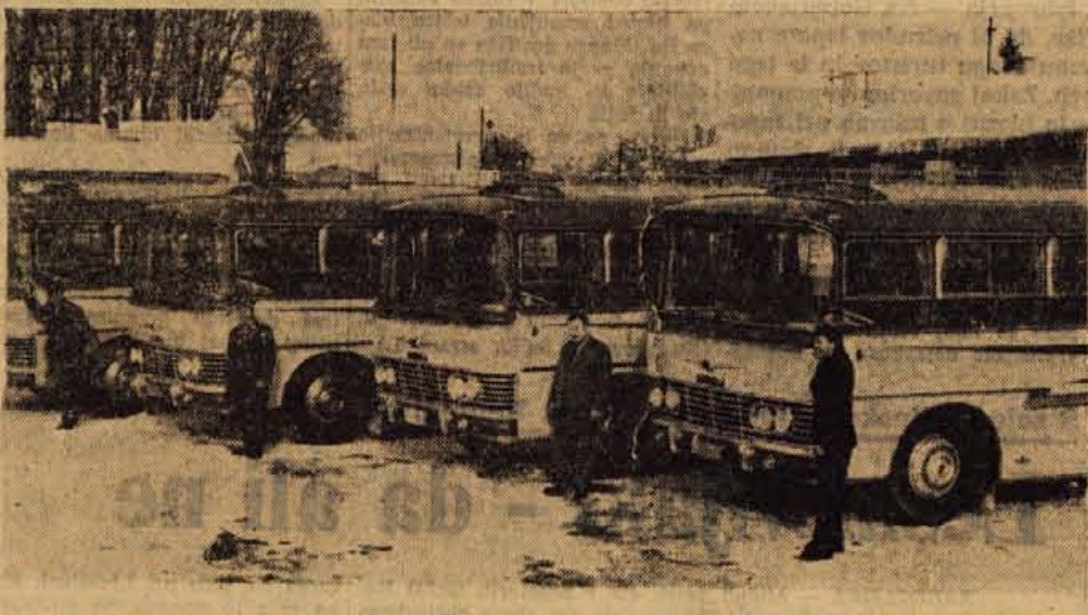
Minuli teden je kranjsko avtoprevozniško podjetje »Avtopromet« dobilo štiri nove avtobuse znamke FAP, ki jih vidimo na sliki

Ljudje in dogodki • Ludje in dogodki • Ludje in dogodki • Ludje in dogodki • Ludje in dogodki • Ludje in dogodki • Ludje in dogodki