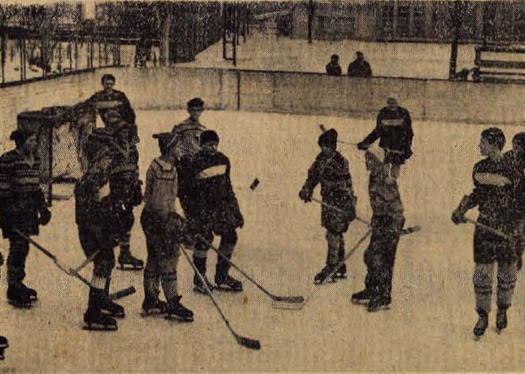
Mladinci hokejskega kluba z Jesenic so večeraj v Ljubljani ponovno osvojili prvo mesto na mladinskem državnem prvenstvu