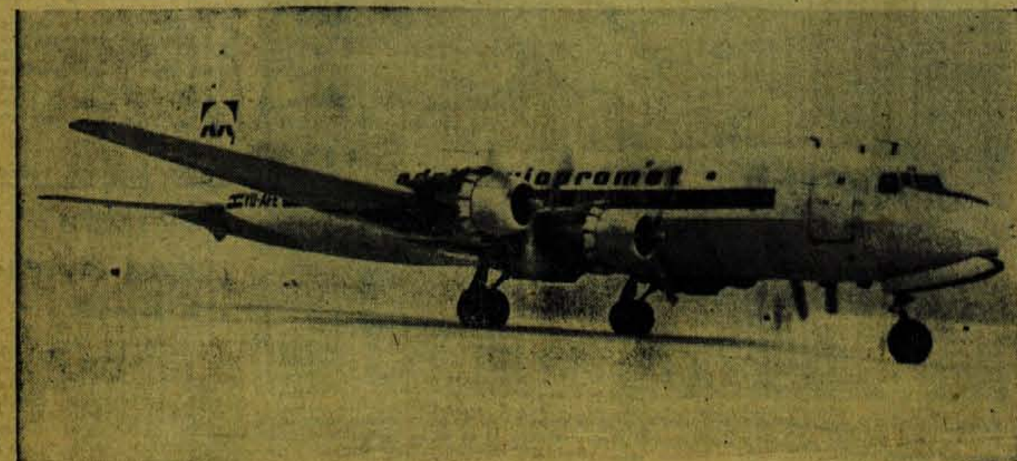
Prvo letalo Adria avio-prometa DC 6, ki je poletelo z novega ljubljanskega letališča Brniki proti Beogradu in dalje v Alžir