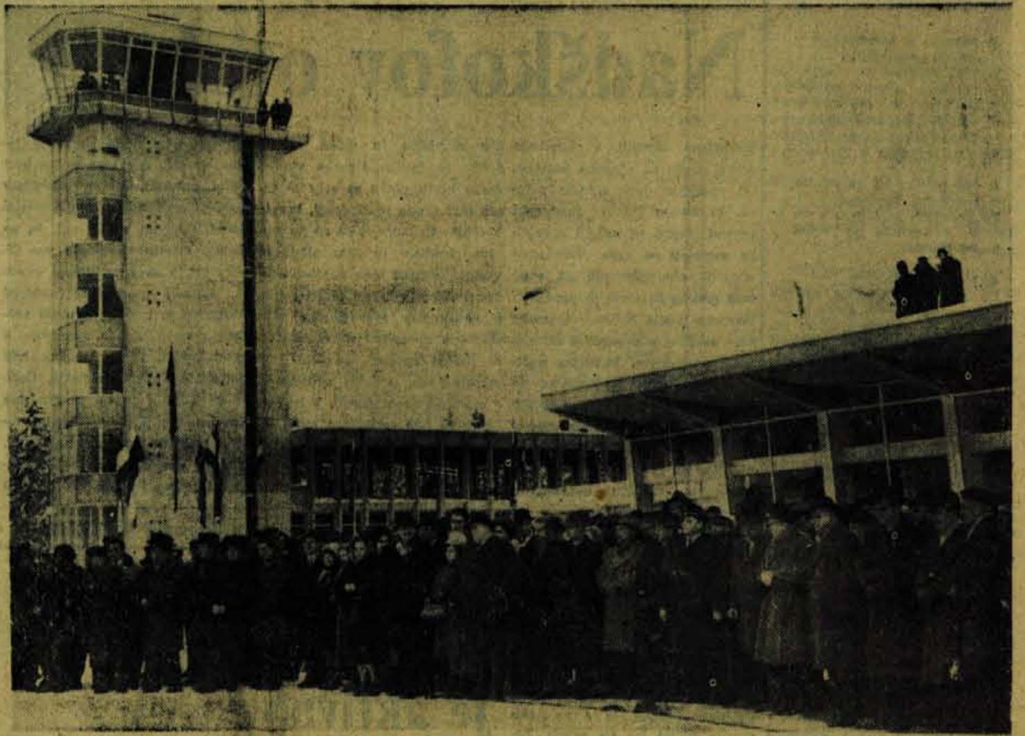
Visoki gostje, predstavniki družbeno-političnih organizacij, občani, in prvi potniki na otvoritvi letališča Ljubljana-Brniki