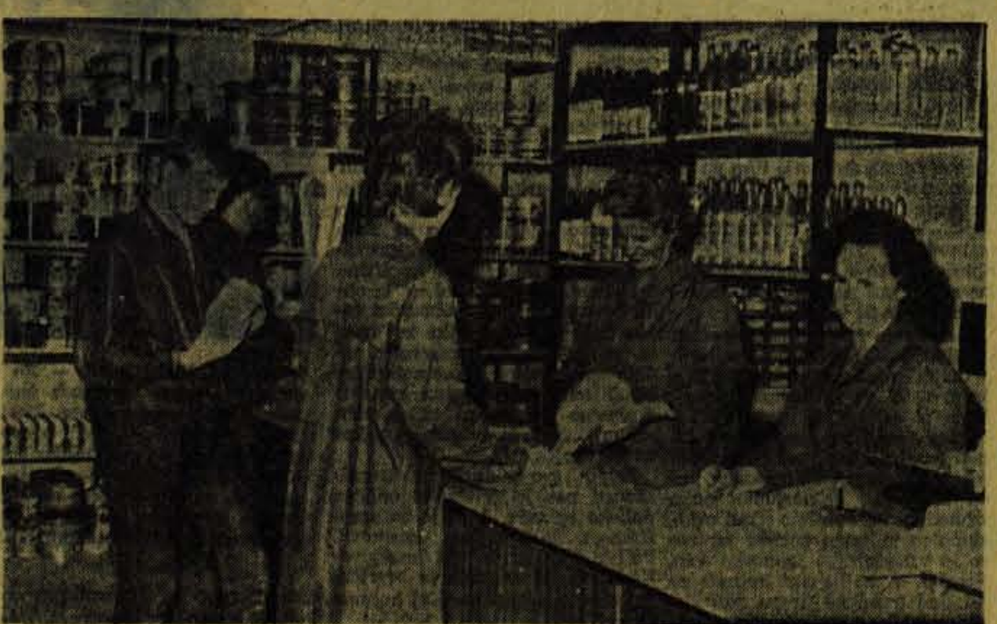
Nekatero trgovine so v dneh pred novim letom še dobro založene

domov, ki rabijo vedno več uslug. Zato bo potrebno zgraditi restavracijo, ki bo turiste, planince in druge oskrbovala s hrano. Na Uskovnici so prelepa smučališča, predvsem za začetnike in zato je vsako leto več tečajev, tekmovalj in drugih zimskošportnih prireditav. Tekmovalja in tečaje prireja tudi Združenje sleskih, razne šole, sindikalne organizacije in drugi. — R. Č.