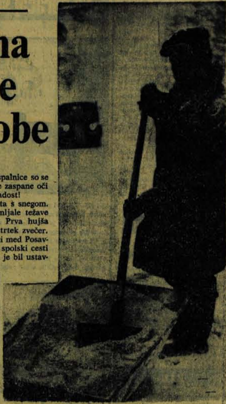
Klanec na gorenjski cesti sproti posipajo s peskom in soljo tako, da sneg motornim vozilom ne dela posebnih težav

Glavne težave so nastale naslednje jutro — v petek. Avtobusi so vozili z zamudami, delavci so prihajali na delo kasneje in potniki so v »plesočih« vozilih preživeli marsikateri neprijeten trenutek. Vendar hujših nesreč ni bilo. Večja nesreča a človeškimi poškodbami se je zaradi poledice pripetila pri tovarni Sava. Delavci so čakali na avtobus. Pripeljal je in ko je začel zavirati, ga je zaneslo vstran in pritisnil je ob zid delavko, ki je še vedno v bolnišnici. Prva dva dni — v petek in soboto je bilo po naših cestah veliko nesreč — 26! Pri tem pa še niso vštete nesreče v škofovškem in bohinjskem območju. Med temi je samo en tovarnjak. Vsa druga vozila so bila lažja, osebna. In ob tem še ena zanimivost — izmed vseh prizadetih voznikov jih je bilo okrog 80 odstotkov takih, ki so tokrat doživljali svoj prvi krst z vozilom na poledici — vozniki, ki so šele letos dobili voziška dovoljenja in ki niso imeli izkušnje na zimskih voznjah.