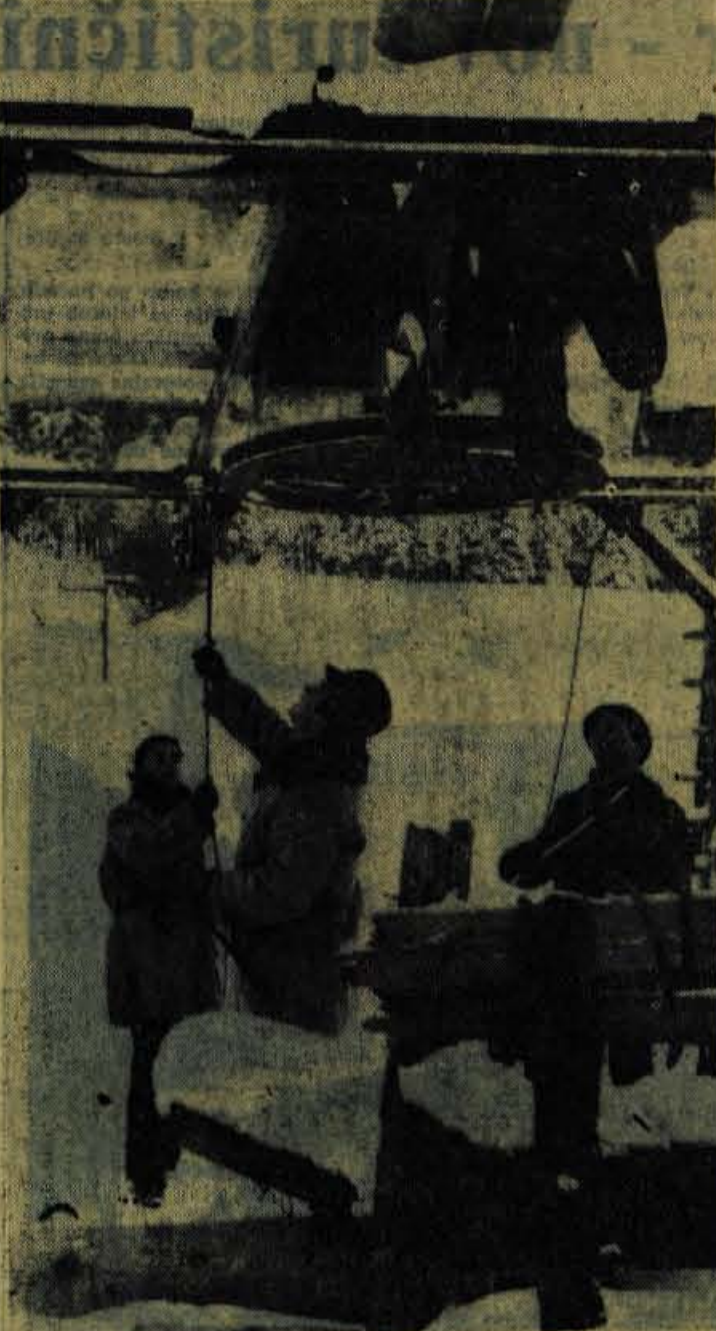
Monteji Elektro Kranj — enote Zirovnica zaključujejo z zadnjimi deli pri otroški vlečnici Mojca v Kranjski gori

Za elektrifikacijo Doline in Jelendola je že izdelan glavni projekt. Na razgovoru s predstavnik