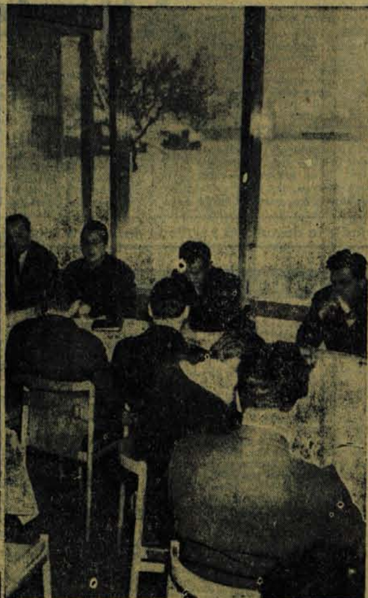
Del udeležencev posvetovanja o pripravah na zimsko sezono v Kranjski gorji

In še obrobni podatek. Odkup deviznih sredstev v okviru maloprodajnega prometa znaša v devetih mesecih 14.650.000 dinarjev. Za večji porast te postavke bi bilo nedvomno koristno, če bi razširili obmejni pas z veljavnostjo prehoda brez potnih dovoljenj za italijanske in avstrijske državljanke do Ljubljane. — P.