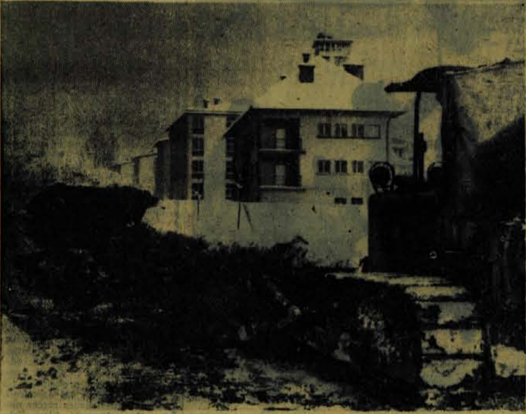
Cesto JLA bodo od križišča s cesto Staneta Zagarja do križišča s Kidričevo cesto razširili za 6 metrov

V Zalogu pri Cerkljah je bila v nedeljo popoldne zabavna prireditev, za katero je bilo med tamkajšnjimi prebivalci veliko zanimanje. Domači izvajalci so pripravili samostojni celovečerni program, k sodelovanju pa so povabili tudi skupino azijskih in afriških študentov. Posebno lepo so domačini pozdravili tuje študente.