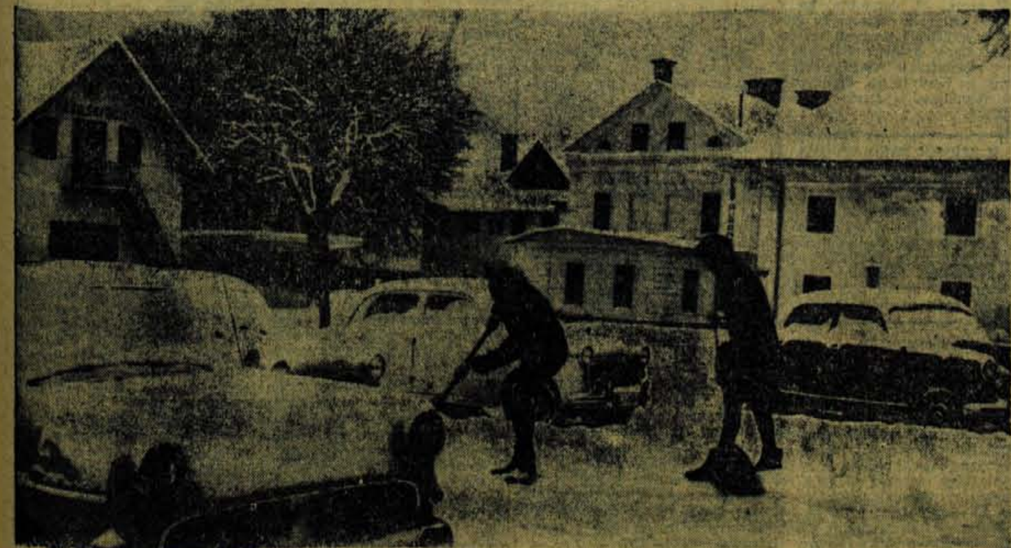
V Kranjski gorji pravijo, da so pripravljeni za sprejem zimskih turistov in da bodo to dokazali takoj, ko bo zapadlo dovolj snega

turistična taksa stekala v sklade krajevnih skupnosti češ da je nemogoče ločiti potrebe kraja in potrebe turizma v kraju. Turistični Nadaljevanje na 2. strani 2