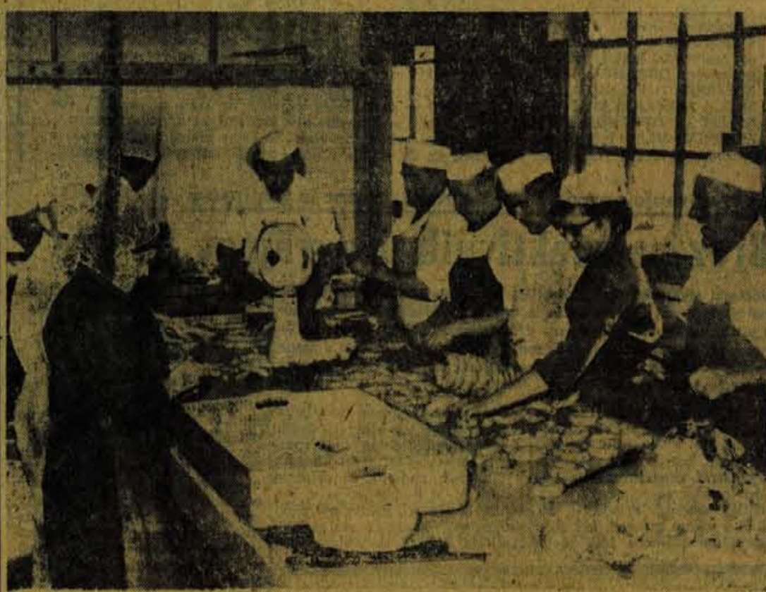
V novi predelovalnici mesa, ki jo je uredilo podjetje »Mesarija« Jesenice

Kranj — Upravni odbor Komunalne banke v Kranju bo tudi letos nagradil šole, ki bodo ob veliki vsakoletni propagandni akciji »denarčnega varčevanja med šolsko mladino« dosegle najboljše uspehe. V drugi polovici tega meseca bodo zbrali podatke za najboljše šole po naslednjih kriterijih: število učencev na šoli, število učencev vlagateljev hranilnih vlog, ki ima splošne ali hranilne knjižice, odstotek števila vlagateljev glede na skupno število učencev na šoli in povprečni znesek na enega učenca — vlagatelja. Razdelitev nagrad najboljšim šolam bo konec tega meseca. — C.