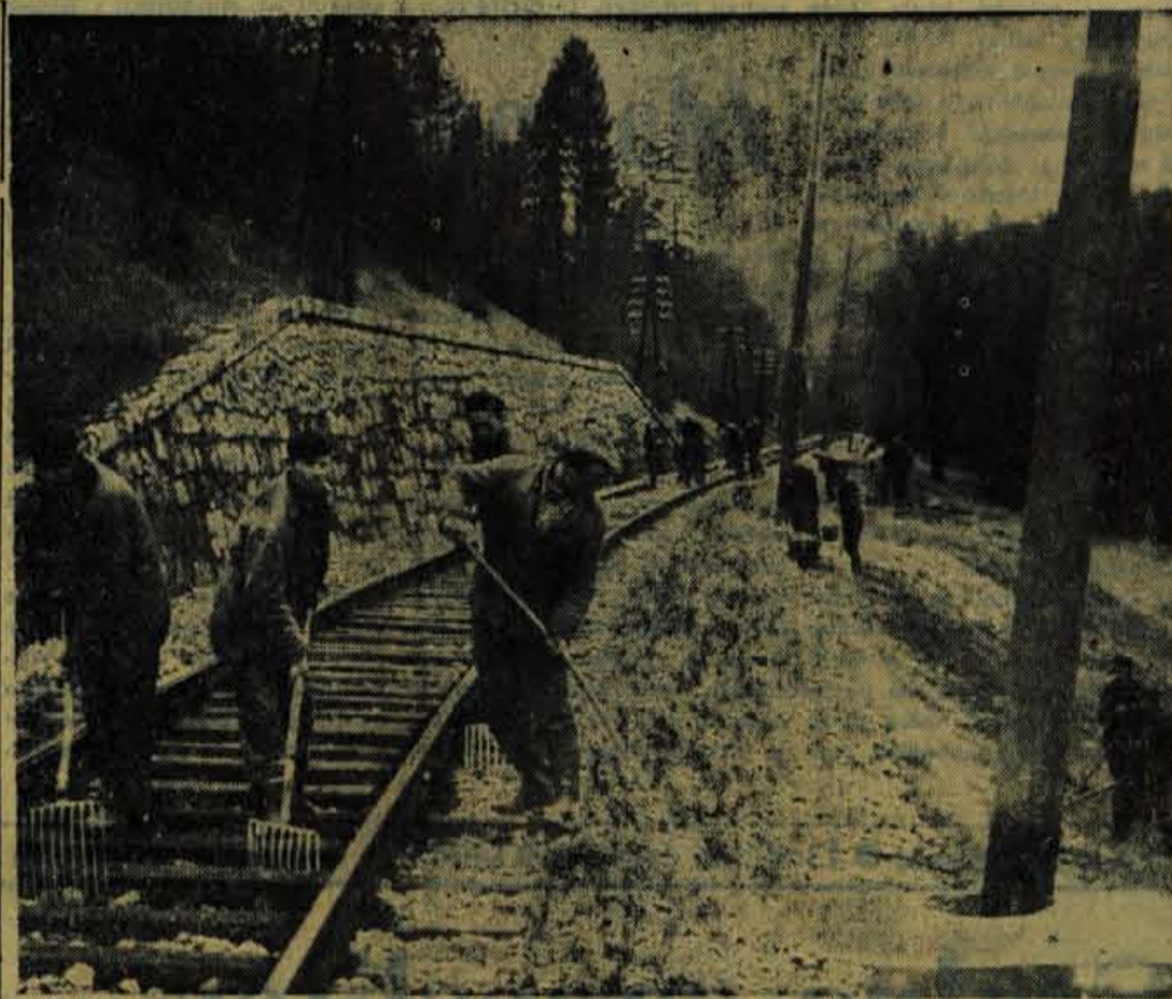
Priloge za elektrifikacijo gorenjske železnice potekajo že dalj časa, spomladi pa bodo začeli s samo elektrifikacijo. Po tej izbolsjavi bodo vlaki od Ljubljane do Kranja lahko vozili s hitrostjo 100 kilometrov na uro, naprej do Jesenice pa s 60 do 70 kilometri na uro. Tako se bo propustnost enotirne proge zelo povečala. Pozneje bodo uredili še križišča proge s cestami. Transformatorske postaje za progo gradijo v Vižmarjih, v Naklem in v Zirovnici. Silka prikazuje del proge od postaje Kranj do postaje Jošt, delajo pa skoraj ob vsaj progi

Taki so skupni zbirni podatki iz predlogov, ki so jih izdelale gospodarske organizacije te občine za njihov proizvodni program v prihodnjem letu. O teh bodo