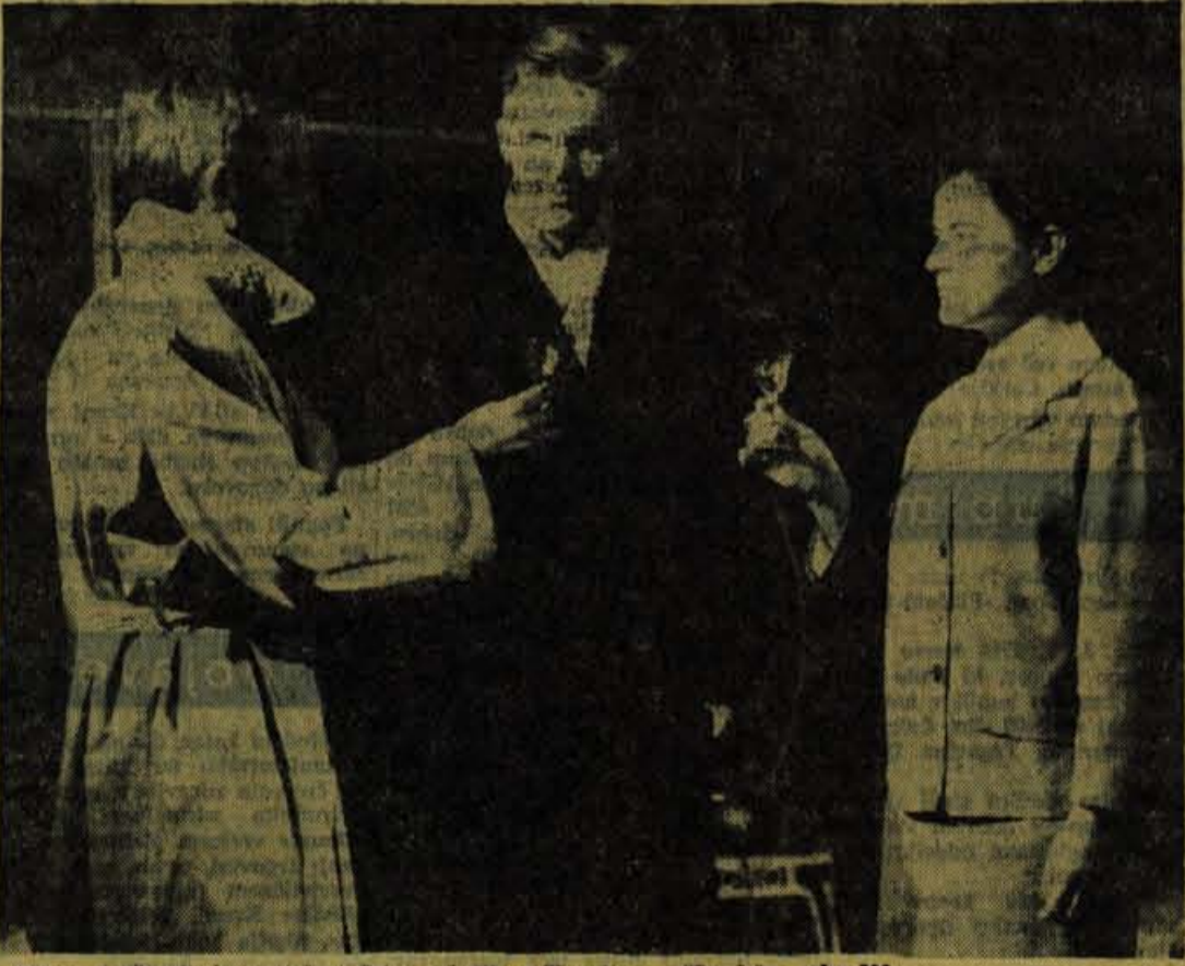
Prizor z večerajšnje premiere Odra mladih v Kranju — »Hotelska soba 308«