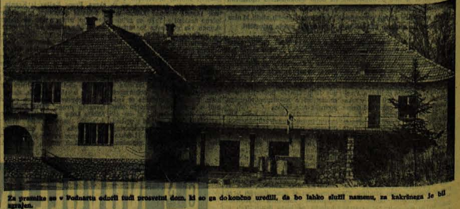
Za prosvetne se v Podnartu odprli tudi prosvetni dom, ki so ga dokončno uredili, da bo lahko služil namenu, za kakršnega je bil zgrajen.

Ljubljana — pretežno oblačno, 2 stopinji; Planica — oblačno, -1 stopinja; Lesce-Bled — pretežno oblačno, -1 stopinja, zračni pritisk 1021 milibarov, pritisk rahlo raste; Jezerško — pretežno oblačno, -2 stopinji; Triglav-Kredarica — jasno, -1 stopinja, pihata zmehren severovzhodnik. Snežne razmere: Planica, Kranjska gora, Vitranc in Jezerško 1 cm snega, Komna 3 cm. Vršč 25 cm in Kredarica 130 cm snega.