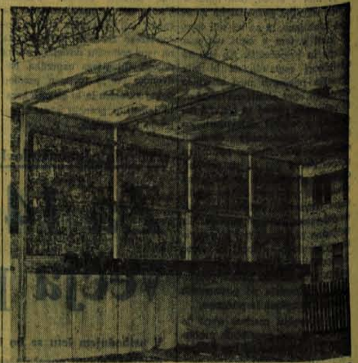
Novi paviljon za prodajo sadja in zelenjave, ki ga je v Kranjski gori uredilo podjetje Sadje - Zelenjava Ljubljana — obrat Agraria Kranj.

Krvavška žičnica pa do danes ni obratovala, ker so razstreljevali kamenje v bližini drugega nosil-