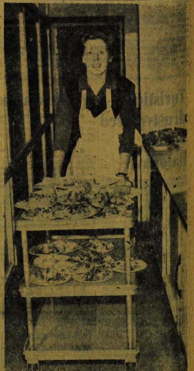
Ob občinskem prazniku bo preteklo že tretje leto poslovanja ljudske kuhinje v Škofji Loki. Predvidevajo, da bo v prihodnje uvrščena v sklop stanovanjske akupnosti. Vsak dan v njej pripravijo 150 zajtrkov, 150 toplih malic in 350 kosil; poleti pripravljajo več obrokov. Hrano vozijo tudi delavcem na gradbišča.

• Če pomislimo, da so pred letom 1932 nastala že vsa važnejša dela svetovne filmske klasike in da je zvočni film že osvojil tržišče, potem so »Triglavске strmine« kljub vsemu le tiho rojstvo neke nacionalne kinematografije. Morda so prav zato še bolj ljubke in na vsak način vredne ogleda. — N. K.