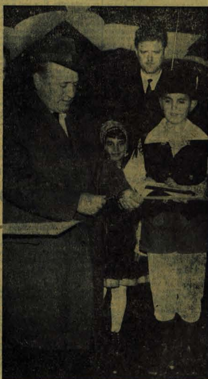
V Hrastju je v četrtek predsednik ISSRS tovariš Viktor Avbelj prezal trak nove moderne farme bekonov. Farma bo, ko bo začela obratovati s polno kapaciteto, vzredila letno 10.000 bekonov in bo proizvedla za potrošnike nad tisoč ton mesa