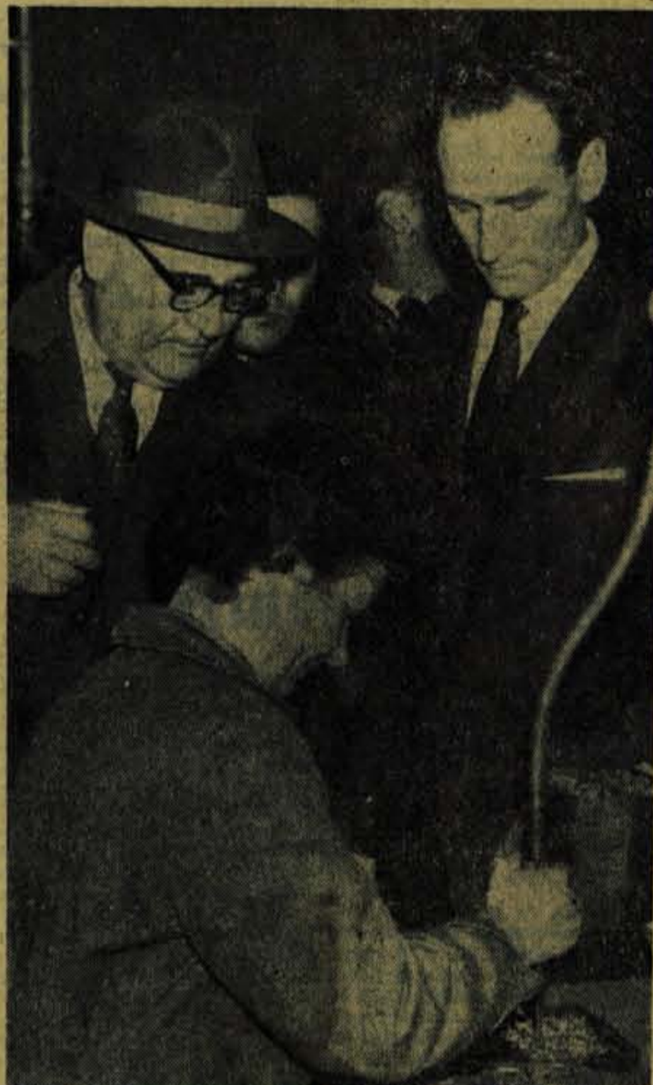
KRANJ, 28. novembra — Predsednik državnega sveta in prvi sekretar Romunske delavske partije GHEORGHE GHEORGHIU DEJ je včeraj v spremstvu svojih sodelavcev in najvišjih predstavnikov naše republike obiskal tovarno Iskra v Kranju. Deležen je bil nadvse prišernega sprejema. Vsookoli gostje so si z velikim zanimanjem ogledali tovarniške obrate in se s predstavniki podjetja zadržali v daljšem pogovoru. Ob tej priložnosti je kolektiv Iskre podaril romunskemu predsedniku dva manjša kinoprojektorja in album s slikami