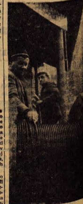
V Kranjski gori urejajo žilnico na Vitranc. Delavci vlečejo nove vrvi žilnice, ki bo zamenjala obrabljeno

in še bolj v sestavljanju predlogov za statute krajevnih skupnosti. Osnovno merilo za območja, delovanje in vlogo teh krajevnih skupnosti pa naj bi bili državljani — ljudje, njihove potrebe in sredstva. — K. M.