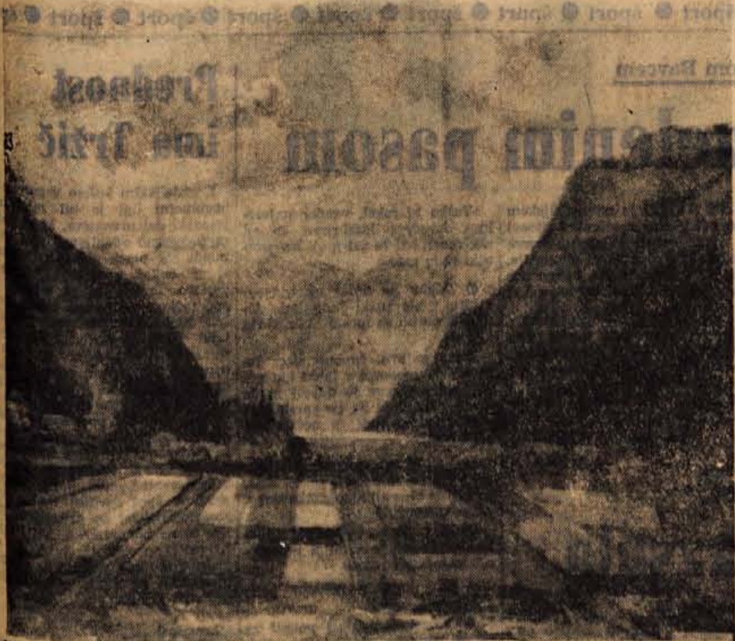
V Prešernovi hiši v Kranju razstavljajo gorenjski likovniki (L. Ravnikar: Bohinjsko jezero)