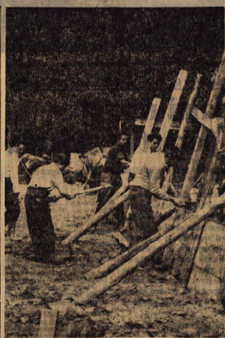
Podjetje »Hudournik« iz Ljubljane urejuje cesto iz Jesenic do Planine pod Golico. Speljali so več ovinkov in zgradili skarpe in jezove, da bo cesta lažje prevozna.

Na prvi etapi žilnice te dni zaključujejo z betoniranjem podstavkov za jeklene podporne. S tem pa hkrati zaključujejo na splošno tudi vsa letošnja dela na trasi zeleniške žilnice. Pomladi bodo namreč pričeli betonirati temelje na drugi etapi, zato bodo semkaj prestavili tudi tovorno žilnico. Glede razmestitve železnih konstrukcij za podporne na prvi etapi pa nekateri menijo, da bi jih na mesta razvlekli po snegu s pomočjo vtila. — P.