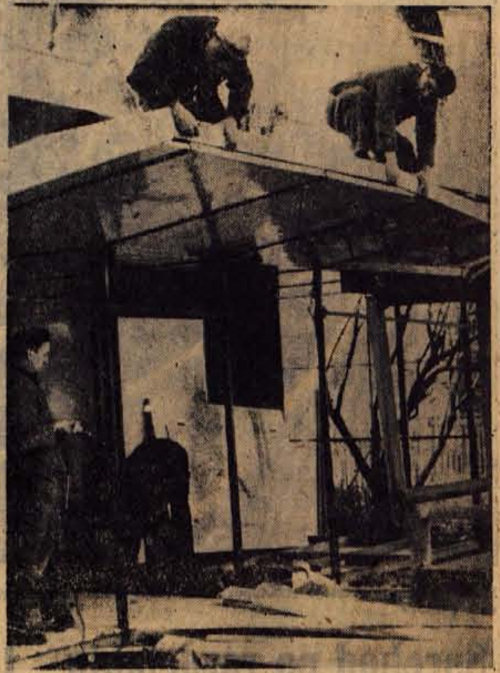
Meža prodajalna kruha v Kranju je zelo slaba, zato jo bo Pekarna dopolnila z večjimi sodobnimi kloaki za prodajo kruha. Prvega, manjšega postavljajo nasproti restavracije Park, drugega pa ob novem mostu čez Kokro. Skupaj bosta veljala 9 milijonov dinarjev. V pogodbi je določeno, naj bi bila oba dograjena do konca tega meseca.