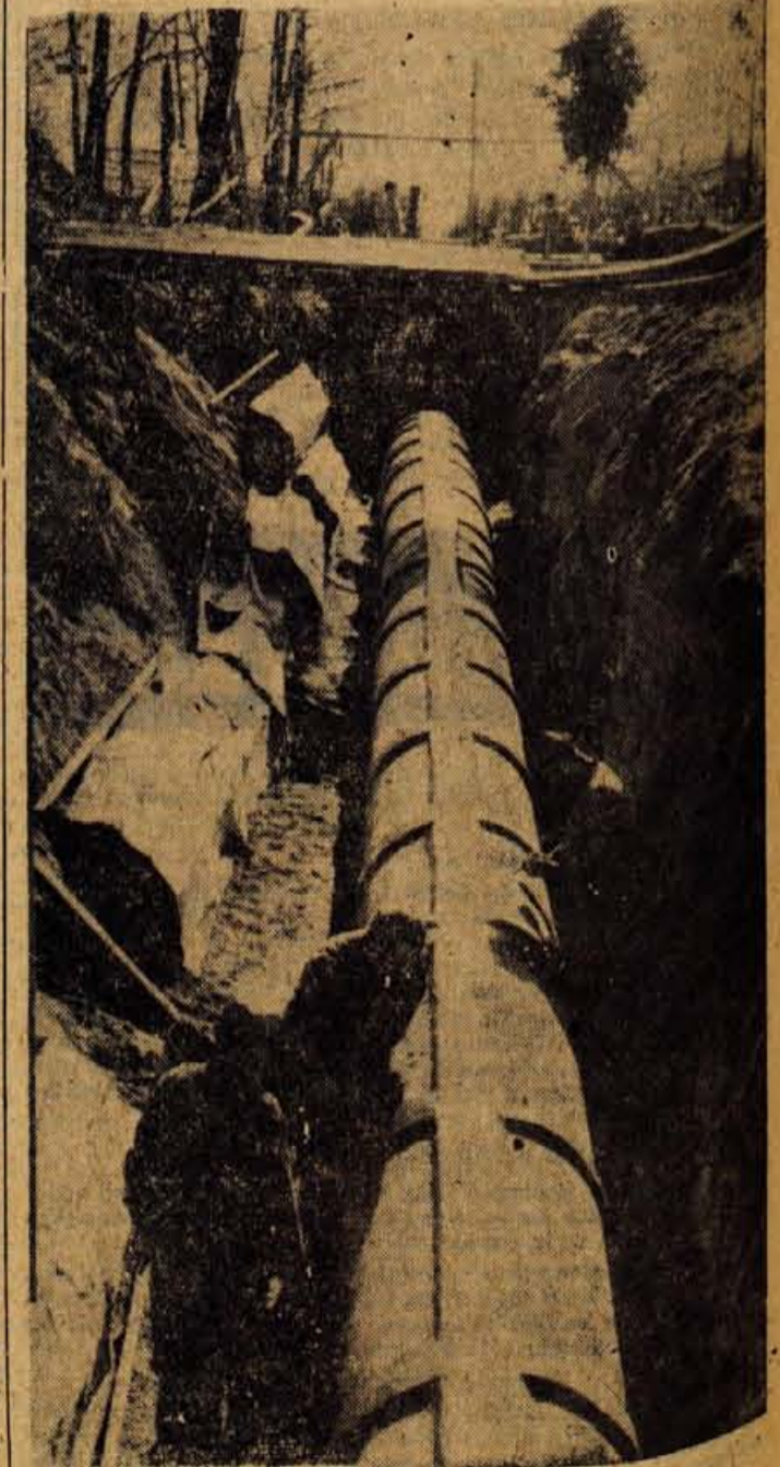
Cevovod do jezera je položen

● šport ● šport ● šport ● šport ● šport ● šport ● šport ● šport ● šport ● šport ● šport ● šport ● šport ● šport ● šport ● šport