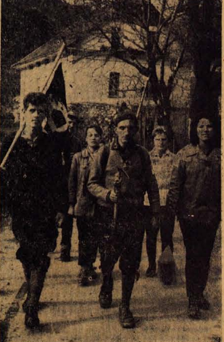
DRAZGOSE, 13. novembra — Včeraj dopoldne je štafeta v počasti- tev 20-letnice II. zasedanja AVNOJ Triglav-Jajce prispela v Draž- goše, od koder je nadaljevala pot v Češnjico, na Martinj vrh, v Poljane, na Crni vrh in naprej proti Vrhniki. Na sliki nosilec planinske štafete na poti skozi Češnjico v Sešid dolin