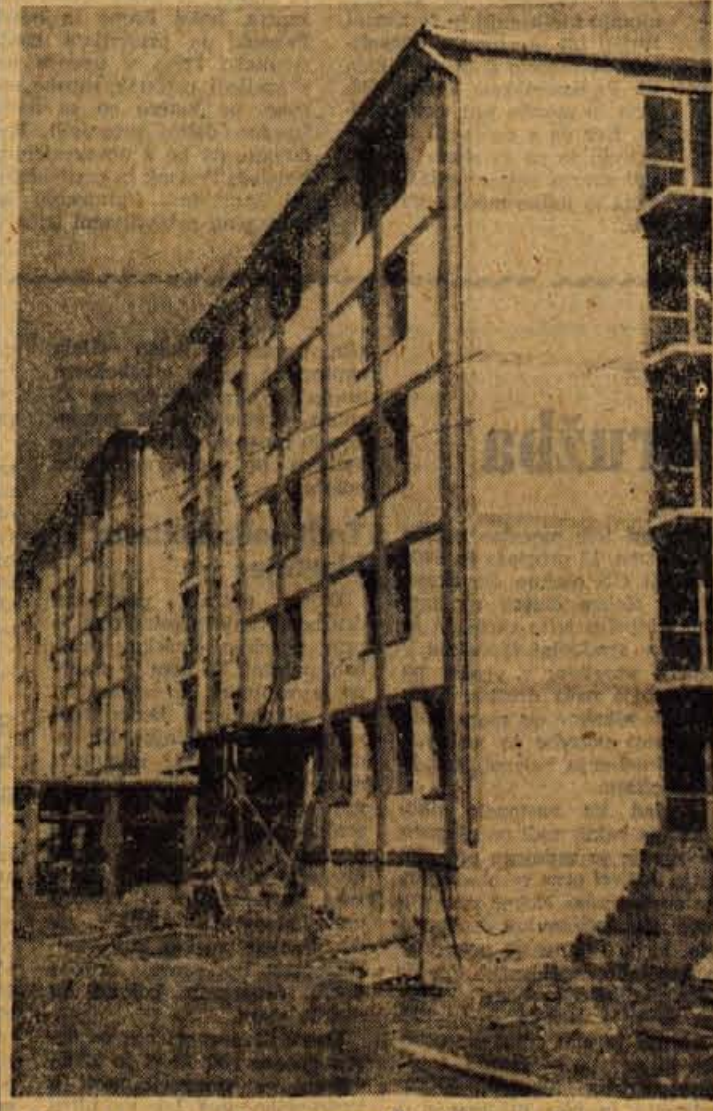
Dela na samskem domu tovarne Tekstilindus v Kranju so se v zadnjem času premaknila. Odprli ga bodo poleti 1964. V njem bodo 104 sobe z eno ali dvema posteljama. Prav tako bo tam restavracija in kuhinja k zmogljivosti 250 obrokov, otroško zavetišče za 40 do 60 malčkov, ena večja soba za razne potrebe in prostori za lekarno, ki jo v Stražišču pogrešajo.

Delo so igralci študirali popolnoma ločeno z domačima režiserjema tov. Klavrom in tov. Valencijem. Okvirno pa je dela povezal prof. Mahnič iz Ljubljane. Premiera, ki bo v petek, bo prav gotovo zanimala Kranjčane, saj bo to prva predstava domače dramske skupine. — T. V.