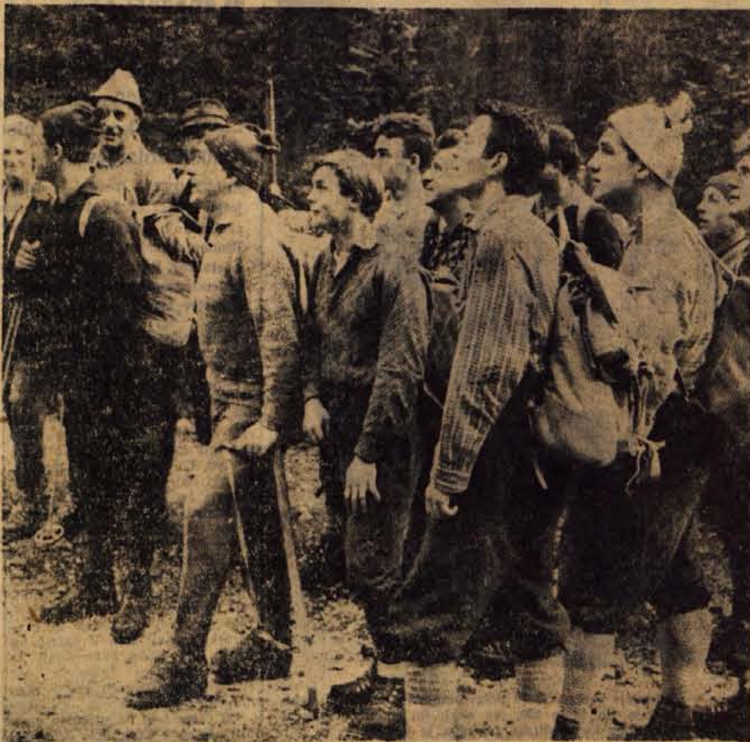
Odhoda štafete Triglav-Jajce sose udeležij številni gorenjski planinci. Na sliki: na poti iz Krme na Triglav

Na konferenci so izvolili novo vodstvo, ki naj bi v prihodnje skrbelo za izvajanje programa mladinske organizacije, pravzaprav poti, ki jo je konferenca začela za prihodnje leto. Govorili so tudi o ureditvi igrišča za najmlajše. Poiskati je treba tudi možnosti za organizacijo drugih zabavnih prireditev za cibibane. Dogradili bodo igrišče za odbojko in košarko, organizirali več krožkov, kot so: strelski, namiznoteniški, šahovski, foto, literarni in drugi; pripravili bodo več predavanj o filmski vzgoji, glasbi in fizični kulturi itd. — A. M.