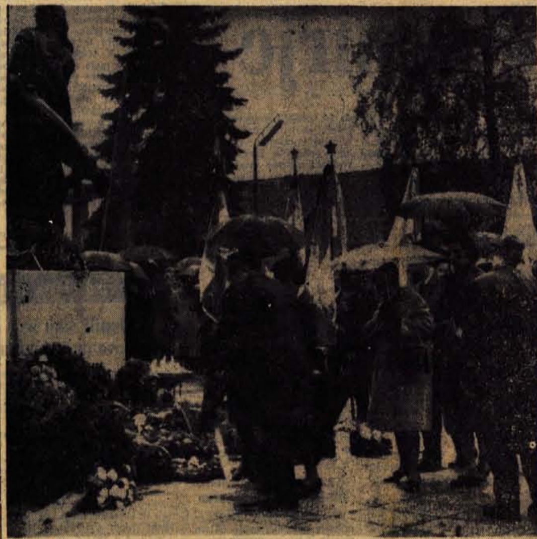
Komemoracija ob dnevu mrtvih na Trgu revolucije v Kranju