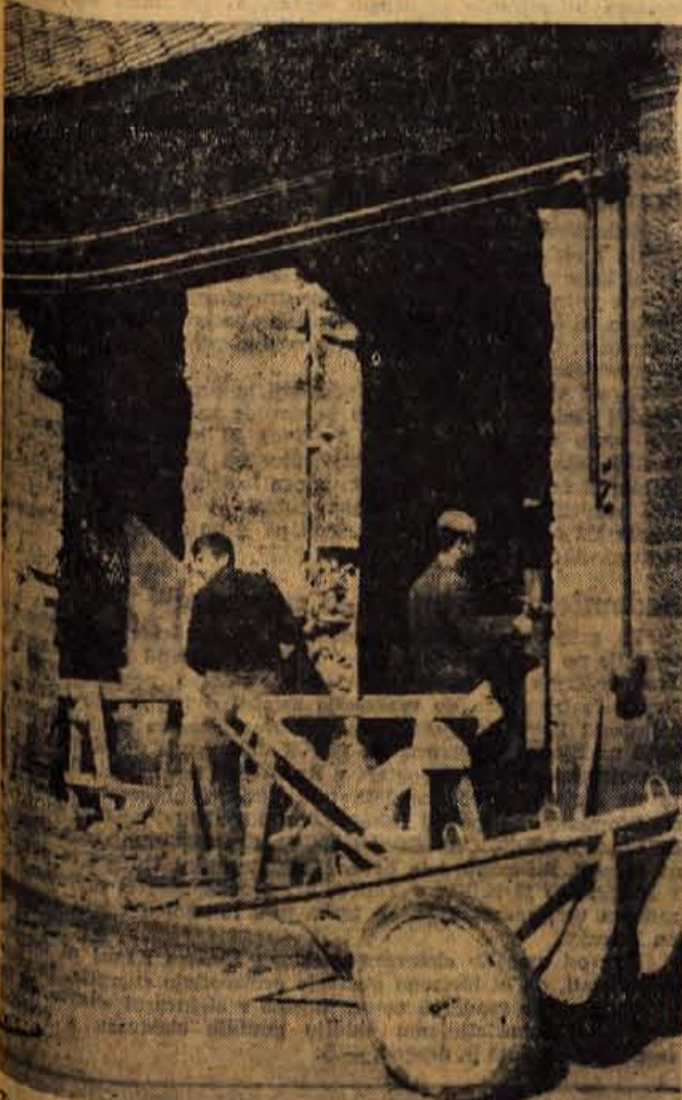
Trgovsko podjetje Agraria Kranj bo dobilo za prodajalno na Jesenicah nov prostor. Pred dnevi so začeli preurejati prostore bivše železarnice na Cesti železarjev. Domnevaajo, da se bodo v nove prostore preselili že po nekaj tednih

● Pomen rekonstrukcije jeseniške Železarne je za našo industrijo in s tem za naše gospodarstvo naravnost oigromen. Z novimi valjarnami in ostalimi rekonstrukcijami bo doseženo povečanje proizvodnje surovega jekla za okrog eno tretjino milijona ton. Doseženo bo izboljšanje kvalitete jekel, kvalitete končnih proizvodov, olajšano bo delo v grapi martinarne in v valjarnah, povečana pa bo tudi dobiti. Gradbena podjetja izkoriščajo lepo jesen za zunanja dela, da bodo v zimskih mesecih lahko nadaljevali z deli pri izkopih in betoniranju temeljev za strojne naprave in montiranje strojnih naprav. — U.