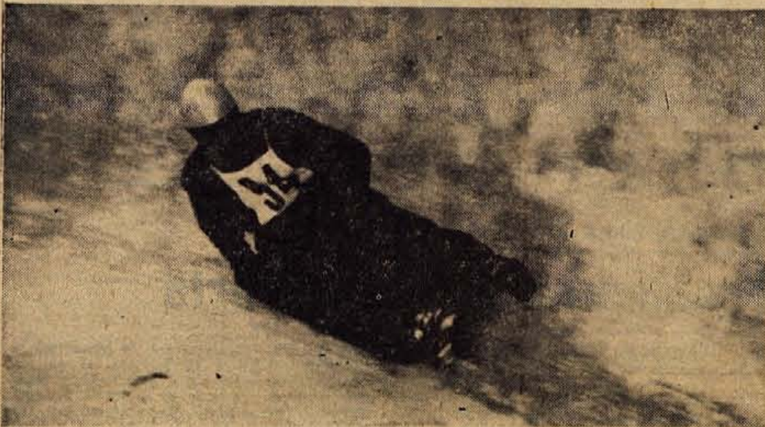
Razen naših najboljših sankacev, ki so trenutno na svetovnem prvenstvu v Zahodni Nemčiji, so včeraj vsi gorenjski predstavniki te panoge tekmovali za pokal Kranja na Smarjetni gori.