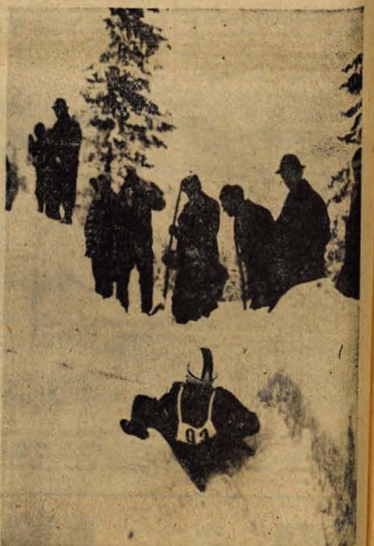
Takole so se včeraj po sankiški progi (cesti) s Smarjetne gore spuščali tekmovavci iz vseh gorenjskih klubov

bi ustanovili samostojen zavod za vzdrževanje športnih objektov, tako kot je to urejeno na Jesenicah. Predlog bodo dali svetu za telesno kulturo ponovno obravnavo. — C.