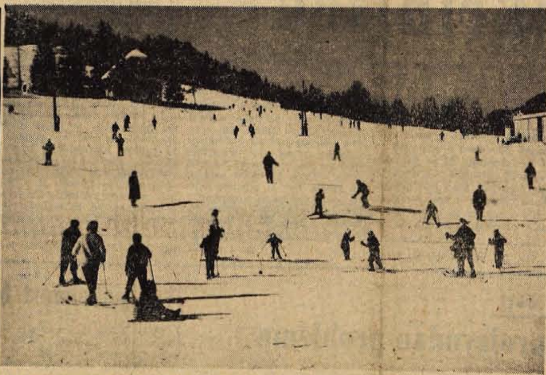
Za letošnje polletne šolske počitnice je zima kot nalašč naklonjena najmlajšim smučarjem in sankarjem. — Na sliki: zimsko veselje v Kranjski gori

Turistična direkcija na Bledu je skupaj z bivšo delavsko univerzo prirejela posebne tečaje, namenjene največ ljudem, ki bi vodili turiste po raznih krajih in jih seznanjali s kulturnimi, zgodovinskimi in drugimi turističnimi posebnostmi. Tečaji so se sicer uspešno končali in za začetek tudi dosegli svoj namen, vendar pa so zajeli vse premalo ljudi. Letos razpisuje delavska univerza Radovljica in sodelovanje z Gorenjsko turistično zvezo in turistično direkcijo Bled dober seminar. Program seminarja zajema teme iz vseh predmetnih vrst, ki so v tesni zvezi s turizmom. Poleg kulturnih, zgodovinskih, geografskih, turističnih in organizacijskih problemov bodo obravnavali tudi gospodarstvo v občini Radovljica in zgodovino NOB, na vrsti pa bodo tudi zelo aktualne teme, kakor so: lik turističnega delavca in njegova osebnost, odnos do turistov in domačih gostov ipd. Tečaj je predviden za 36 ur po dva dni tedensko, začel pa bodo z njim v februarju na Bledu. — J. B.