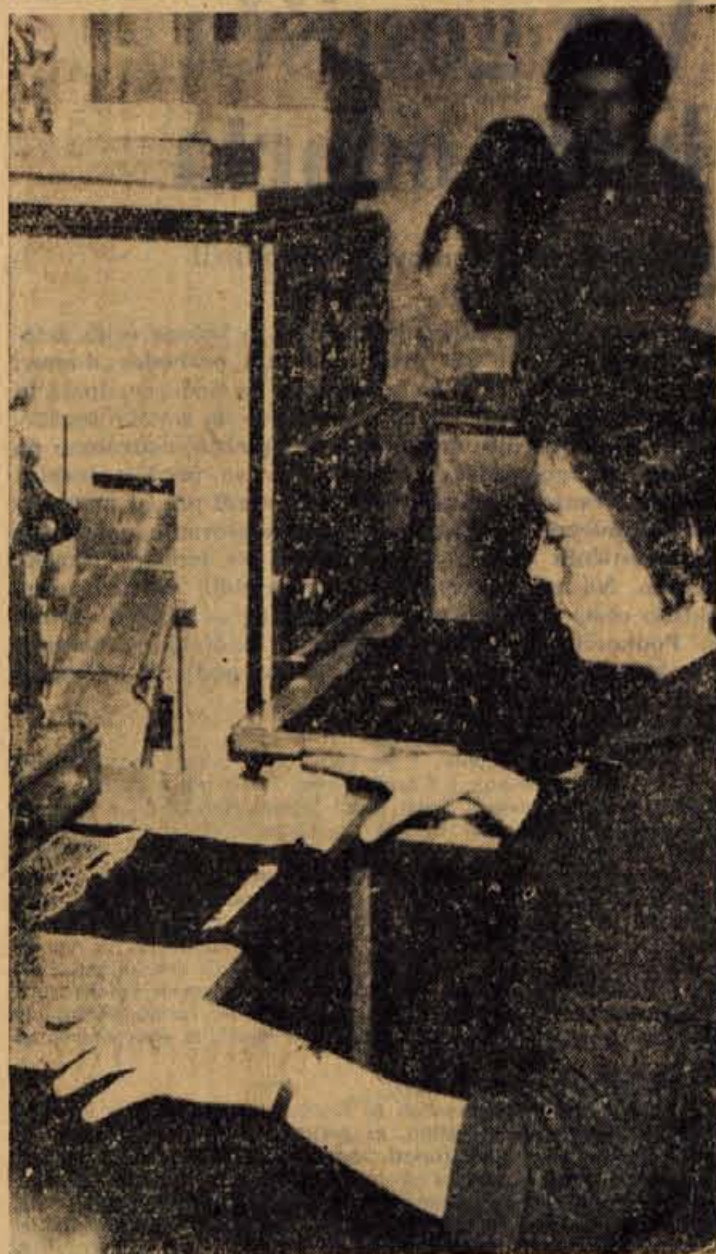
Dokaj skromna oprema sovodenskega Termopola — trije stroji za varjenje plastičnih mas — ne zadošča potrebam oziroma naročilom, ki prihajajo