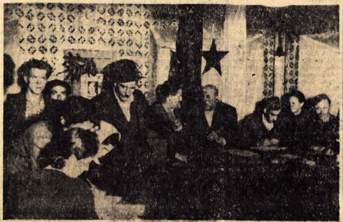
Puške, titovke, zastave in dobro razpoloženje volivcev je dajalo posebno obeležje ob postavljanju prve, resnično ljudske oblasti. Na sliki volitve NOO na Brezovici pri Kropi oktobra 1944 (dokument oddelka NOB v Muzeju Kranj)

Sovodenj je naša artilerija pobila v postojanki 40 financarjev in 30 ranila. Vse postojanke so naše enote zasedle. Nemške patrole so naši napadli pri Gorenji vasi, Leskovcu, pri Bukovem, pri Krizah v bližini Golnika in pri Selcih. Razbite so bile železniške postaje Jošt pri Kranju, Podnart in Zabrica. Minerji so minirali progo pri Skofji Loki. Uničen je bil vojaški vlak, 110 Nemcev mrtvih in 20 lažje in težje ranjenih. Minirana je bila proga med Radovljico in Jesenicami: iztirjen je bil vlak in uničenih 6 vagonov, ostali pa težko poškodovani. Pri Dobravi je bil razbit vlak, pri Bledu je bila uničena lokomotiva in poštni vagon, pri Joštu je bil iztirjen in uničen tovorni vlak. Cesta Skofja Loka — Blegaš je bila močno poškodovana. Sabotažne skupine so poškodovale na Gorenjskem 4 tovarne, uničile 1 motocikel s priklopliko in iz skladišča zaplenile: 1 minomet, 2 puškomicultraže, 22 pušk, 3 pištole in telegrafski kabel (iz vojnega poročila glavnega štaba NOV in