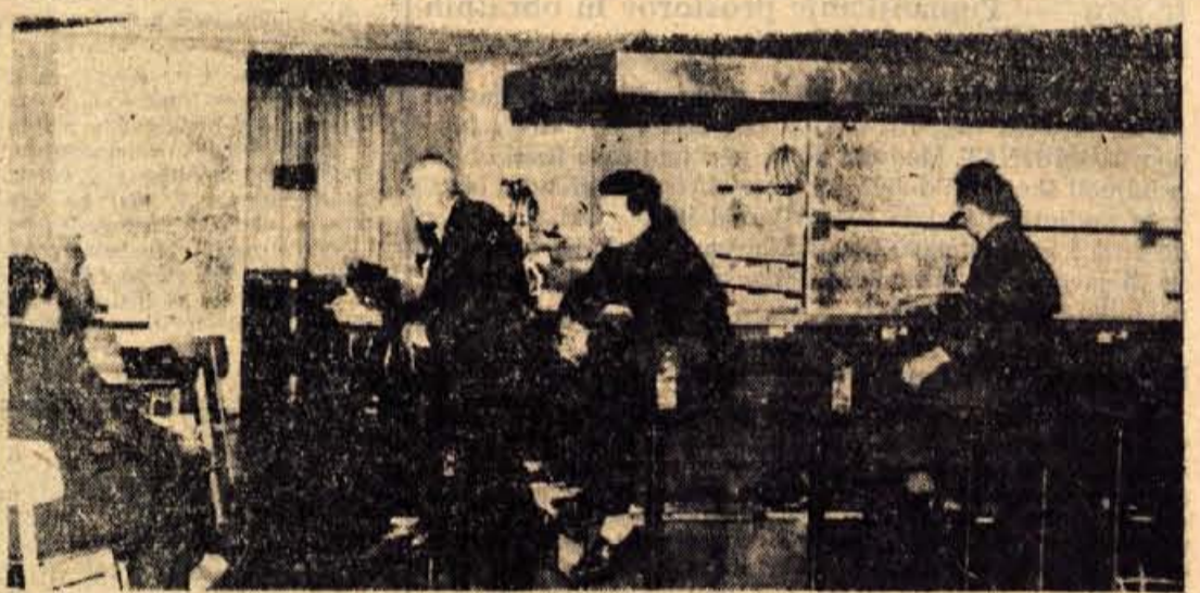
Kranjska gora, 5. oktobra — Danes bodo odprli restavracijske prostore hotela Prisank v Kranjski gori. Ti prostori so bili sicer odprti že v času planiškega tedna, vendar so jih kasneje spet zaprli.

četrtek, 3. oktobra, zvečer z otvoritvijo javne razsvetljave v Cerkljah. Po otvoritvi je sledila slavnostna seja krajevne skupnosti, na katero so povabili tudi predstavnike krajevnih političnih in društvenih organizacij. Po slavnostni seji je bila v združenem domu še slavnostna akademija. Program so pripravile domače organizacije. Za zaključek praznovanja bo v nedeljo dopolne zborovanje pri sponemniku padlih borcev na Davovcu, popoldne pa bo sledila ocenjevalna vožnja AMD Cerklje