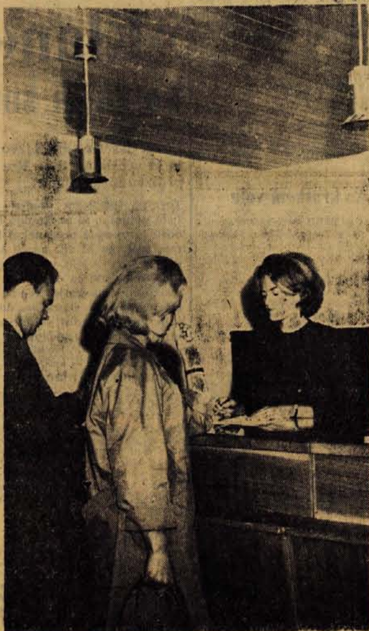
K turističnemu kraju sodi tudi prikopno urejena turistična pisarna, ki jo je Kranjska gora dobila pretekli teden.

● V ŽIROVNICI želijo ustanoviti stanovanjsko skupnost. O ustanovitvi bodo razpravljali na zborih volivcev, ki bodo v teh dneh. Nov družbeni organ — stanovanjska skupnost, bo velikega pomena za nadaljnji razvoj Žirovnice in njene okolice.