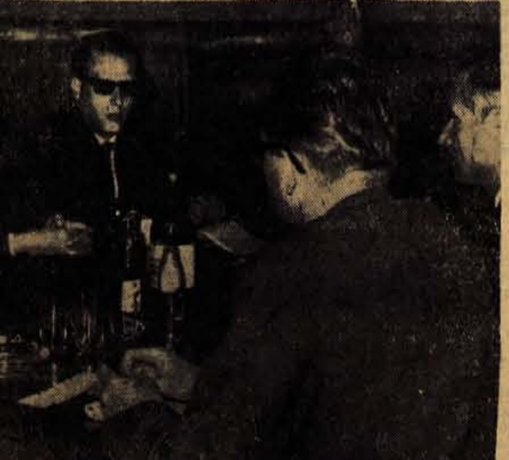
SKOFJA LOKA, 2. oktobra — Včeraj je obiskala Loške tovarne hladilnikov delegacija madžarske elektroindustrije, ki je obiskala našo državno z namenom, da prouči možnosti industrijsko-tehničnega sodelovanja. S predstavniki podjetja so se razgovarjali o proizvodnji; del omenjene delegacije pa je obiskal tudi Iskro v Kranju (od koder je tudi posnetek).

Ob koncu septembra so se na območju komunalne skupnosti socialnega zavarovanja delavcev občine Radovljica in Jesenice začeli zbori zavarovancev. Zaključeni bodo predvidoma prihodnji teden. Z udeležbo na zborih, na katerih se član skupščine razgovarjajo o dokaj pereči problematiki socialnega zavarovanja na tem območju, se ni mogoče pohvaliti. Udeležuje se jih po 40 do 60 za-