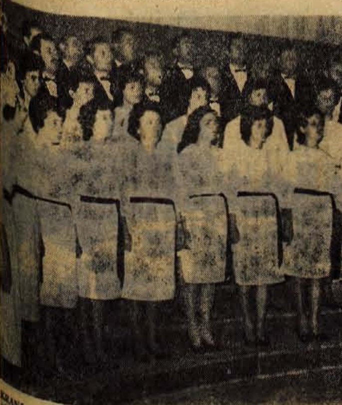
Kranj, 1. oktobra — Sinoči je v dvorani kina Center v Kranju nastopil ansambel narodnih plesov in pevski zbor kulturno-umetnega društva »Stif Naumov« iz Makedonije

Zabnica — Svet krajevne skupnosti v Zabnici je imel minul teden kar dve zaporedni seji, na katerih je obravnaval naloge in predstavi del razprave so posvečeni v ceste, slabo električno omrežje in drugo. Zgornji del vasi Štutna nima javne ceste. Projekt je postal tako pereč, da so pričeli z gradnjo primerne ceste, za katero je bila odobrena že v letu 1961. V vasi ima tudi izredno slabo električno omrežje in javno raz-