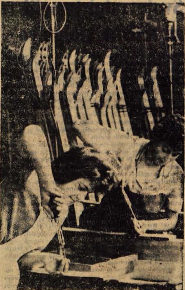
Delavke pri eni izmed zadnjih faz obdelave smučí