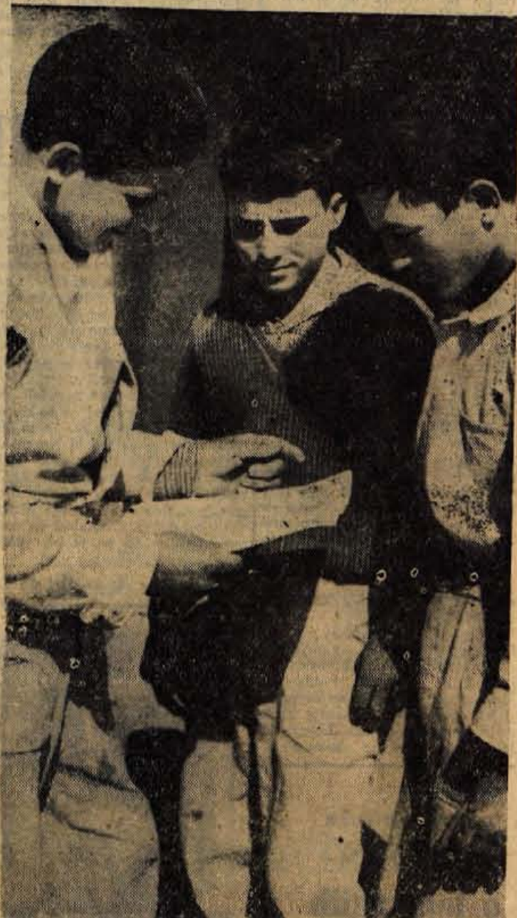
KRANJ, 1. oktobra — Danes so se pridružili akciji za vpis ljudskega posojila za obnovo Skopja tudi delavci na gradbiščih gradbenega podjetja Projekt Kranj. Med številnimi delavci, ki so sorazmerno vpisali precejšnje zneske, niso hoteli izostati tudi trije vajenci prvega letnika zidarske stroke. Objektiv jih je ujel prav tedaj, ko je vsak izmed njih vpisal po dva tisoč dinarjev.