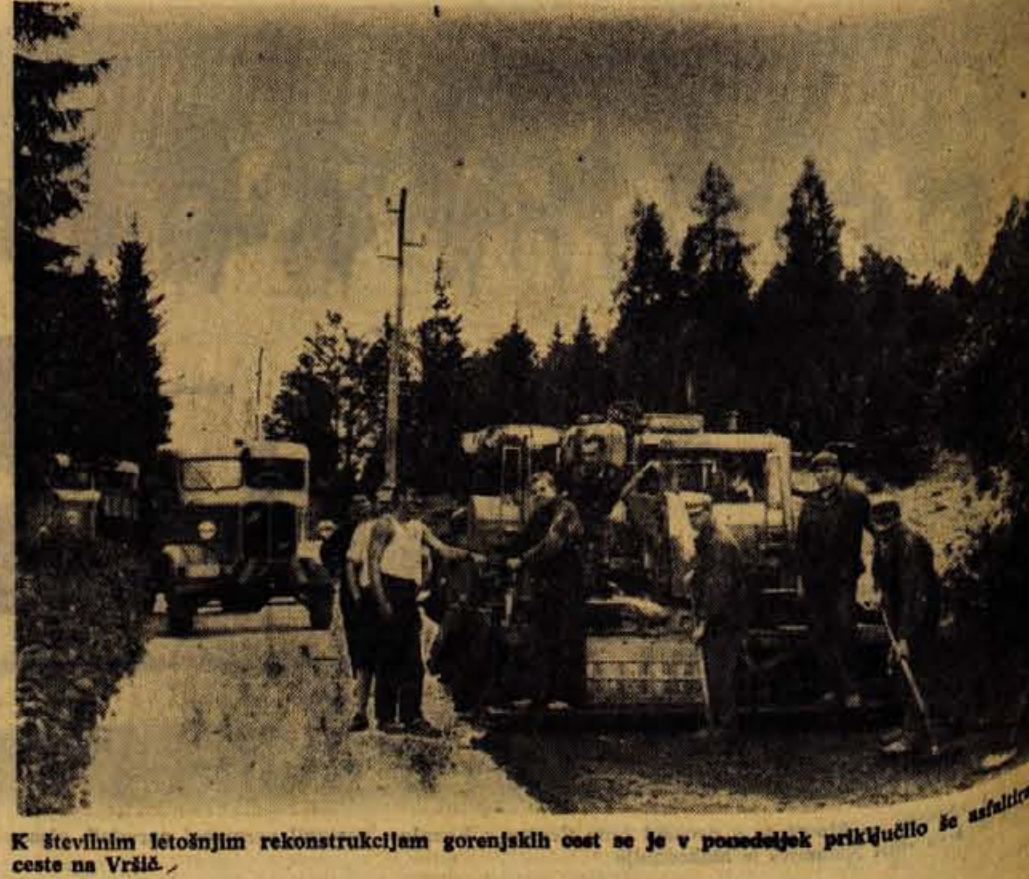
K številnim letošnjim rekonstrukcijam gorenjskih cest se je v ponedeljek priključilo še asfaltiranje ceste na Vršič.

KRANJSKA GORA, 30. septembra — Danes popoldne je tu ob hotelu Erika Cestno podjetje v Kranju položilo prve metre asfalta na našo visokogorsko cesto, ki pelje na Vršič. Po asfaltiranju ceste na Podkorensko sedlo — tudi ta dela je pretekli teden opravilo Cestno podjetje v Kranju — je torej prišla na vrsto tudi vršička cesta, ki je z naraščajočim turizmom oziroma s čedalje večjo turistično povezavo med Gorenjsko in Primorsko vedno bolj obremenjena. Spritico tega je asfaltiranje te naše visokogorske ceste še toliko pomembnejše.