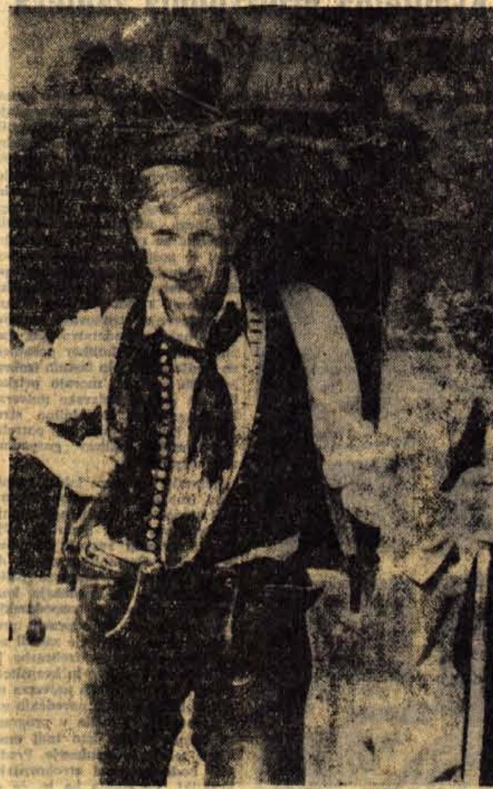
Tudi tale planšar je prišel na KRAVJI BAL, ki so ga v Bohinju priredili pravzaprav njemu in njegovim tovarišem na čast. S planine je prišel v značilni obleki in z vso »kramo«, ki jo je — poleti, ko je pasel krave — potreboval v plani.