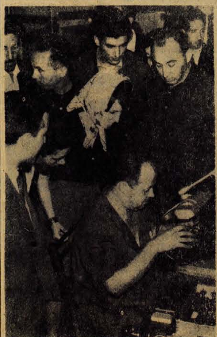
Skupina 26 alžirskih partizanov je med svojim bivanjem pri nas ob prihodu v Slovenijo takoj obiskala tovarno Iskra Kranj, kjer so se predvsem zanimali za naš sistem delavskega samouraviljanja.

Na Gorenjskem imamo srednji tehniški šoli v Kranju in na Jesenici (prva je imela v preteklem letu 460 slušateljev, druga pa 163), ekonomsko šolo Kranj z oddelki za odrasle v Kranju, na Jesenicah, v Radovljici, Škofji Loki in Trzinu, šolo za ambulantno strokovno smer na Jesenicah in še nekaj drugih šol, ki bodo predmet razgovora v prihodnji razpravi. Razen tega pa bo glede na potrebo po kadrih na našem območju treba posvetiti najširšo pozornost obravnavi vseh vrst šol omejenega stopnja. — S.