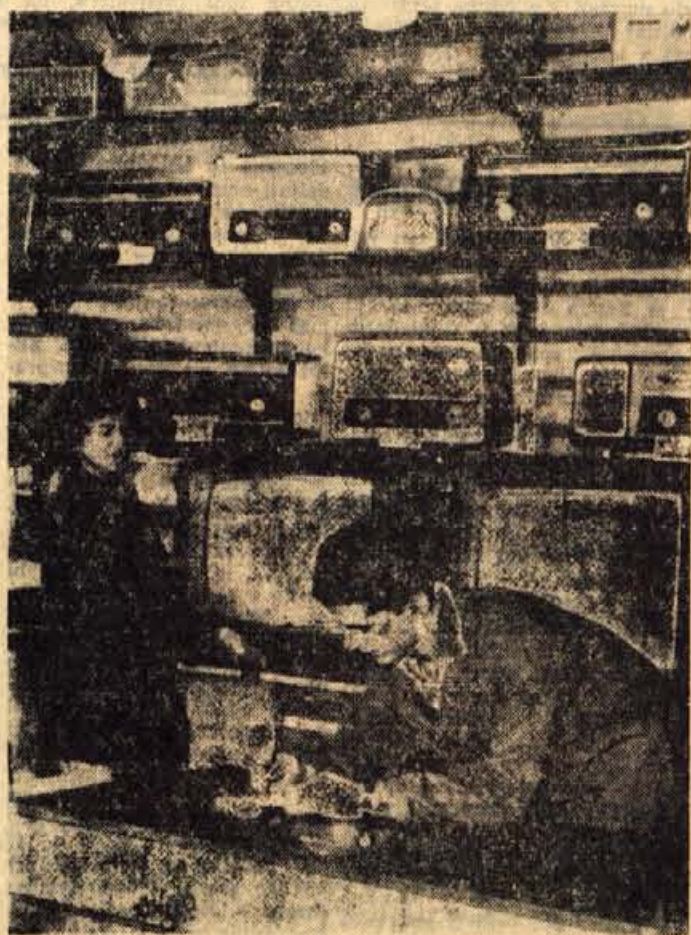
Trgovsko podjetje »Murka« Lesce je v ponedeljek odprlo novo prodajalno z elektrotehničnim materialom in gospodinjstvi potrebščinami. Lokal so pridobili na ta način, da so adaptirali skladišče trgovskega podjetja v Lescah

● RADOVLJICA — Komisija za obrambno vzgojo prebivalstva pri delavski univerzi Radovljica je sestavila program predavanja za širši krog občinstva. Od oktobra dalje se bodo po vseh krajih občine zvrstila predavanja s filmi o temah: zaščita prebivalstva pred radioaktivnim sevanjem, obrambne sposobnosti naše dežele in druga. S predavanji nameravajo seznaniti ljudi z zaščito v sodobnem vojskovanju. Pričeli so že lani, ko je podobna predavanja poslušalo kakih 500 ljudi v petih krajih komune.