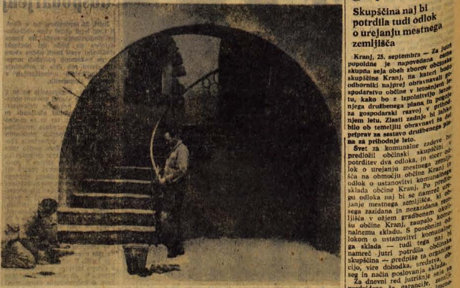
Ljubljansko podjetje »Filmservis«, ki nudi usluge enodnevneški filmski hiši »Musichaus«, pripravlja v prostorih blejske Kazine sceno za filmsko komedijo, ki jo bodo nemški producenti snemali pri nas

OBVESTILO VPISNIM MESTOM LJUDSKEGA POSOJILA OBČINE KRANJ Vse informacije v zvezi z ljudskim posojilom daje služba družbenega knjigovodstva Kranj od 7. do 14. ure po telefonu 28-55 in terno 4, od 14. do 17. ure pa na telefonu 29-10