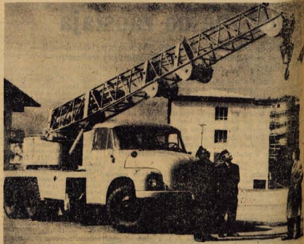
Kranjska poklicna gasivska enota je te dni nabavila iz Čehoslovaške novo za gasivske in druge potrebe primerno vozilo — avtodvigalo. To vozilo, ki lahko dvigne do šest ton, bodo s pridom uporabljali pri dviganju in izvlečanju različnih bremen.

Premalo se zavedamo, da izobraževanje strokovnih kadrov v podjetjih ni samemu sebi namen, pač pa mora zadovoljevati potrebe proizvodnje. Premalo se zavedamo nadalje, da rastejo oblike