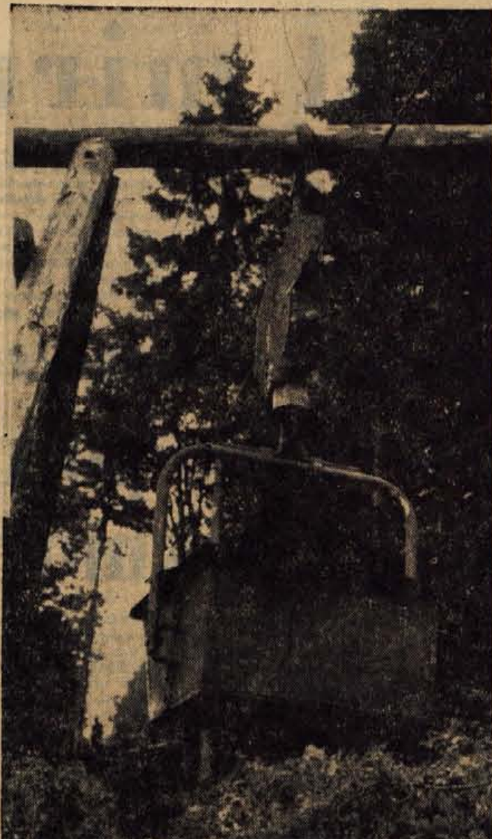
S pomočjo tovarne žičnice dovažajo na mesta beton in ostali potrebni material za betoniranje podpornih temeljev

Najširša obravnava teh in ostalih problemov šolstva naj pripomore k aktivizaciji občanov, da sodelujejo s svojimi predlogi pri njihovem reševanju. — S.