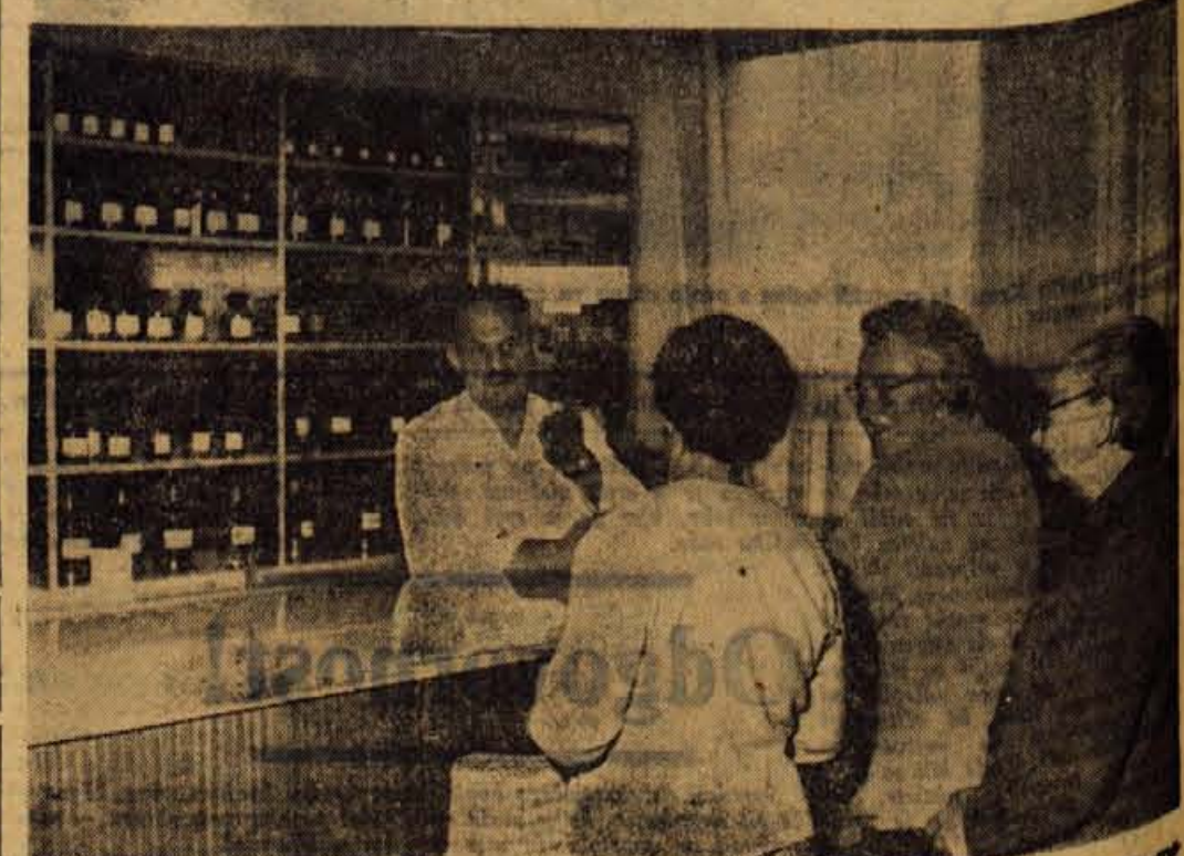
Lekarna v Kranjski gori, ki ima svoje prostore v zdravstvenem domu in je bila odprta pred enim mesecem, ima vedno dovolj strank. Kranjskogorčani in okoljčani so čakali na lastno lekarno več kot leto dni, dočakali pa so jo in jo le imajo

Jezerško — Slabo avgustovsko in septembrsko vreme je vse do sedaj onemogočalo izvedbo že napovedanega OVCARSKEGA BALA, ki ga pripravljajo turistični in gostinski delavci na Jezerskem. Sedaj so se odločili, da bo leta naslednje nedelje, 22. septembra, pri Planšarskem jezeru na Jezerskem. Vsakoletna tradicionalna prireditve privabi številne domačine, okoljčane in tudi tujce. — Č.