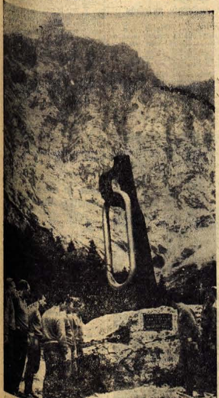
Član alpinistične odprave iz Kijeva (Ukrajina) se že nekaj dni ukvarja v naših gorah. — Na sliki jih vidimo pred spomenikom padlih gornikov v Vratih

V zadnjih letih so nastale razne oblike sodelovanja med podjetji sorodnih dejavnosti. Med raznimi takimi organizacijami širšega merila je nastalo tudi združenje Bombažne industrije s sedežem v Ljubljani. V to združenje se je