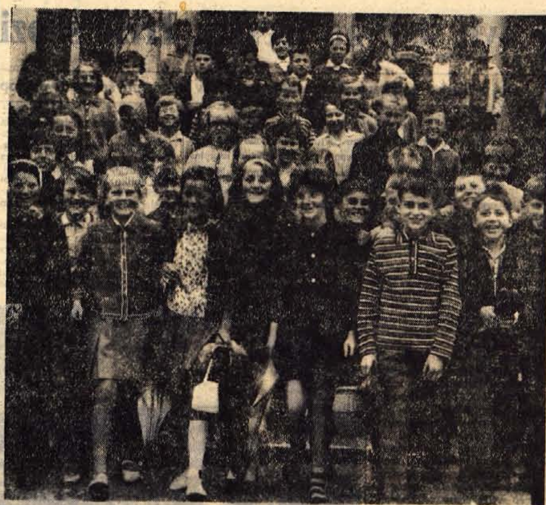
Veseli obrazi ob pričetku novega šolskega leta. Upajmo, da večšina ne bo izginila in da jih bo spremljala vse do novih počitnic

Za letošnje leto je za Jesenice značilna močna fluktuacija delavcev. V železarni se je do polletja premenjalo 37 odstotkov več delavcev kot v istem obdobju lanskega leta (več kot 500 po številu). Na območju občine je število fluktuiranih delavcev v prvem polletju letošnjega leta skoraj doseglo število 1200. Vzroke za to lahko iščemo v dveh smereh. Precej jih je v tem, ker sprejemanje delavcev ni urejeno in posebno pri nekvalificiranih delavcih sploh niso v veljavi nobeni kriteriji. Navadno se podjetja branijo zaposliti delavce, ki jim je iz delavskih knjžic mogoče razbrati, da na vsakih nekaj mesecev menjajo zaposlitev. Razen tega pa tudi skrb za delavce na delovnem mestu marsikje močno šepa, neurejeni so medsebojni odnosi in podobno. Marsikaj od tega bi bilo mogoče odpraviti, saj je brez posebnih analiz o tem, koliko poslovne škode prinaša prekomerna fluktuacija, jasno, da se proti njej splača boriti. — S.