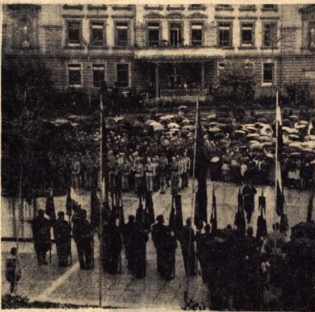
Zbor Prešernove brigade na Trgu revolucije v Kranju

Skupščina je sprejela tudi nekatere ustrezne sklepe glede škod, ki jo povzroča jelenjad v dolini Kokre. Izračuni namreč kažejo, da znaša skupna ugotovlje-