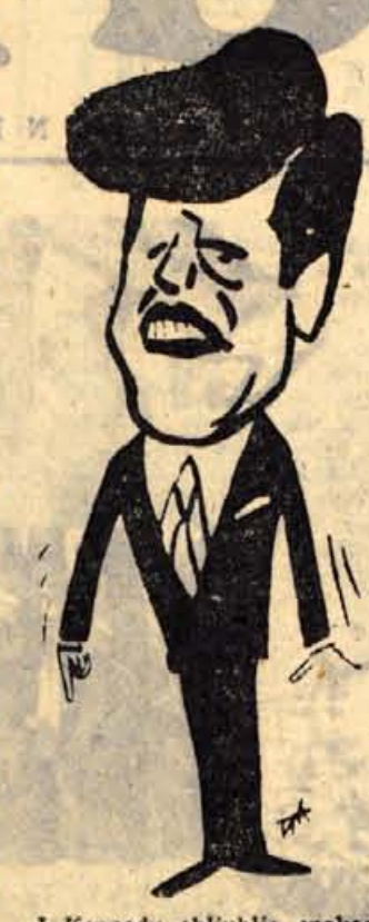
J. Kennedy objublja enakost