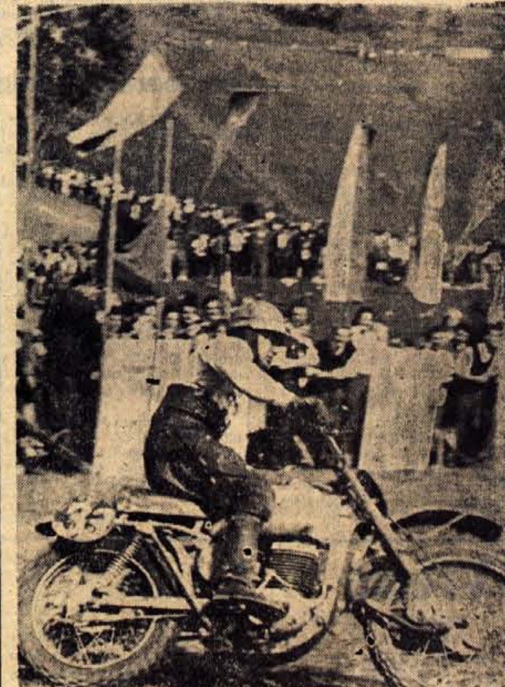
V Podlubljeju je bil včeraj drugi mednarodni ljubljanski motokros, ki si ga je ogledalo 15 tisoč gledavcev. Tekmovavci iz petih držav so z drzno vožnjo navdušili občinstvo ki ga nova panoga vse bolj navdušuje

Zagreb je nekaj po 12. uri praznično sprejel premiera Hruščova in predsednika Tita z njunim spremstvom. Lepo sončno vreme je dopolnjevalo radostno vzdušje v hrvaškem glavnem mestu. Zlasti prirčno sliko pa so nudili plantiji v narodnih nošah, ki so s svetjem pričakali visoke goste. Premier Hruščov in predsednik Tito sta v družbi z dr. Vladimirem Bakaričem iz odprtega avtomobila nazdravljala Zagrebčanom.