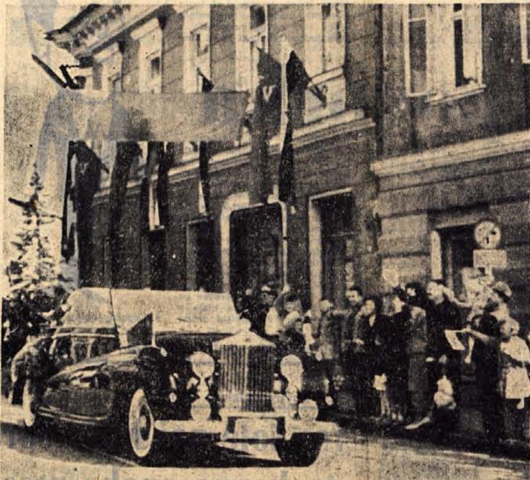
Z včerajšnjim dnem je sovjetski premier Nikita Hruščov zaključil tridnevni obisk v Sloveniji. — V dopoldanskih urah je kolona avtomobilov potovala skozi Kranj proti Ljubljani

Ob pohodu enot skozi partizanske kraje bodo v Farjem potoku odkrili spominsko obeležje v Globeli, kjer je padlo pet partizanov, spominsko ploščo na hiši, kjer je bil oblastni komite KPS za Gorenjsko in na hiši, kjer je bilo Gorenjsko vojno področje. Tudi v mnogih drugih krajih bodo ob tej priliki odkrili spominske plošče in obeležja. — K. M.